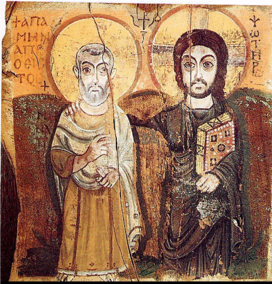
Ο Χριστός και ο Άγιος Μηνάς, εικόνα από το Bawit της Αιγύπτου, 6ος αι. Παρίσι, Λούβρο

Πέρα από την ιδιαίτερη θέση που κατέλαβαν στη λατρεία οι εικόνες, τους απέδιδαν και ευεργετικές ιδιότητες. Ο Θεοδώρητος (393-457/8; μ.Χ.) μας πληροφορεί πως το α' μισό του 5ου αι. μ.Χ. οι Σύριοι έμποροι, κάτοικοι της Ρώμης, προστάτευαν τα εμπορικά καταστήματα και τα σπίτια τους με τις εικόνες του εθνικού τους Αγίου Συμεών του Στυλίτη. Επίσης, είναι γνωστή η συνήθεια των πιστών κατά την Βυζαντινή Περίοδο, οι οποίοι, όταν ταξίδευαν από περιοχή σε περιοχή, έφεραν μέσα από τον οδοιπορικό χιτώνα, στο στήθος τους, κάποιο εικονίδιο του Χριστού, της Παναγίας ή Αγίου, για να τους προστατεύει από κάθε κίνδυνο.