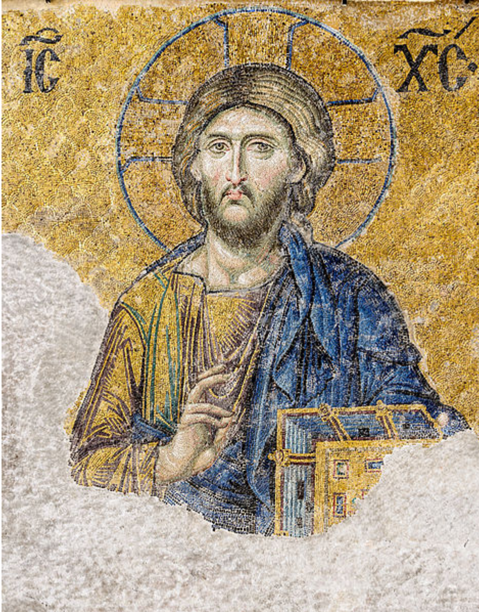
Ο Χριστός Παντοκράτωρ, τμήμα από βυζαντινό ψηφιδωτό της Δέησης στην Αγία Σοφία της Κωνσταντινούπολης, 1261

/ Επιστήμες, Τέχνες & Πολιτισμός / Ορθόδοξη πίστη