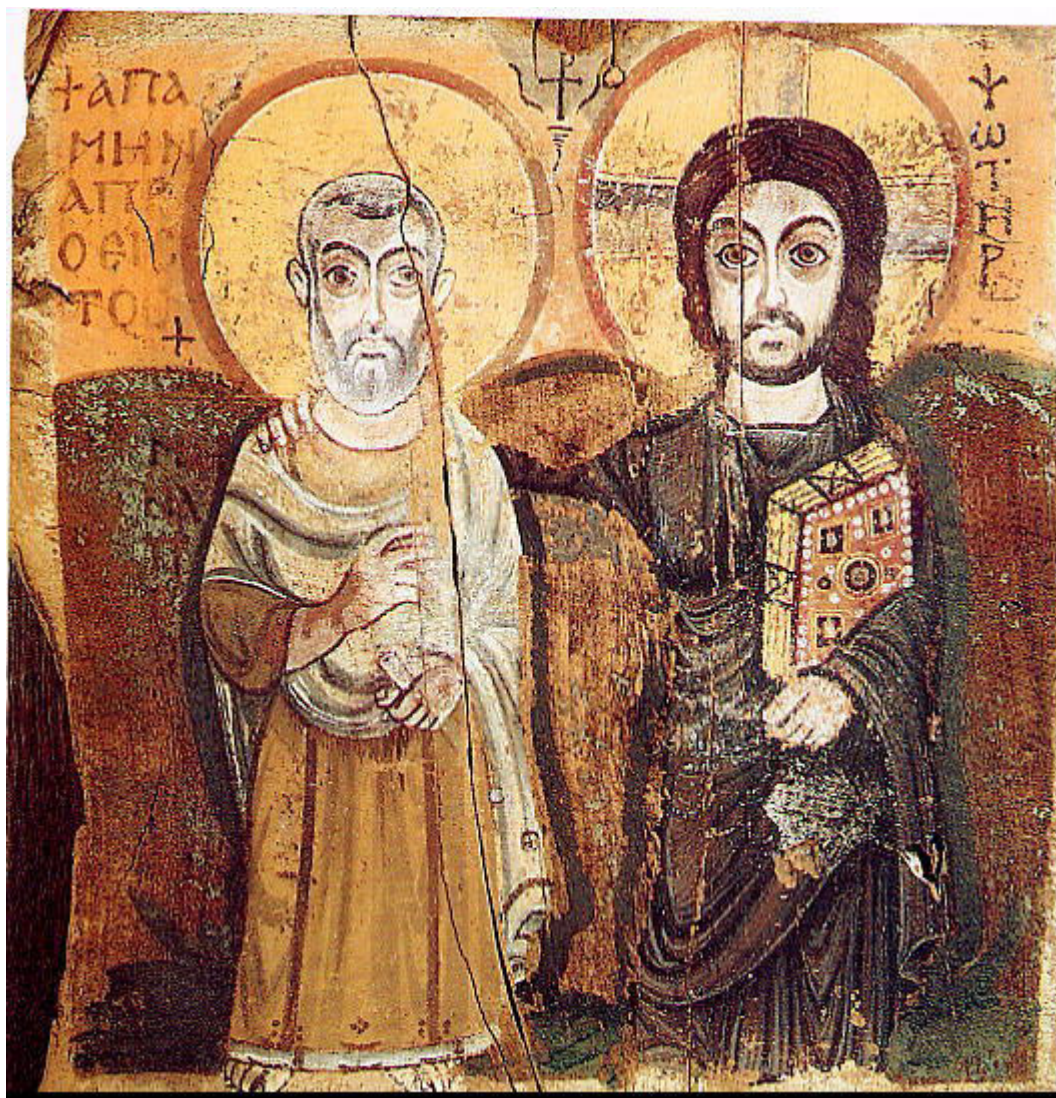
Ο Χριστός και ο Άγιος Μηνάς, εικόνα από το Bawit της Αιγύπτου, 6ος αι. Παρίσι, Λούβρο

Πέρα από την ιδιαίτερη θέση που κατέλαβαν στη λατρεία οι εικόνες, τους απέδιδαν και ευεργετικές ιδιότητες. Ο Θεοδώρητος (393-457/8; μ.Χ.) μας πληροφορεί πως το α' μισό του 5ου αι. μ.Χ. οι Σύριοι έμποροι, κάτοικοι της Ρώμης, προστάτευαν τα εμπορικά καταστήματα και τα σπίτια τους με τις εικόνες του εθνικού τους Αγίου Συμεών του Στυλίτη. Επίσης, είναι γνωστή η συνήθεια των πιστών κατά την Βυζαντινή Περίοδο, οι οποίοι, όταν ταξίδευαν από περιοχή σε περιοχή, έφεραν μέσα από τον οδοιπορικό χιτώνα, στο στήθος τους, κάποιο εικονίδιο του Χριστού, της Παναγίας ή Αγίου, για να τους προστατεύει από κάθε κίνδυνο.