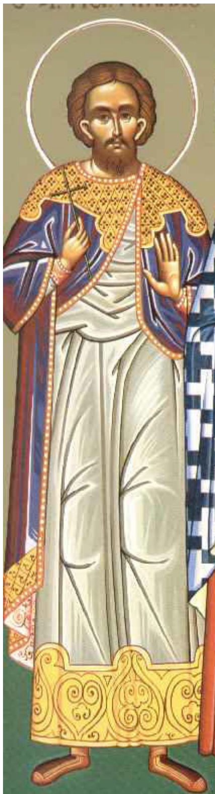
Άγιος Νικήτας ο Γότθος ο μεγαλομάρτυρας