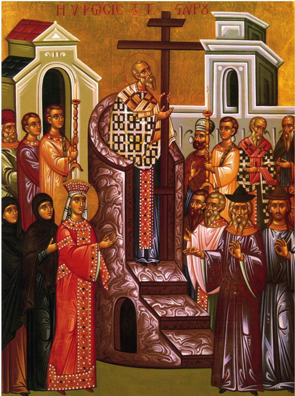
Ύψωση του Τιμίου και Ζωοποιού Σταυρού