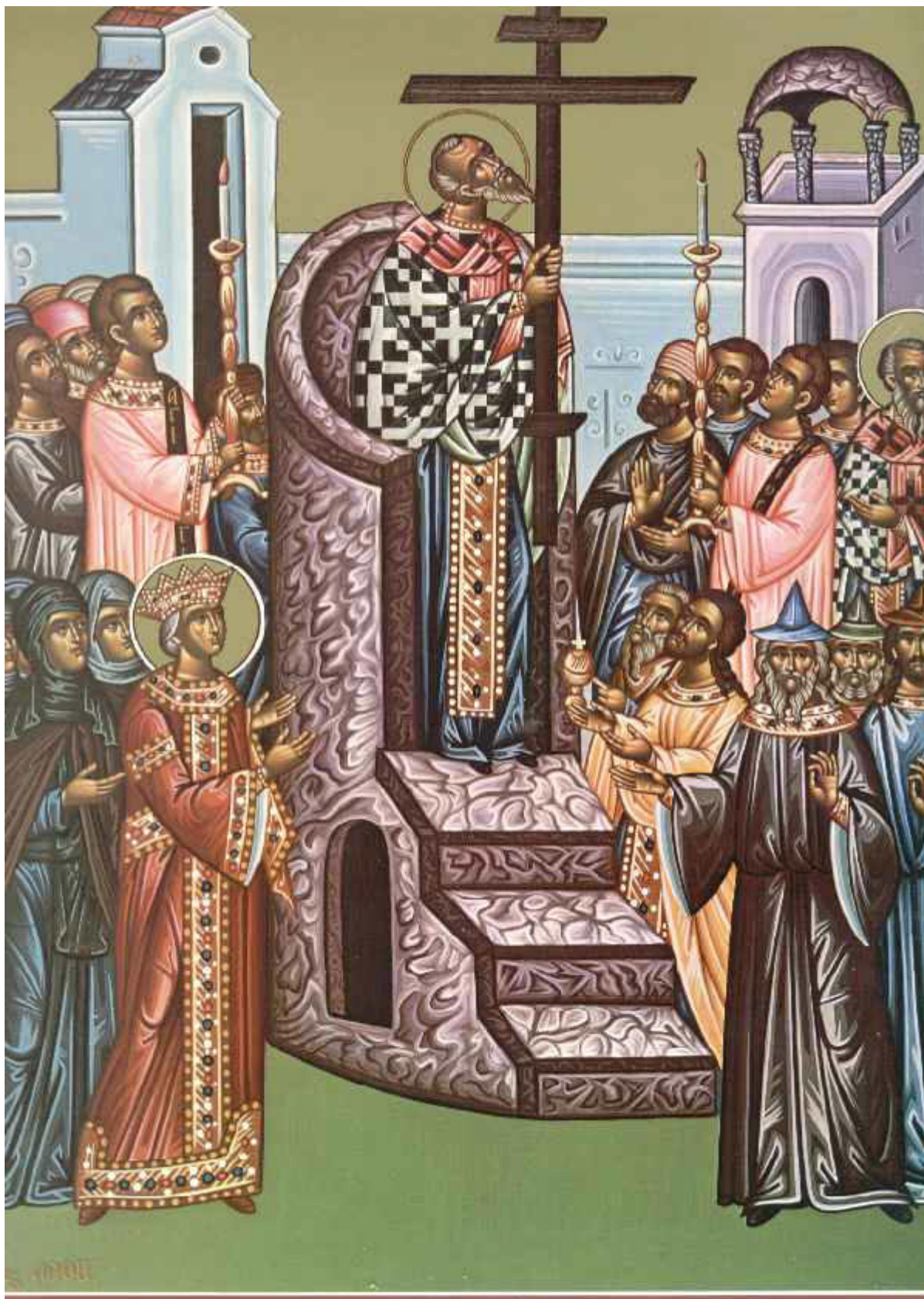
Ύψωση του Τιμίου και Ζωοποιού Σταυρού