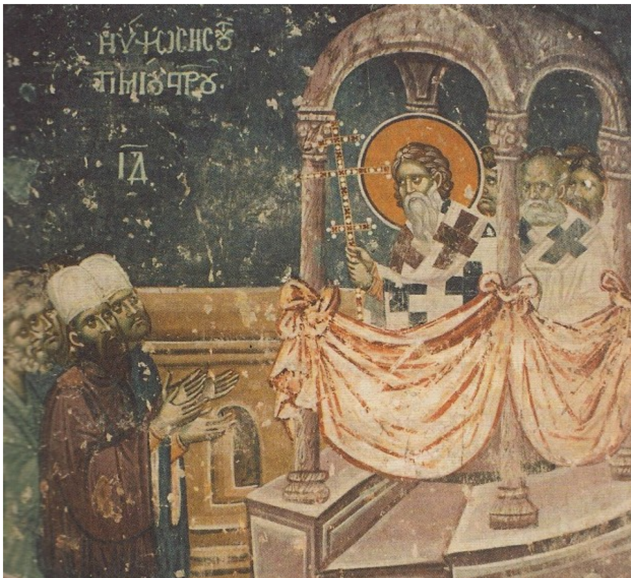
Ύψωση του Τιμίου και Ζωοποιού Σταυρού