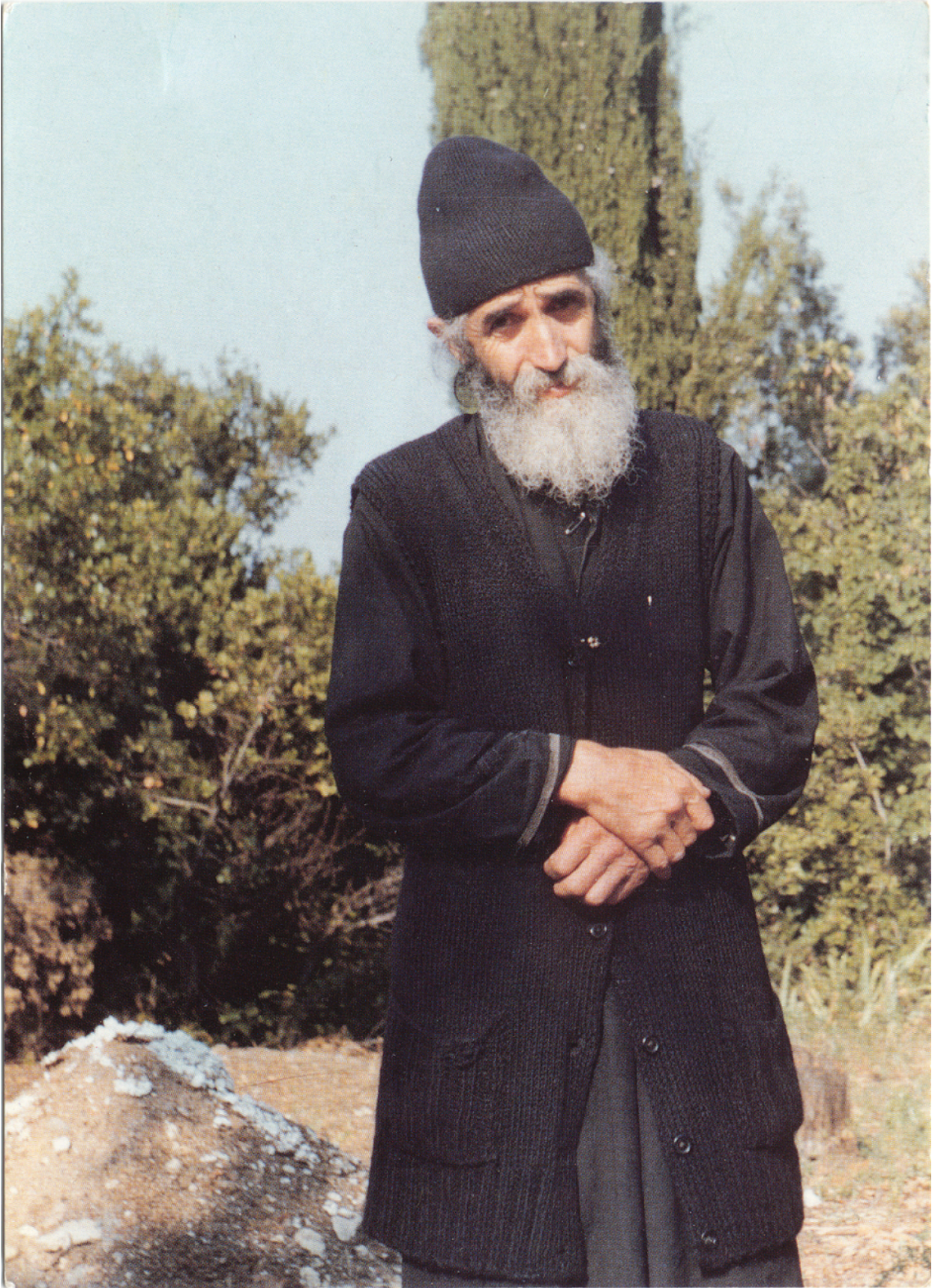
Λόγος εν χάριτι, αλάτι ηρτυμένος (Αναμνήσεις από τον Γέροντα Παΐσιο)