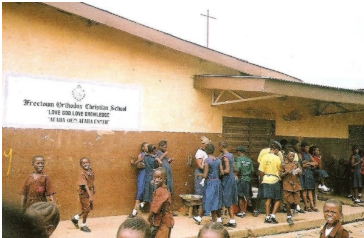
Το Ορθόδοξο Σχολείο του Αγίου Ελευθερίου στην πρωτεύουσα Φριτάουν (Freetown) στην Σιέρα Λεόνε (Sierra Leone)

Στη Σιέρα Λεόνε εδώ και έντεκα χρόνο άρχισε ιεραποστολική προσπάθεια με τις ευλογίες του Μακαριωτάτου Πάπα και Πατριάρχου μας κ. Θεοδώρου Β΄ από τον Πανοσιολογιώτατο Αρχιμανδρίτη π. Θεμιστοκλή Αδαμόπουλο.