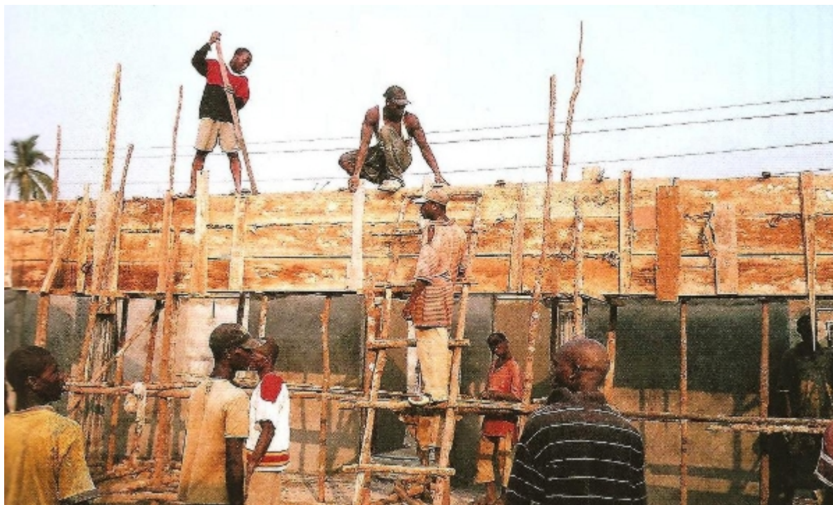
Κατασκευή του κτιρίου-γραφείου στο Ορθόδοξο Σχολείο Αγίου Ελευθερίου.

Τελειώνοντας την επίσκεψή μας αυτή φύγαμε από την χώρα φορτωμένοι με ανάμικτα συναισθήματα. Αυτά συνεχίζουν να μας συνοδεύουν και καθημερινά να μας κρίνουν· να μας υπενθυμίζουν, να μας δίνουν κουράγιο στην παραπέρα πορεία της διακονίας του ανθρώπου.