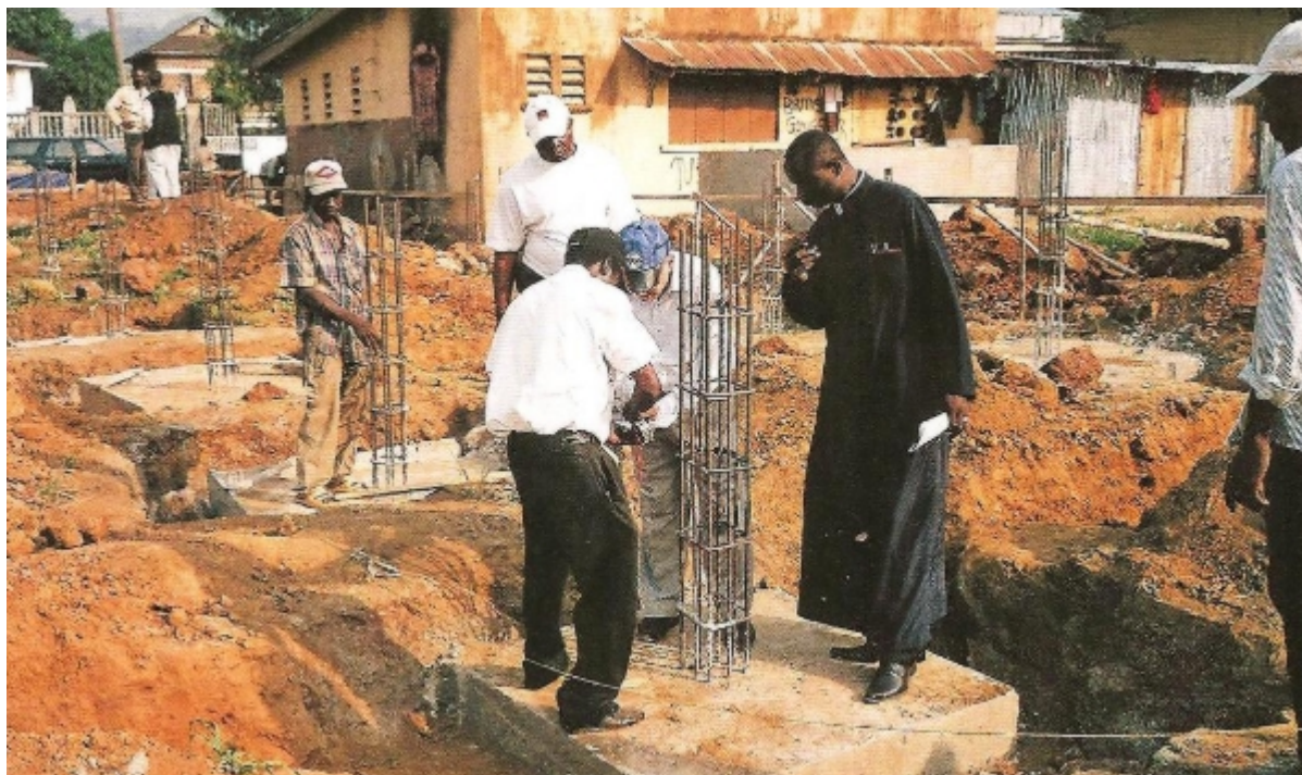
Τα θεμέλια του Ιερού Ναού Αγίου Ελευθερίου, δωρεά Αδελφότητας Ορθοδόξου Εξωτερικής Ιεραποστολής Θεσσαλονίκης.

Σε επίσημη γιορτή που διοργανώθηκε στις 15 Δεκεμβρίου του παρελθόντος έτους με την παρουσία υπουργών της κυβερνήσεως, του δημάρχου της πρωτεύουσας, όλων των μαθητών, δασκάλων και γονέων, μετά τον Αγιασμό θεμελιώσεως των παραπάνω έργων, διαβιβάσθηκε η απόφαση του δημάρχου, όπως παραχωρηθεί ο εν λόγω χώρος στο Ελληνορθόδοξο Πατριαρχείο Αλεξανδρείας και πάσης Αφρικής με σκοπό την ανάπτυξη των παραπάνω έργων και έγινε από τον Επίσκοπο η ονοματοδοσία του σχολείου.