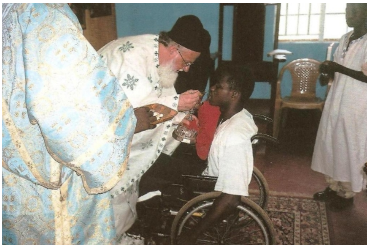
Μετάληψη κατά τη Θεία Λειτουργία στην πρόχειρη εκκλησία του Αγίου Ελευθερίου.

Καθηκόντως επισκεφθήκαμε τον πρόεδρο της χώρας κ. Έρνεστ Κορόμα, για να εκφράσουμε εκ μέρους του Μακαριωτάτου Πατριάρχου μας τις ευχαριστίες για την βοήθεια του στο έργο της Ορθοδόξου Εκκλησίας και την ευχή του, όπως έλθουν καλύτερες ημέρες για τον πολύπαθο λαό της χώρας που κυβερνά και αυτός με την σειρά του μας ευχαρίστησε για όλα όσα μέχρι τώρα προσφέρει το Πατριαρχείο μας και για όσα προγραμματίζουμε να προσφέρουμε στον λαό του διά του ιεραποστόλου Αρχιμανδρίτου π. Θεμιστοκλέους, τον οποίον ιδιαιτέρως εκτιμά, υποσχόμενος κάθε δυνατή εξυπηρέτηση στα επιτελούμενα έργα.