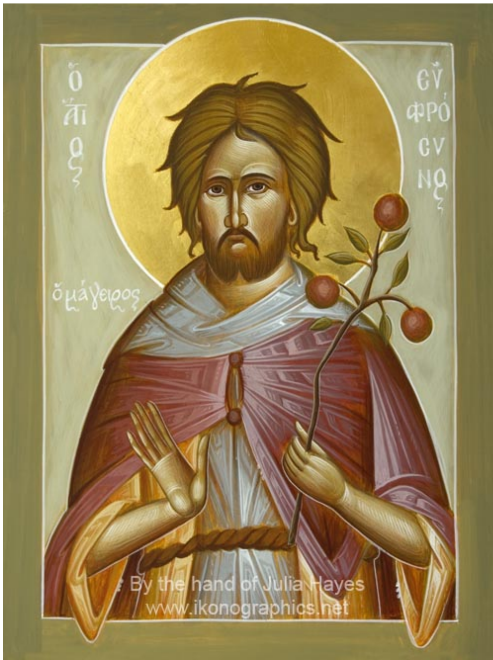
Άγιος Ευφρόσυνος ο μάγειρας - Julia Hayes© (www.ikonographics.net)