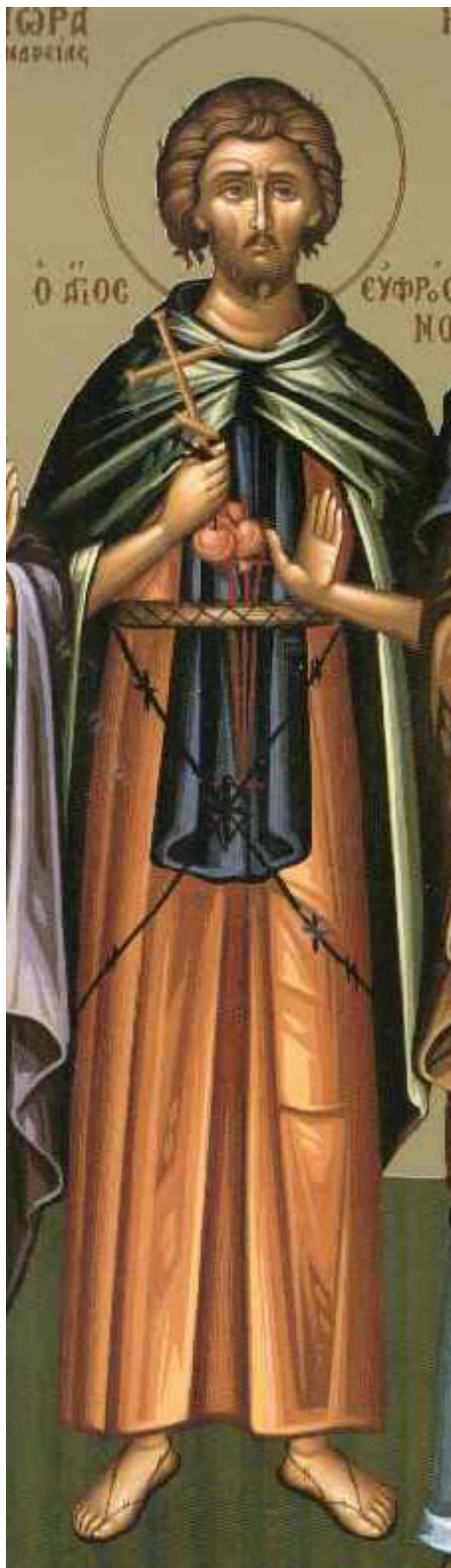
Άγιος Ευφρόσυνος ο μάγειρας