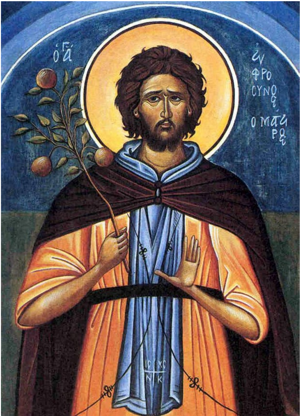
Άγιος Ευφρόσυνος ο μάγειρας