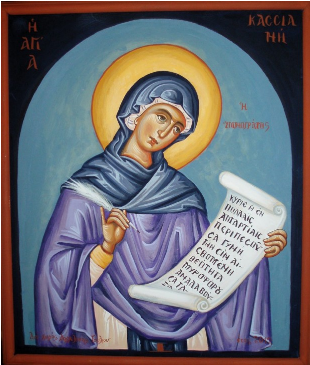
Οσία Κασσιανή - Αγγελική Τσέλιου© ( diaxeirosaggelikistseliou.blogspot.com )

Ορθοδοξία και Ορθοπραξία / Συναξαριακές Μορφές