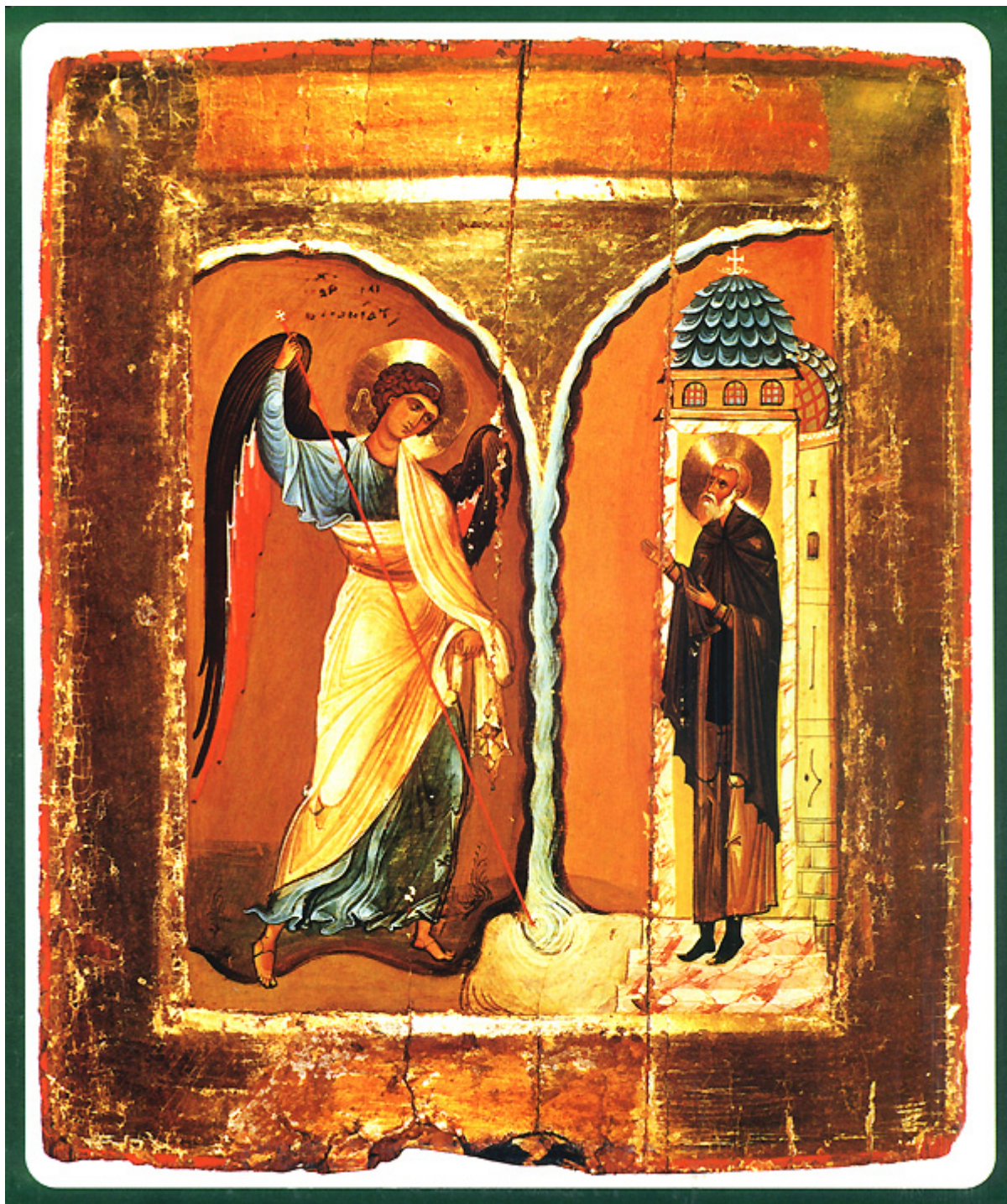
Το θαύμα του Αρχαγγέλου Μιχαήλ στις Χωναίς (ή Κολασσαίς)