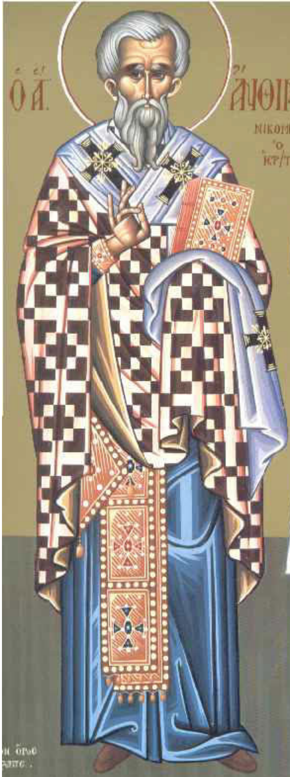
Άγιος Ανθιμος Ιερομάρτυρας επίσκοπος