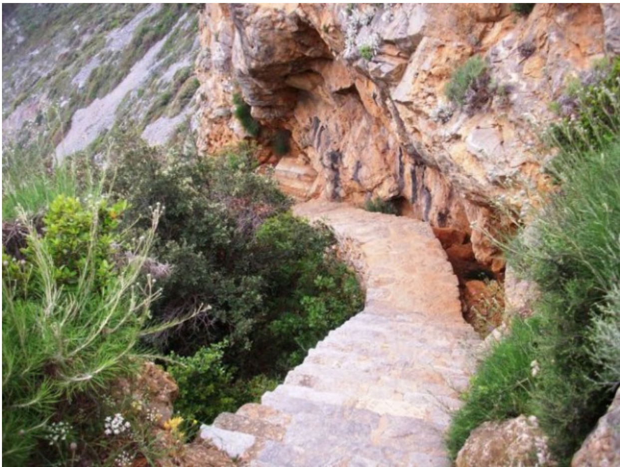
Η αρχή των σκαλοπατιών

Σημειωτέον ότι, έξω από την σπηλιά αυτήν, είναι κτισμένα ερημικά κελιά, εντός δε αυτής υπάρχουν κτισμένα δύο παρεκκλήσια αφιερωμένα το ένα στην Παναγία του “Ακάθιστου” και το άλλο στον “Όσιο Αθανάσιο.