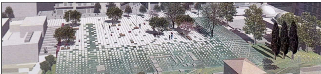
Πλατεία Αγ. Δημητρίου

αντιληπτός στον περαστικό από τις γύρω οδούς, και εσωτερικά δίνεται η αίσθηση ενός περικλειστού και προστατευμένου χώρου. Το αστικό αυτό «δωμάτιο» διαμορφώνεται ως ένας χώρος για την γειτονιά σε συνδυασμό με δραστηριότητες υπερτοπικού χαρακτήρα, που μπορούν ακόμα να προσελκύσουν επισκέπτες από άλλες περιοχές της πόλης. Σε αυτόν «τοποθετούνται» χώρος πρασίνου, χώροι καθιστικών, χώρος υπαίθριων προβολών, στεγασμένο δημοτικό αναψυκτήριο και βιβλιοθήκη, ενσωματώνοντας τα αρχαιολογικά ευρήματα στο σύνολο.