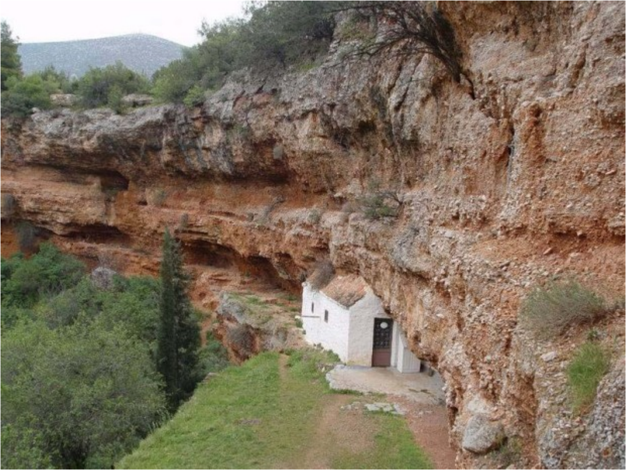
Άγιος Γεώργιος (δύο εκκλησάκια) στα Δίδυμα Αργολίδας