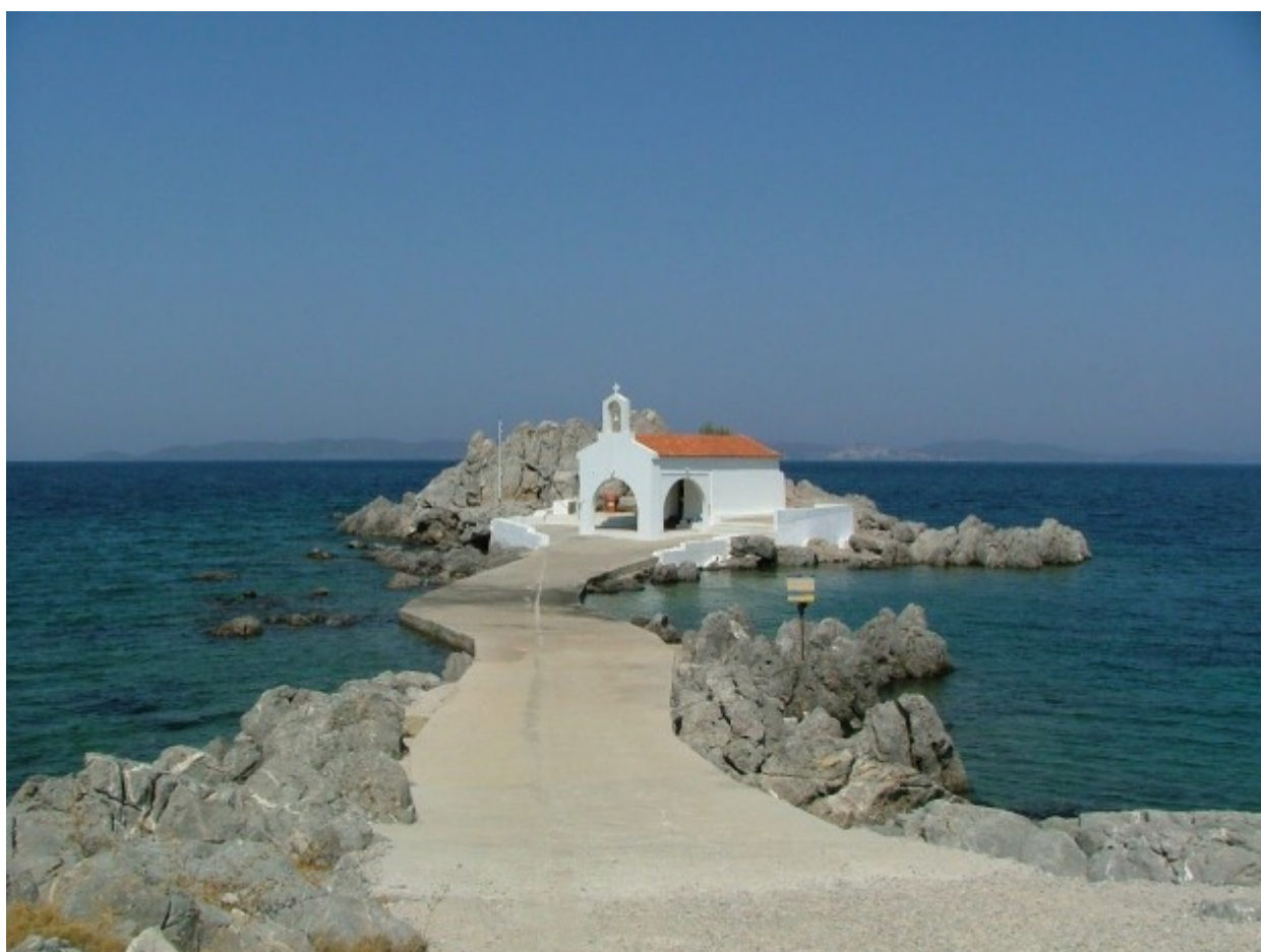
Ο Άγιος Ισίδωρος στο Παντουκιάς της Χίου