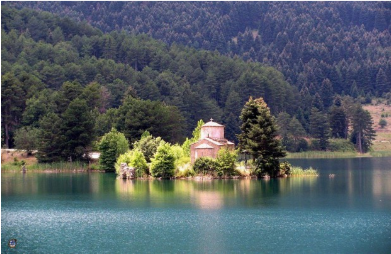
Ο Άγιος Φανούριος στη λίμνη Δόξα

Εκκλησιές παντού, διάσπαρτες. Μικρά διαμάντια αγάπης και ομορφιάς.