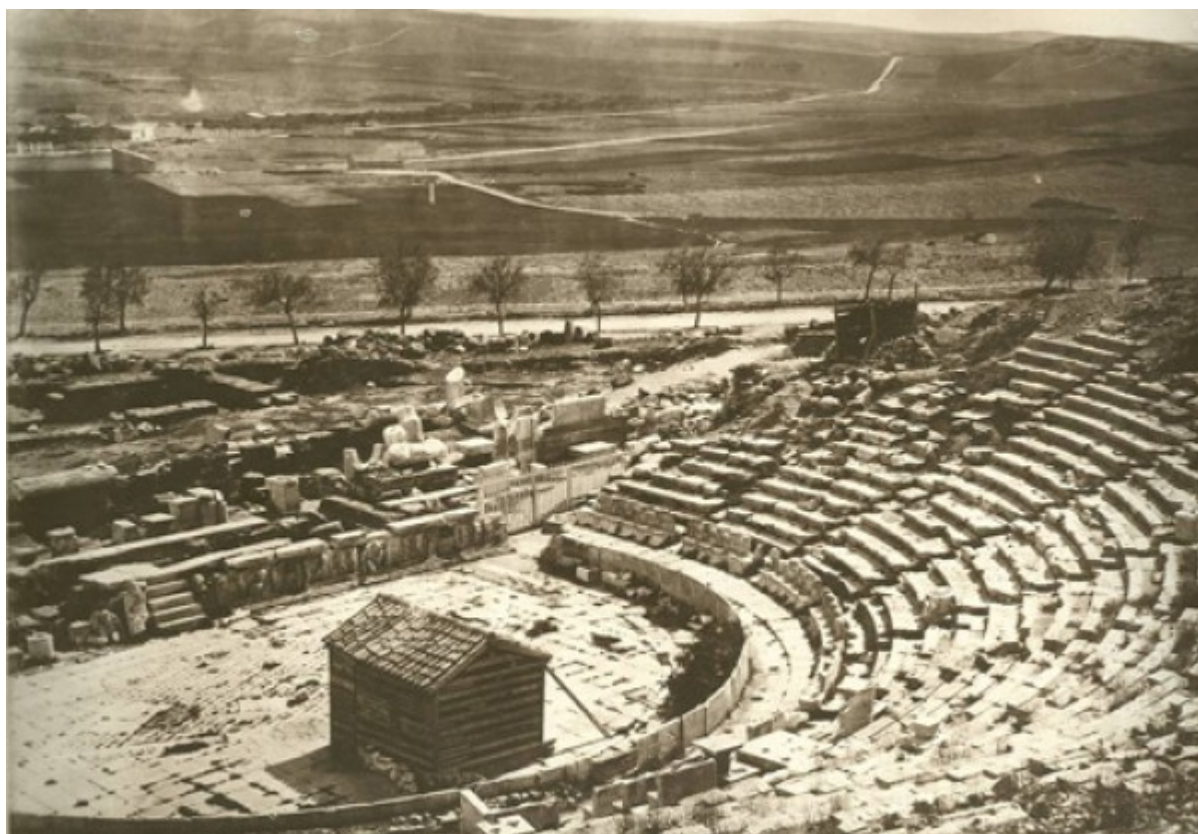
Το θέατρο του Διονύσου στους πρόποδες της Ακρόπολης