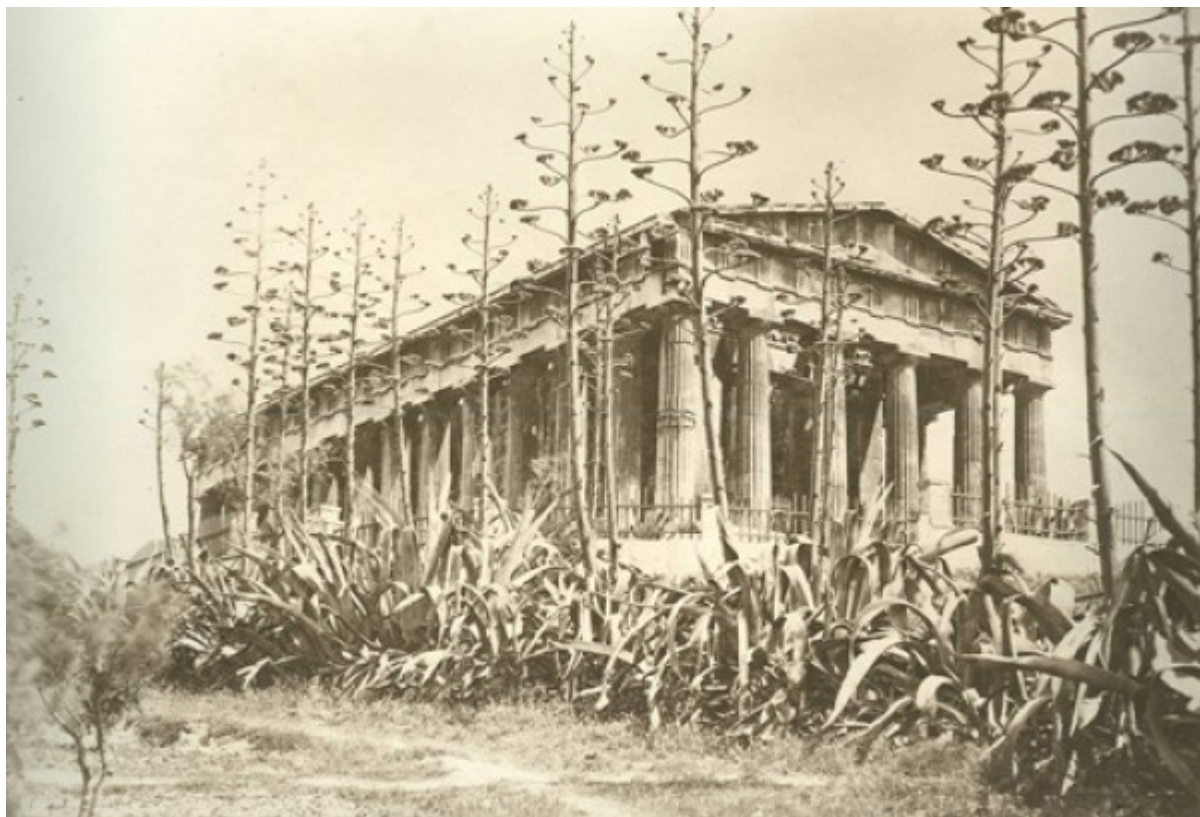
Το Θησείο