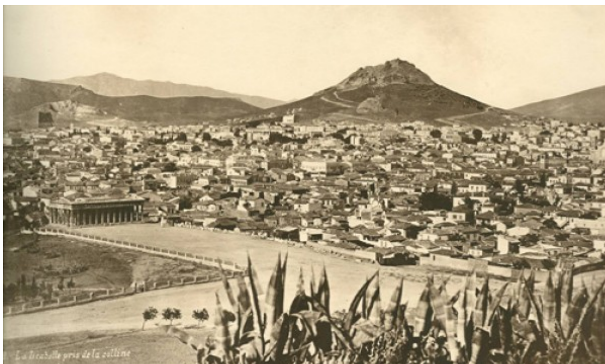
Ο Λυκαβηττός και το Θησείο, όπως φαινόταν από το λόφο των Νυμφών - ΦΩΤΟ Σύλλογος των Αθηναίων