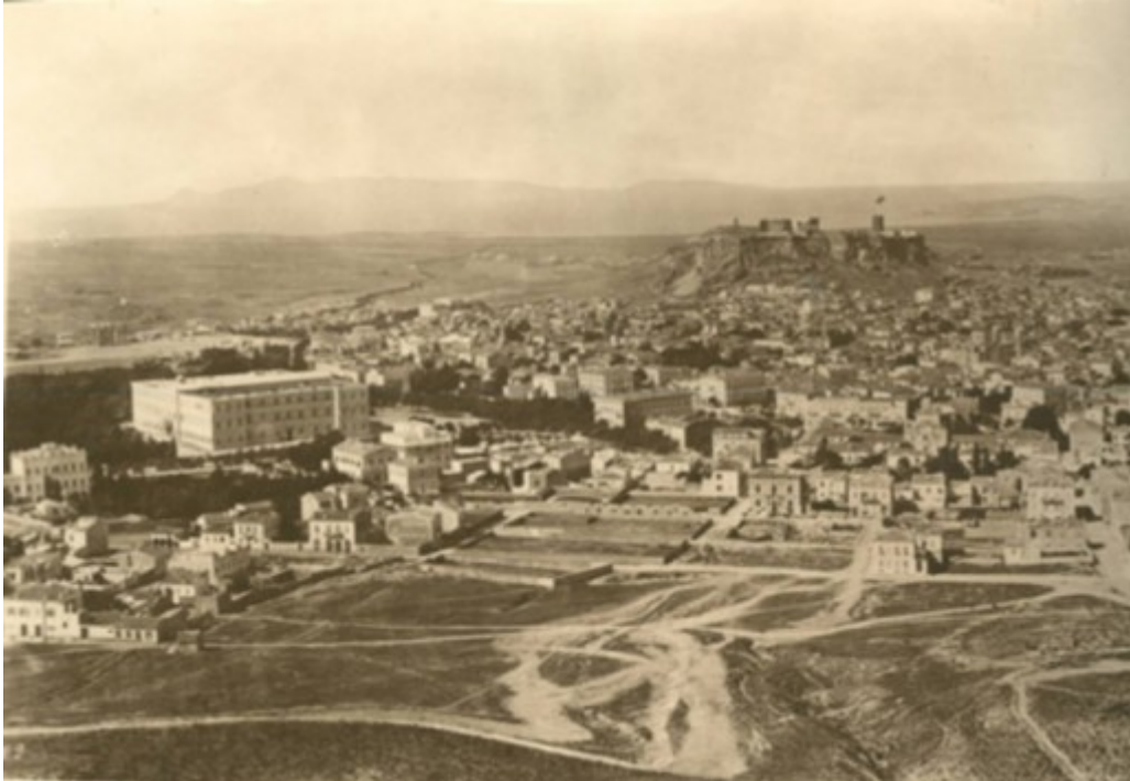
Το παλάτι (σημερινή Βουλή των Ελλήνων) και η Ακρόπολη - Διακρίνεται στην Ακρόπολη ο πύργος του Σερπεντζέ

Οι φωτογραφίες της Αθήνας του 1880 δείχνουν πως ήταν η πρωτεύουσα έως τις αρχές του 20ου αιώνα. Τότε που η σημερινή Βουλή ήταν παλάτι.