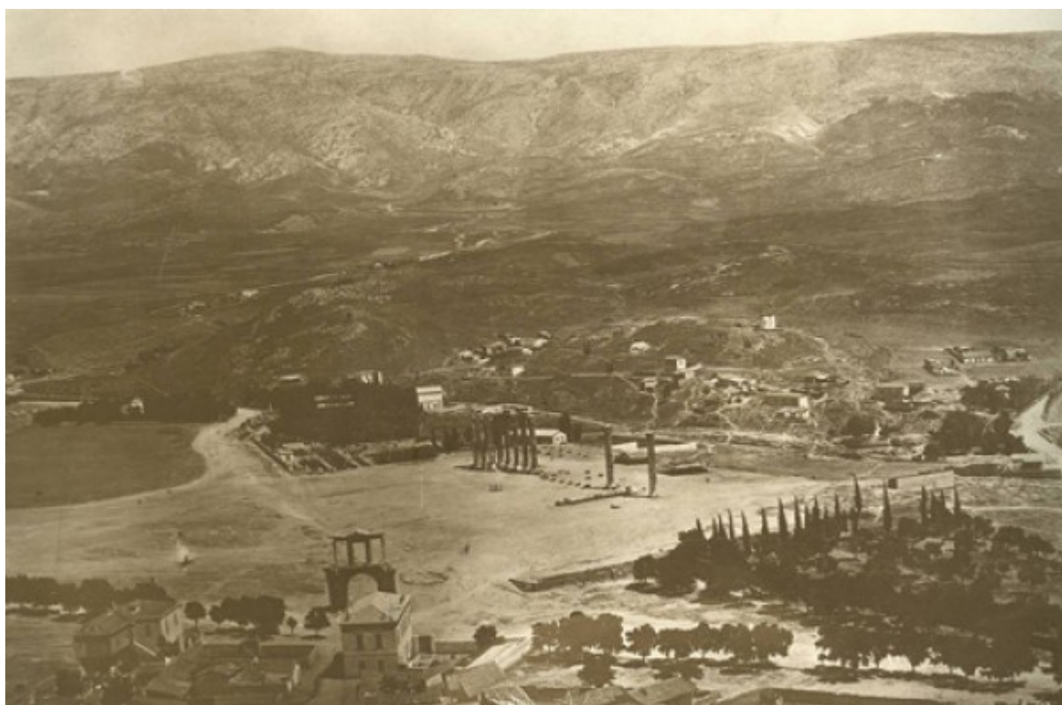
Οι στύλοι του Ολυμπίου Διός και η πύλη του Αδριανού, όπως φαινόταν από την Ακρόπολη