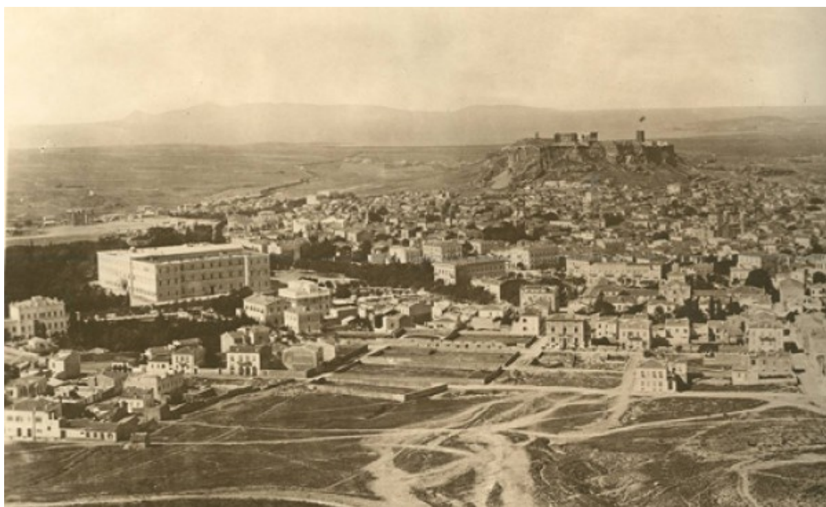
Το παλάτι (σημερινή Βουλή των Ελλήνων) και η Ακρόπολη. Διακρίνεται στην Ακρόπολη ο πύργος του Σερπεντζέ