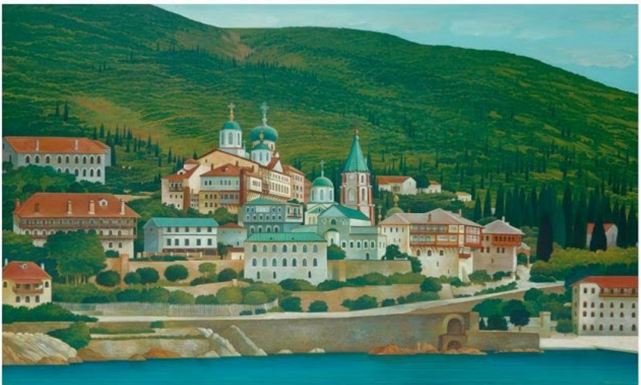
Θανάσης Μπακογιώργος - 1.Μ. Αγίου Παντελεήμονος, ΑΓΙΟΝ ΟΡΟΣ