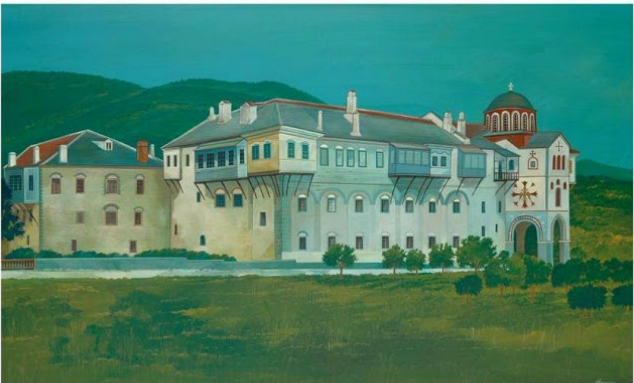
Θανάσης Μπακογιώργος - 1.Μ. Φιλοθέου, ΑΓΙΟΝ ΟΡΟΣ