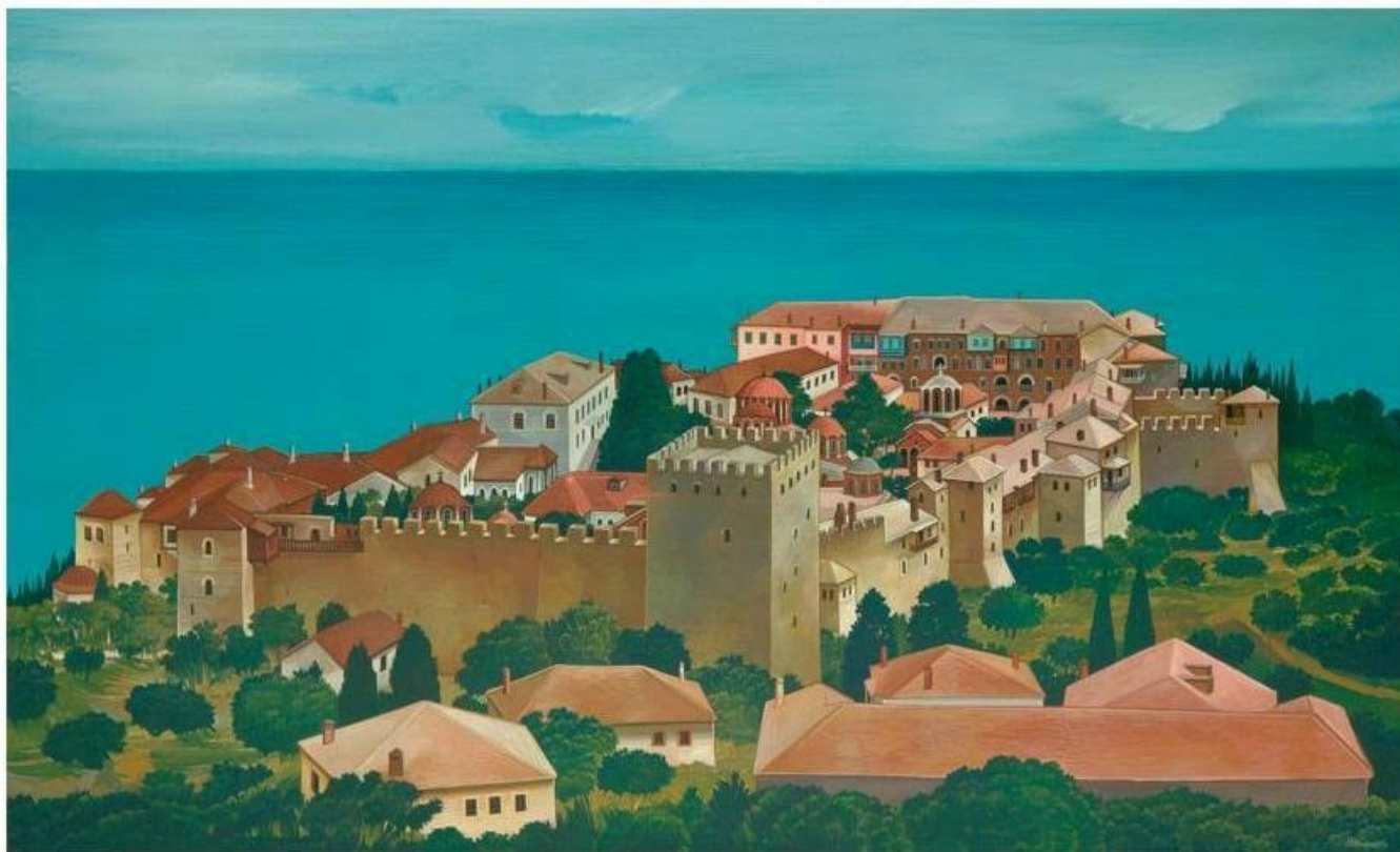
Θανάσης Μπακογιώργος - 1.Μ. Μεγίστης Λαύρας, ΑΓΙΟΝ ΟΡΟΣ