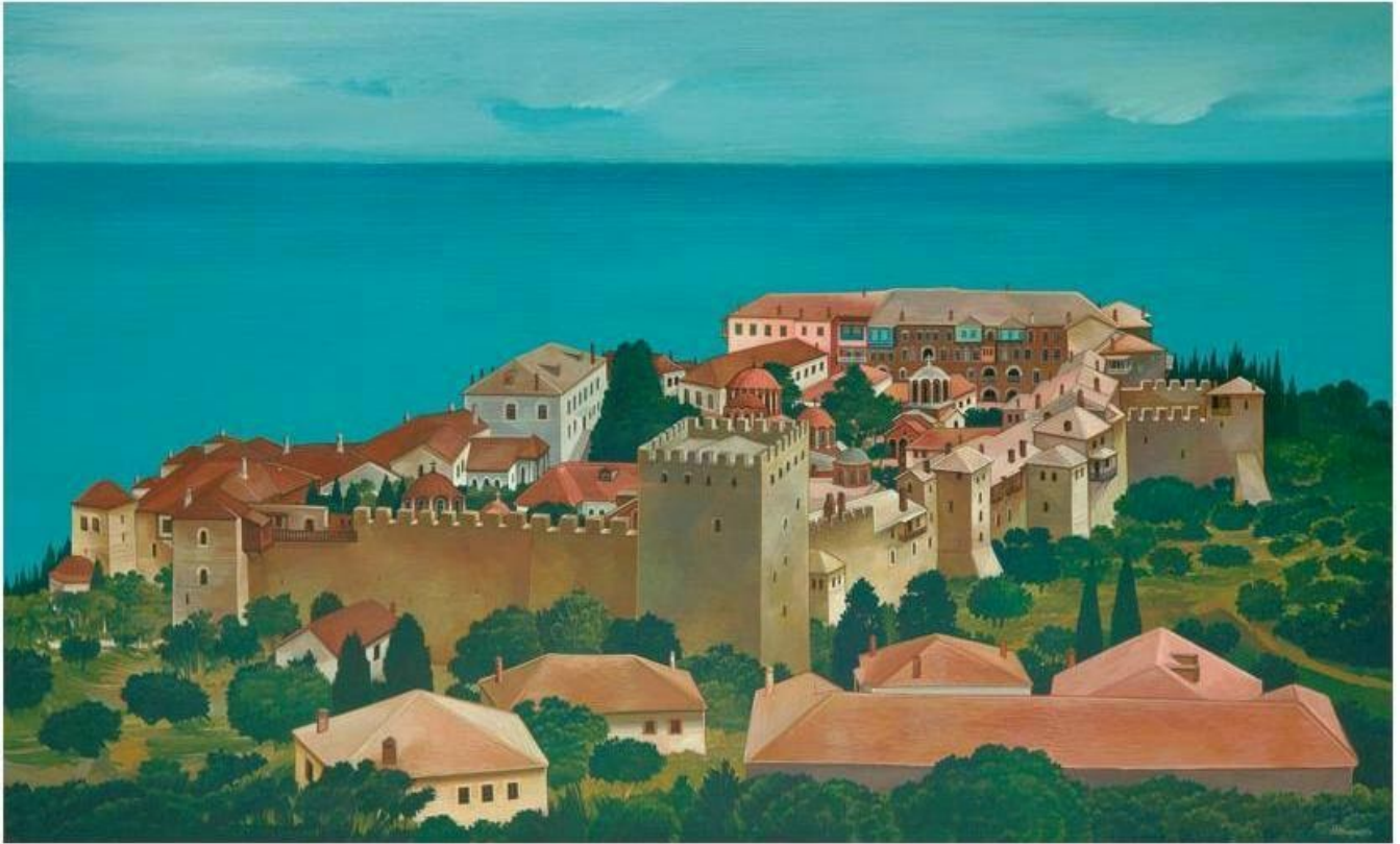
Θανάσης Μπακογιώργος - 1.Μ. Μεγίστης Λαύρας, ΑΓΙΟΝ ΟΡΟΣ

Ορθοδοξία και Ορθοπραξία / Άγιον Όρος / Ειδήσεις και Ανακοινώσεις / Ορθόδοξη πίστη / Προσκυνήματα-Οδοιπορικά-Τουρισμός