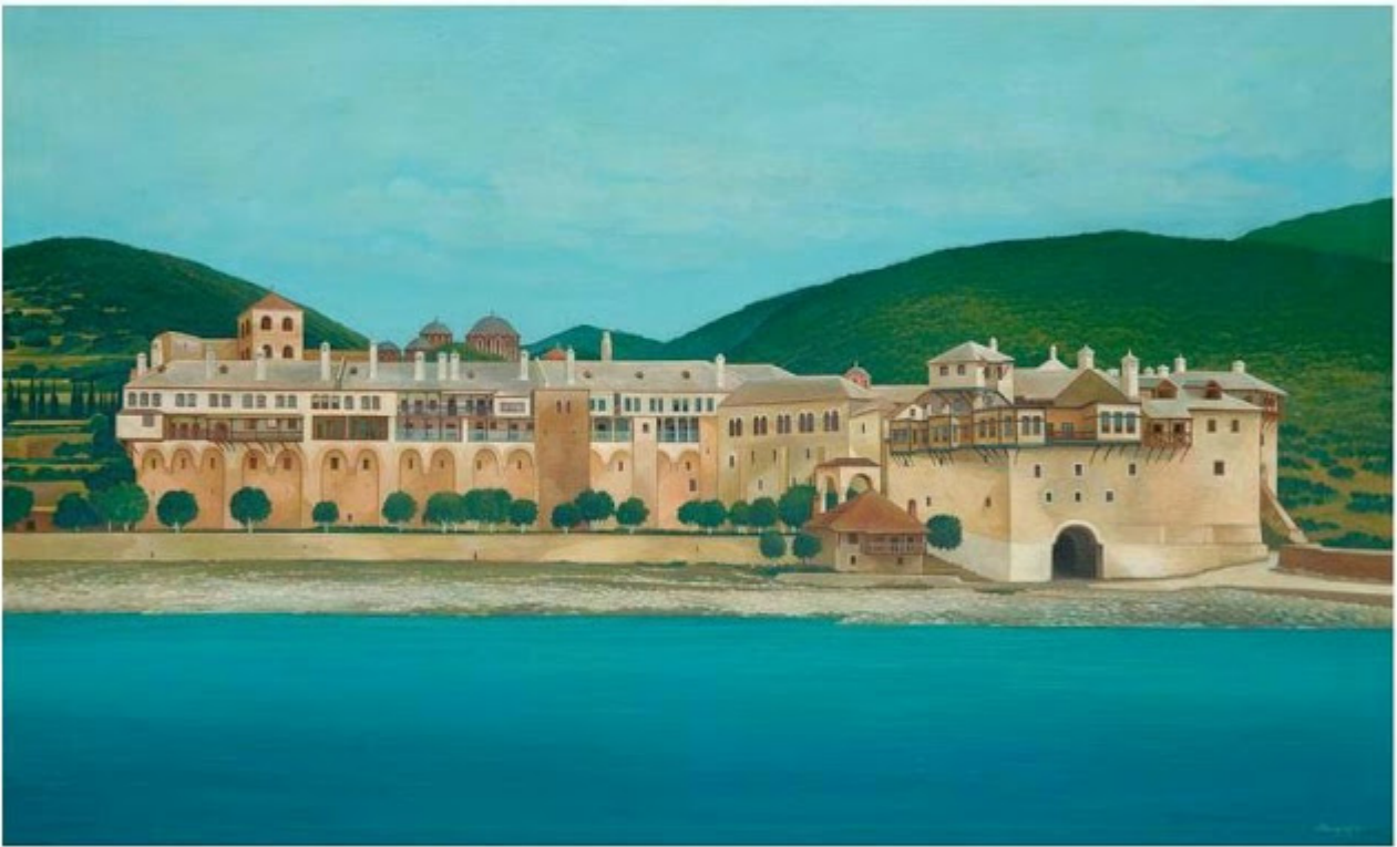
Θανάσης Μπακογιώργος - 1.Μ. Ξενοφώντος, ΑΓΙΟΝ ΟΡΟΣ