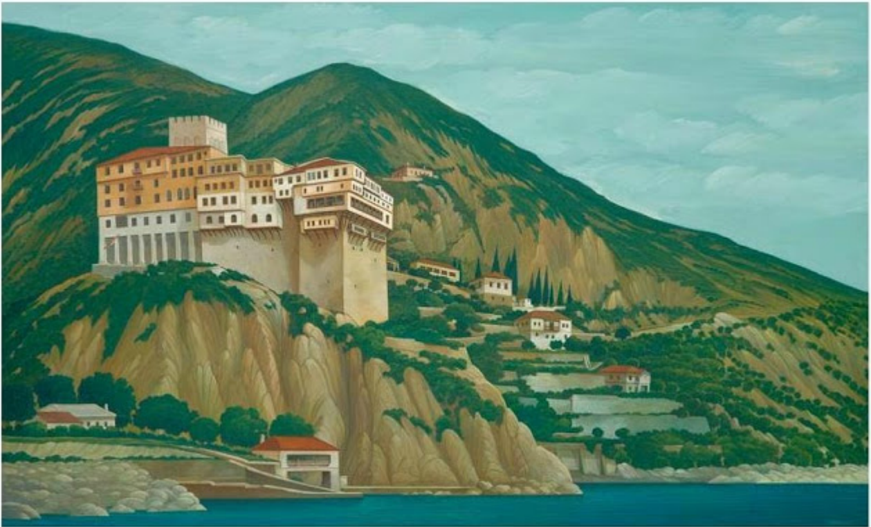
Θανάσης Μπακογιώργος - 1.Μ. Διονυσίου, ΑΓΙΟΝ ΟΡΟΣ