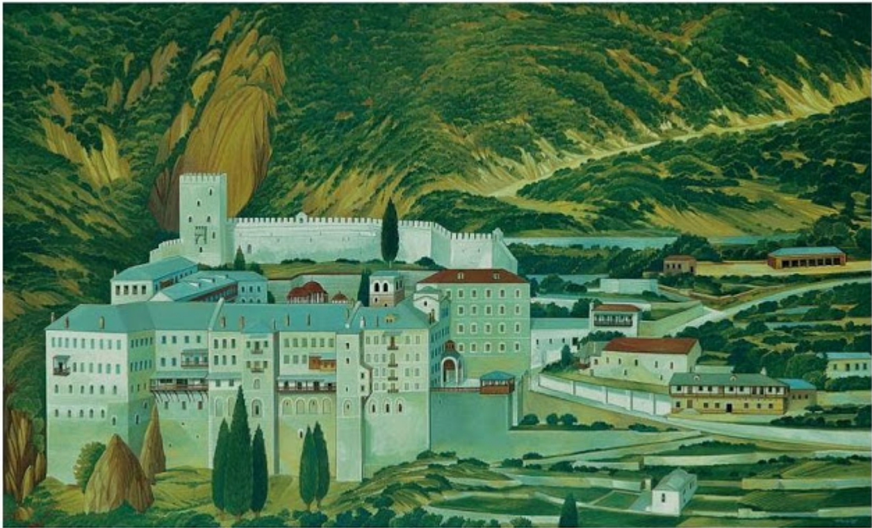
Θανάσης Μπακογιώργος - 1.Μ. Αγίου Παύλου, ΑΓΙΟΝ ΟΡΟΣ