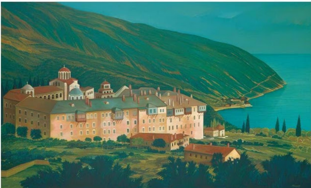
Θανάσης Μπακογιώργος - 1.Μ. Ξηροποτάμου, ΑΓΙΟΝ ΟΡΟΣ