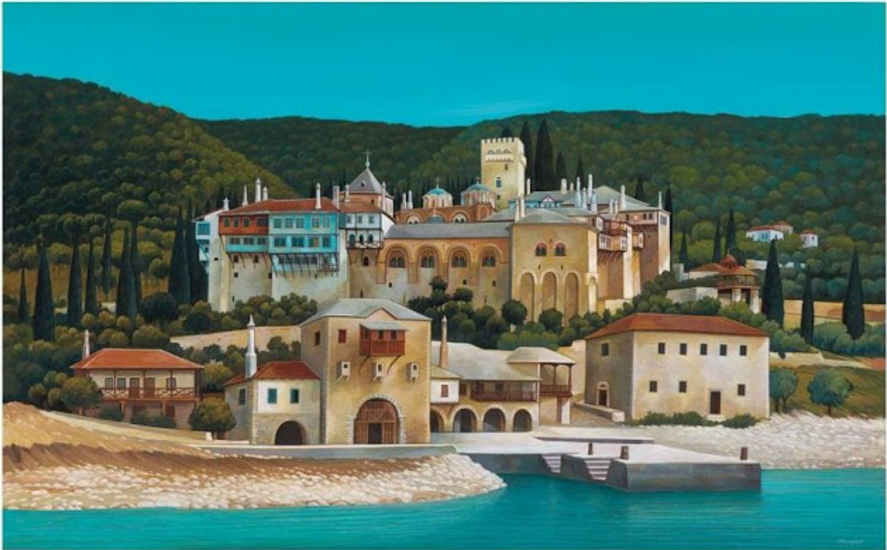
1. Μονή Δοχειαρίου, Άγιον Όρος. 80x120 εκ. άκρυλικό