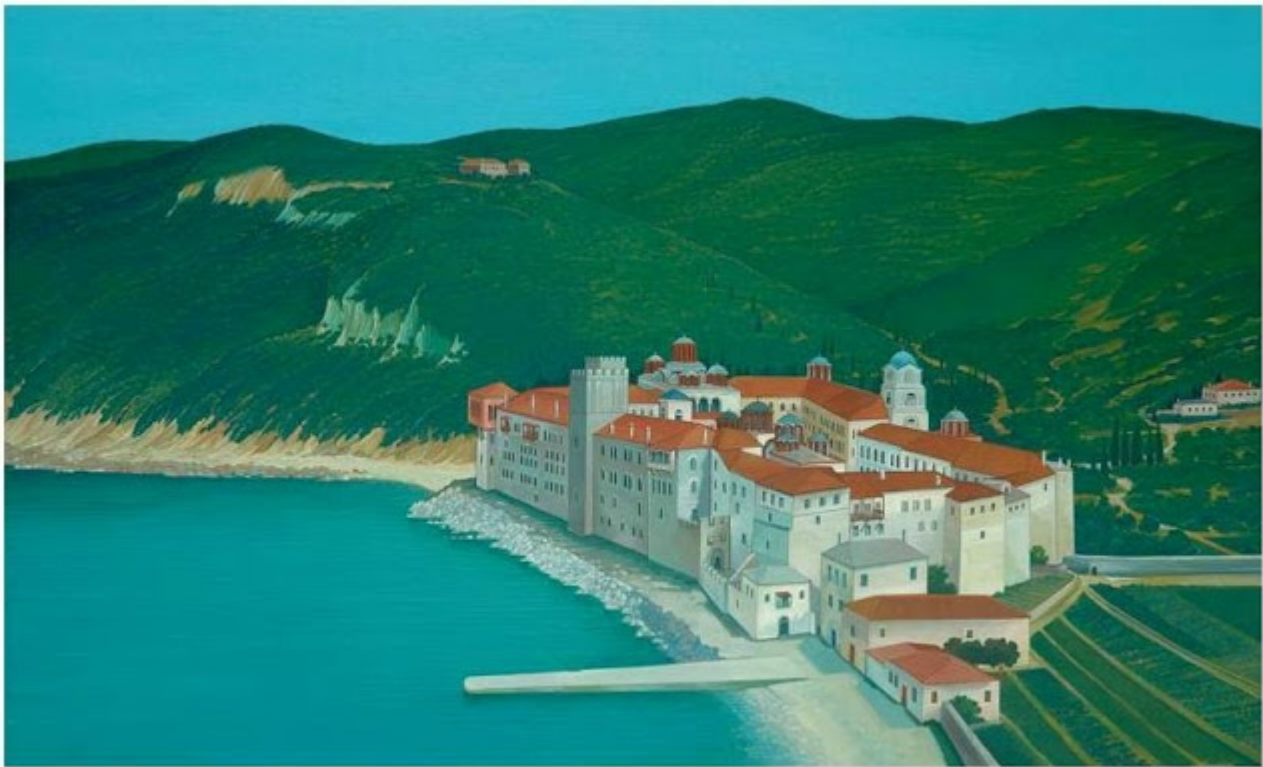
Θανάσης Μπακογιώργος - 1.Μ. Εσφηγμένου, ΑΓΙΟΝ ΟΡΟΣ