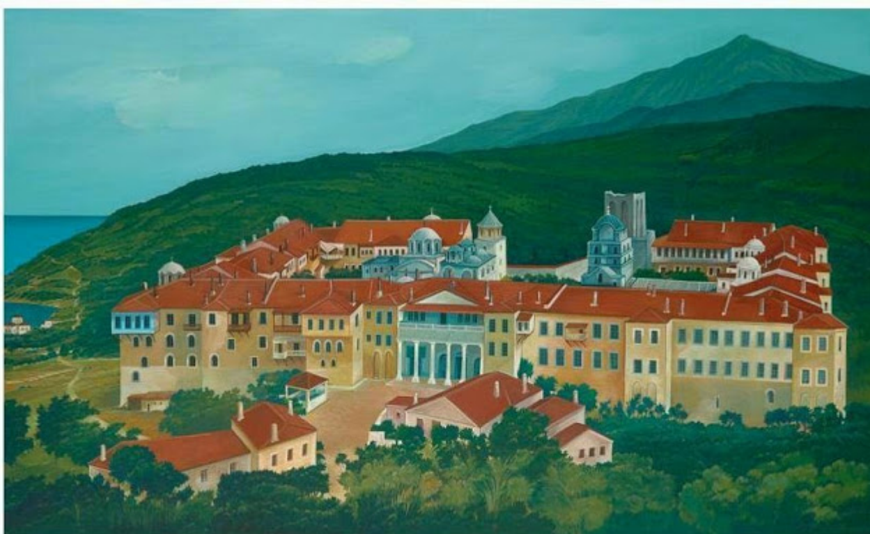
Θανάσης Μπακογιώργος - 1.Μ. Τβήρων, ΑΓΙΟΝ ΟΡΟΣ