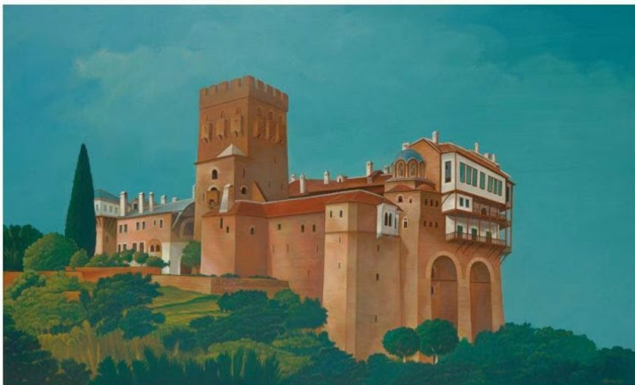
Θανάσης Μπακογιώργος - 1.Μ. Σταυρονικήτα, ΑΓΙΟΝ ΟΡΟΣ