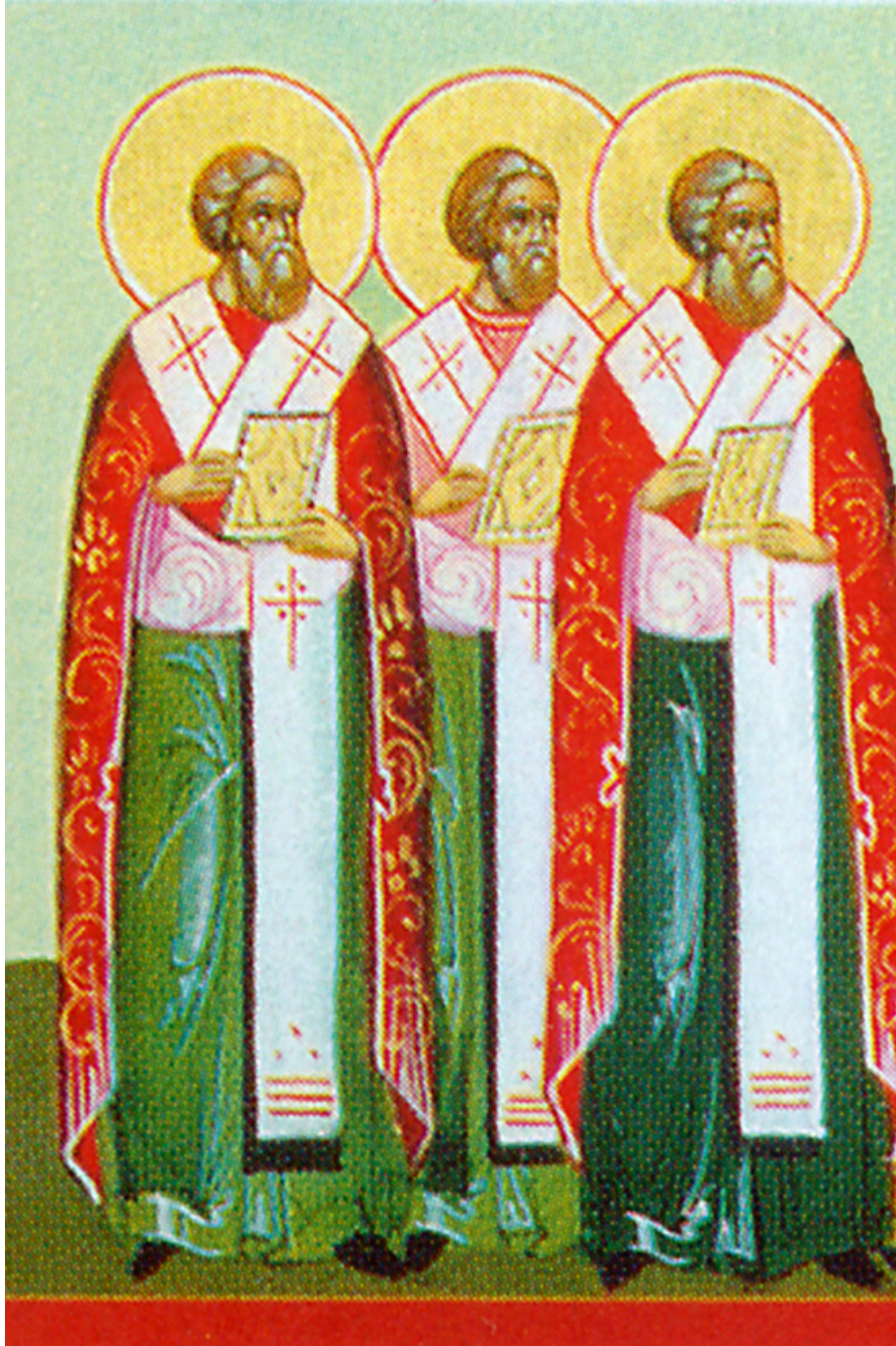
Ἅγιοι Ἀλέξανδρος, Ἰωάννης καὶ Παῦλος ὁ νέος, Πατριάρχες Κωνσταντινούπολης