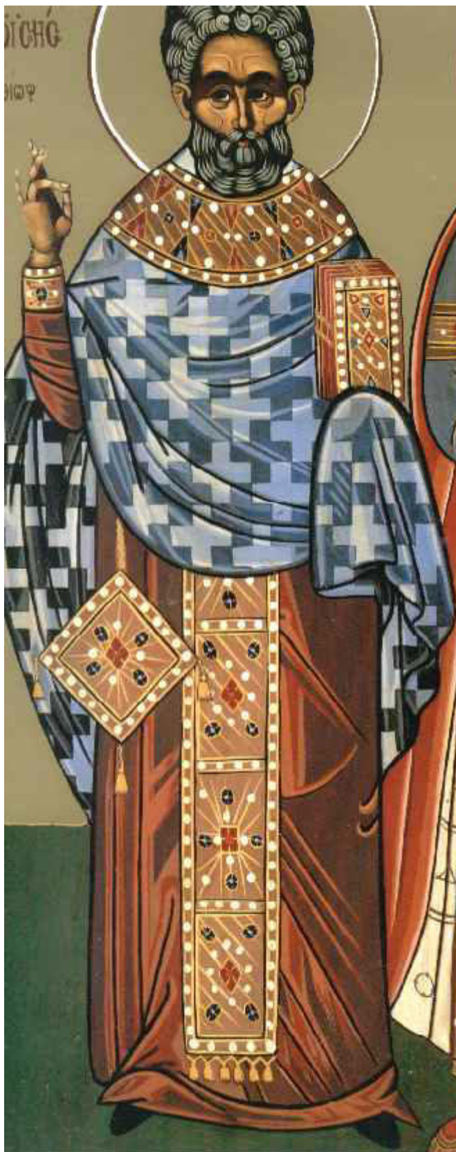
Όσιος Μωσής ο Αιθίοπας