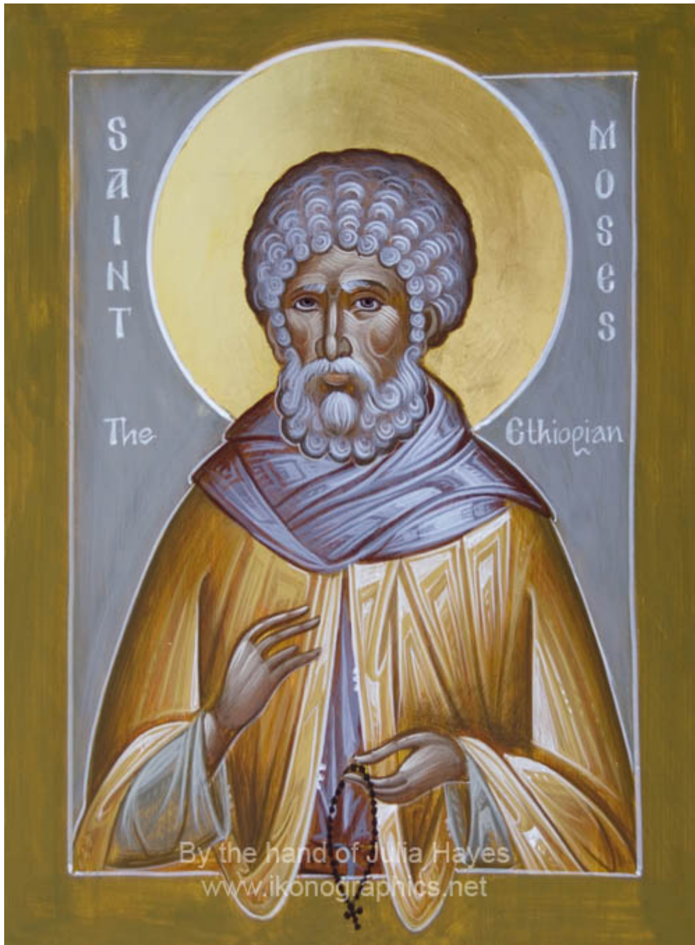
Όσιος Μωυσής ο Αιθίοπας - Julia Hayes© ( www.ikonographics.net )