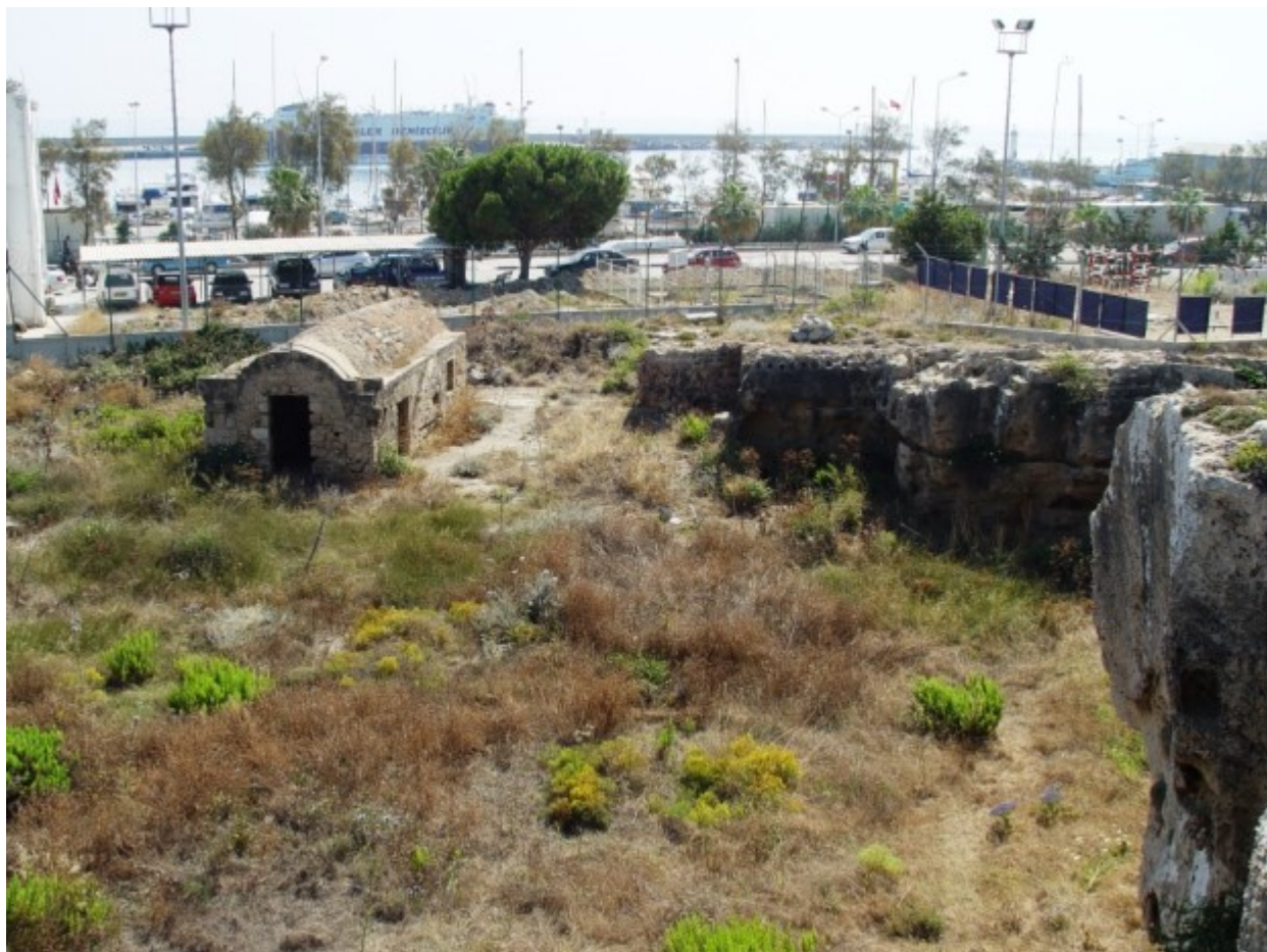
Ο ναός της Αγίας Αικατερίνης