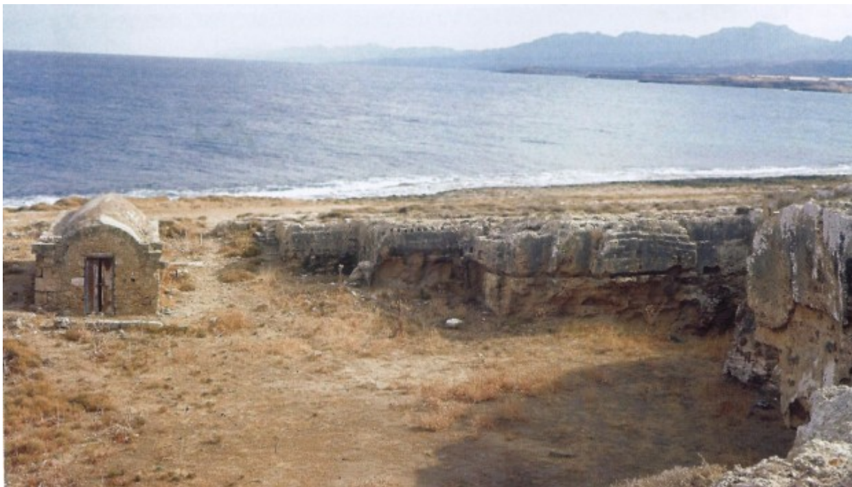
Το παλαιοχριστιανικό κοιμητήριο

Η παραθαλάσσια περιοχή της Χρυσοκάβας βρίσκεται περίπου 1 χλμ ανατολικά του κάστρου της Κερύνειας δίπλα από το νέο λιμάνι της πόλης. Το τοπίο της περιοχής χαρακτηρίζεται από την εκτεταμένη παρουσία όγκων πωρόλιθου, γι' αυτό από τα αρχαία χρόνια ο χώρος χρησιμοποιήθηκε ως λατομείο, με αποτέλεσμα να υποστεί πολλές αλλοιώσεις. Παρά το γεγονός ότι στην περιοχή δεν έγιναν πριν το 1974 οποιεσδήποτε αρχαιολογικές ανασκαφές, από τις σύντομες μελέτες, επισκοπήσεις και φωτογραφικό υλικό των George Jeffery και Γεώργιου Σωτηρίου, προκύπτει ότι ο χώρος έχει σημαντικό αρχαιολογικό ενδιαφέρον.