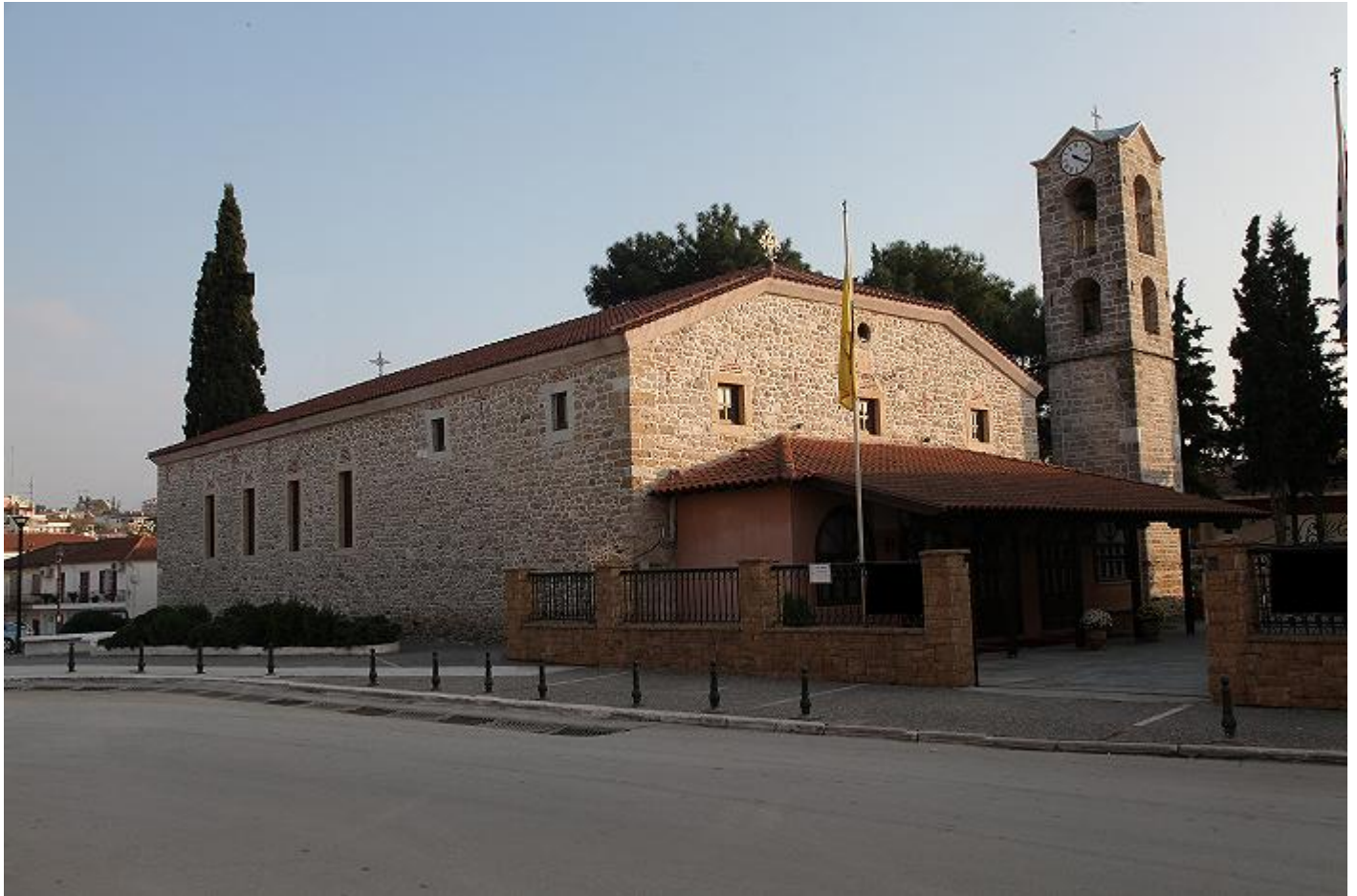
Ιερός Ναός Κοιμήσεως της Θεοτόκου Επανωμής 1865

Ο Πρόεδρος και τα μέλη του Εκκλησιαστικού Συμβουλίου του Ιερού Ναού Κοιμήσεως της Θεοτόκου Επανωμής, σας προσκαλούν να συμμετέχετε στην υποδοχή του αντιγράφου της θαυματουργού ιεράς εικόνας «Παναγία η Γιάτρισσα», από την Ιερά Πατριαρχική και Σταυροπηγιακή Μονή Κουτλουμουσίου Αγίου Όρους, την Τετάρτη 31 Ιουλίου 2013 και ώρα 7 μ. μ. στην είσοδο της πόλεως.