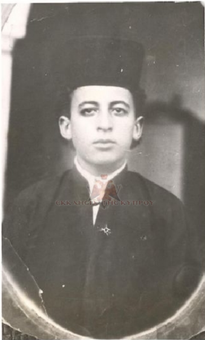
Δόκιμος εις 'Ι.Μονήν Κύκκου. ( 5.10.1926 )