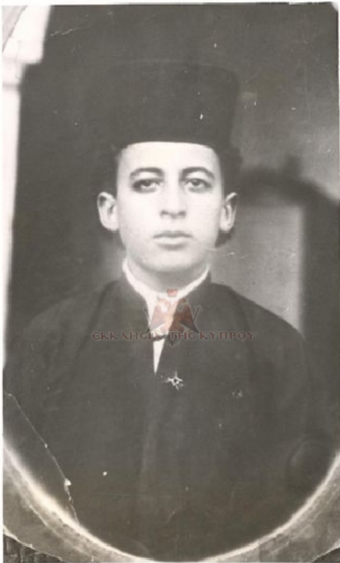
Δόκιμος εις 'Ι.Μονήν Κύκκου. ( 5.10.1926 )