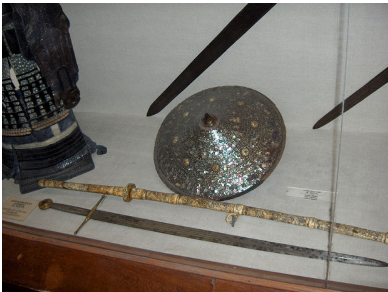
Το σπαθί του Αγίου Στεφάνου του Μέγα όπου βρίσκεται στο Τοπ-Καπί

Ο Άγιος Στεφάνος ο Μέγας ,ο βοεβόδας είχε συνήθεια μετά από κάθε μάχη να χτίζει μοναστήρια και εκκλησίες, ο αριθμός των οποίων ανέρχεται σε πέραν των σαράντα.