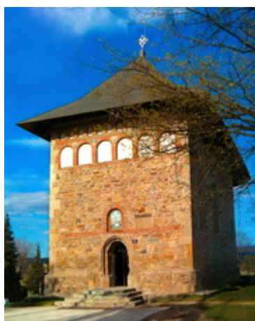
Ι.Ν.Κοιμήσεως της Θεοτόκου Μπορζέστι Χτίστηκε μεταξύ 9 Ιουλίου-12 Οκτωβρίου 1494

Image not found or type unknown Ι.Ν.Αγίου Γεωργίου -Χαρλέου Χτίστηκε μεταξύ 30 Μαΐου-28 Οκτωβρίου