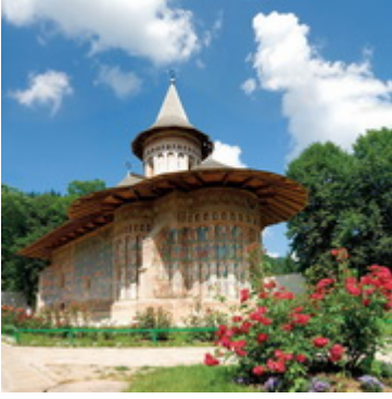
Μονή Βορονέτζς-Εορτάζει στις 23 Απριλίου Χτίστηκε μεταξύ 26 Μαΐου-14 Σεπτεμβρίου 1488