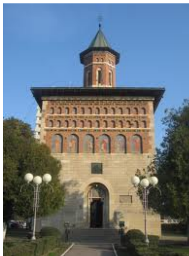
Ι.Ν.Αγίου Νικολάου-Ιάσιο Χτίστηκε μεταξύ Ιουνίου 1491- 10 Αυγούστου 1492