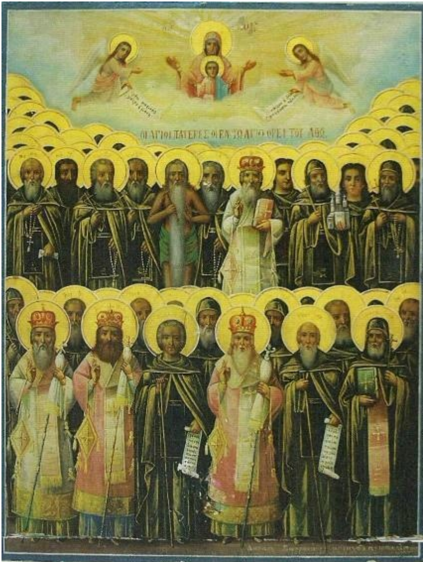
Οι Άγιοι Πατέρες οι εν τω Αγίω Όρει του Άθω Φορητή εικόνα Ιεράς Μονής Αγίου Παύλου (αρχές 20ου αι.)