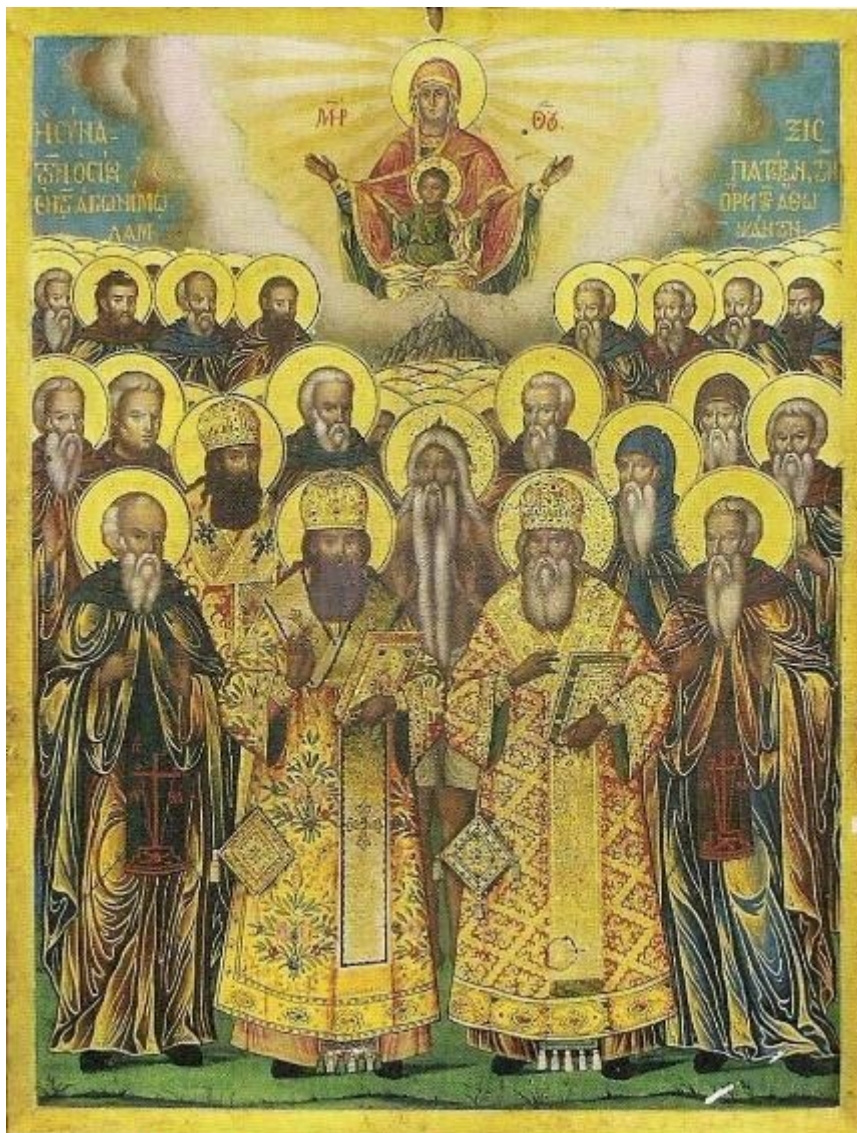
Η Σύναξη των Οσίων Αγιορειτών Πατέρων Φορητή εικόνα Ιεράς Μονής Γρηγορίου (1841)