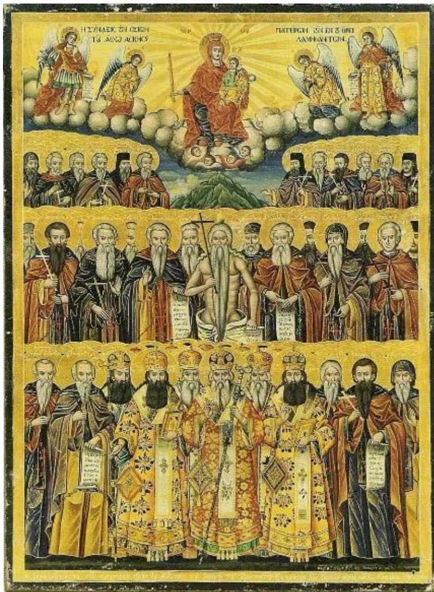
Η Σύναξη των Αγιορειτων Πατέρων Φορητή εικόνα Ιεράς Κοινότητας Αγίου Όρους (1849)