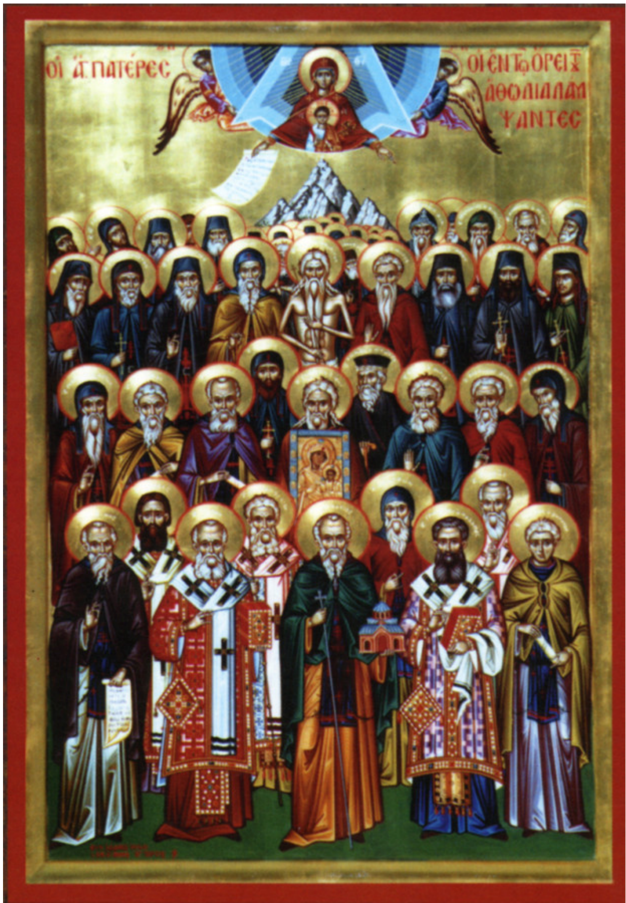
Σύναξη των Αγιορειτών Πατέρων