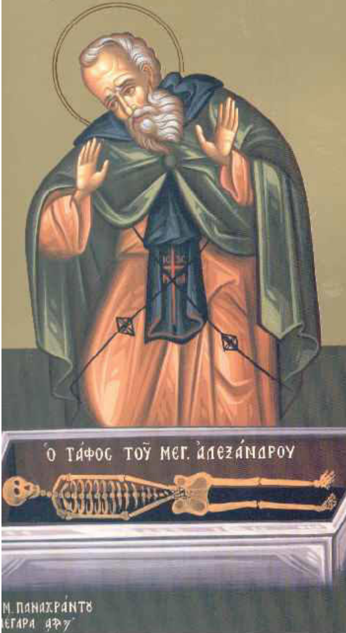
Όσιος Σισιώης ο μεγάλος