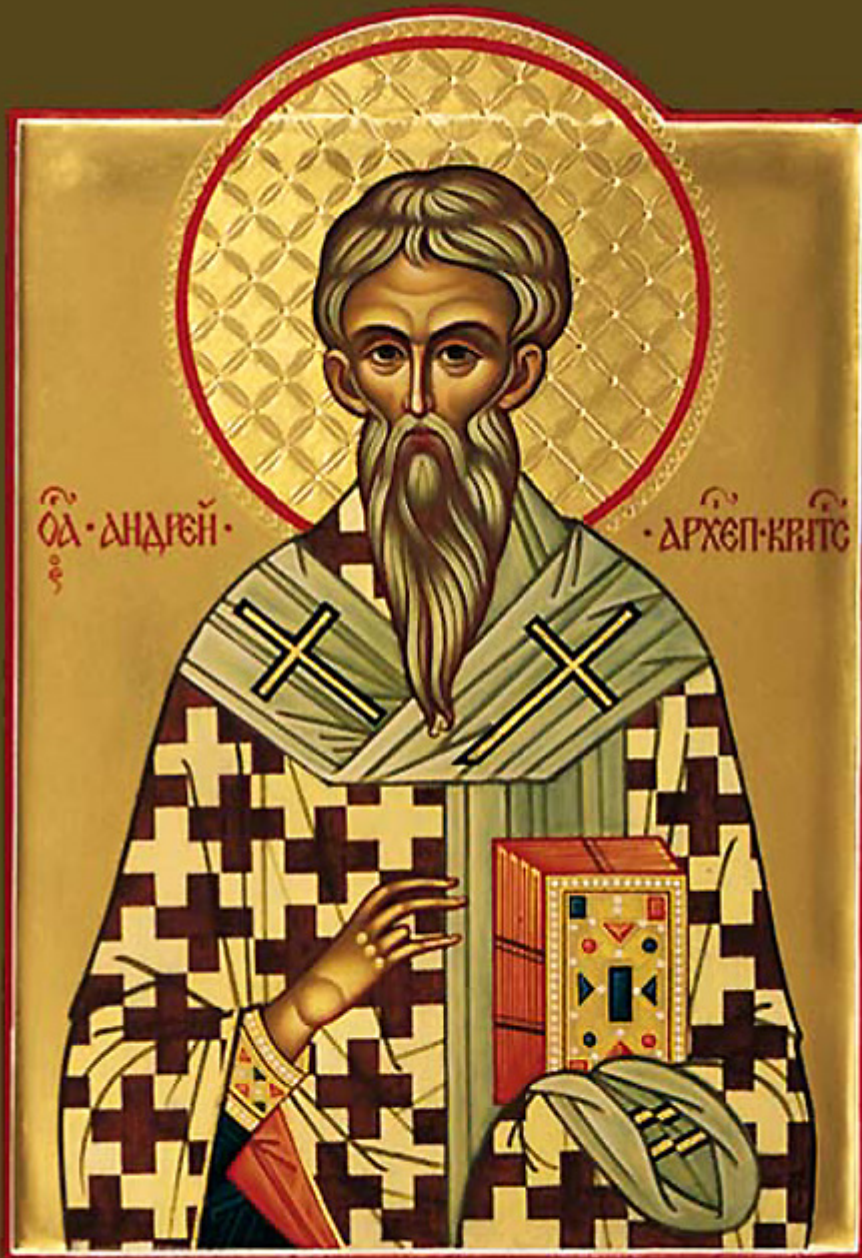
Άγιος Ανδρέας ο Ιεροσολυμίτης Αρχιεπίσκοπος Κρήτης