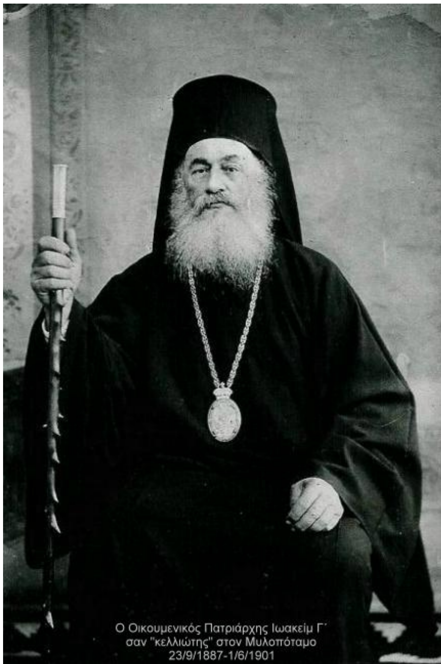
Ο Οικουμενικός Πατριάρχης Ιωακείμ Γ΄ σαν "κελλιώτης" στον Μυλοπόταμο 23/9/1887-1/6/1901