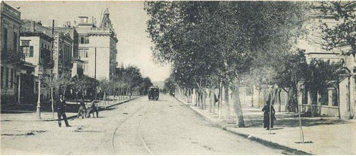
Βασιλίσσης Σοφίας & Ηροδότου