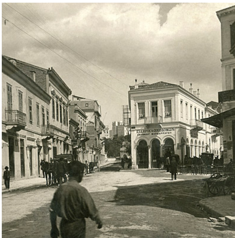
Ευριπίδου & Πραξιτέλους

Η καθησυχαστική αίσθηση χρονικής συνέχειας που αναδίδουν αυτές οι φωτογραφίες, η αυτόματη σκέψη ότι σε αυτούς τους δρόμους περπατάμε καθημερινά κι εμείς, ακόμα και η στιγμιαία εντύπωση ότι είμαστε κομμάτι της Ιστορίας αυτής της πόλης, είναι που μας κάνουν να χαμογελάμε στην οθόνη κάθε φορά που εμφανίζεται μια ασπρόμαυρη ή σέπια φωτογραφία της παλιάς Αθήνας.