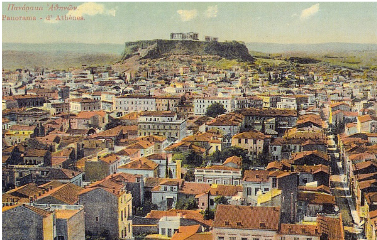
Πανόραμα της πόλης