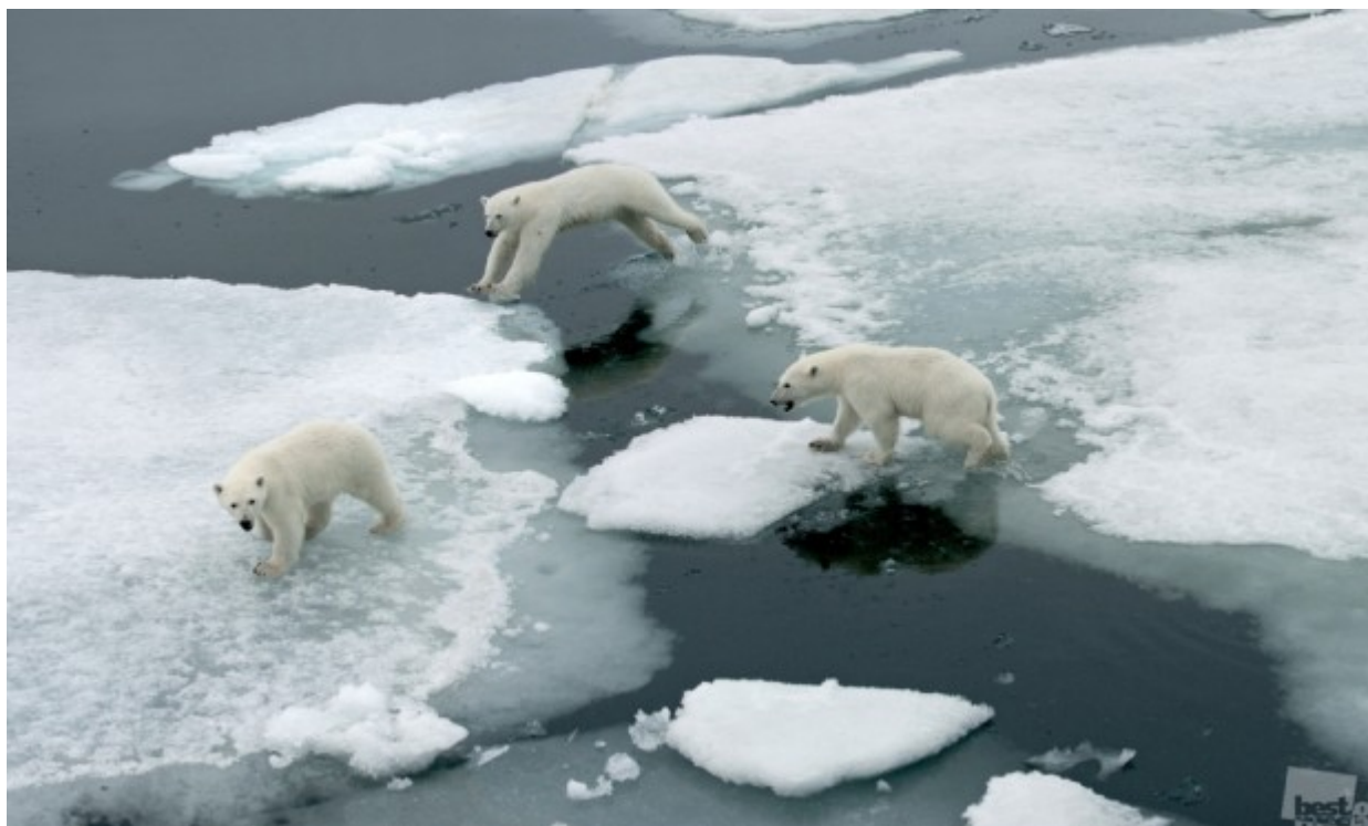
Ωστόσο, μπορεί να είναι χαρούμενη. // Αρκούδες, Γη του Franz Josef