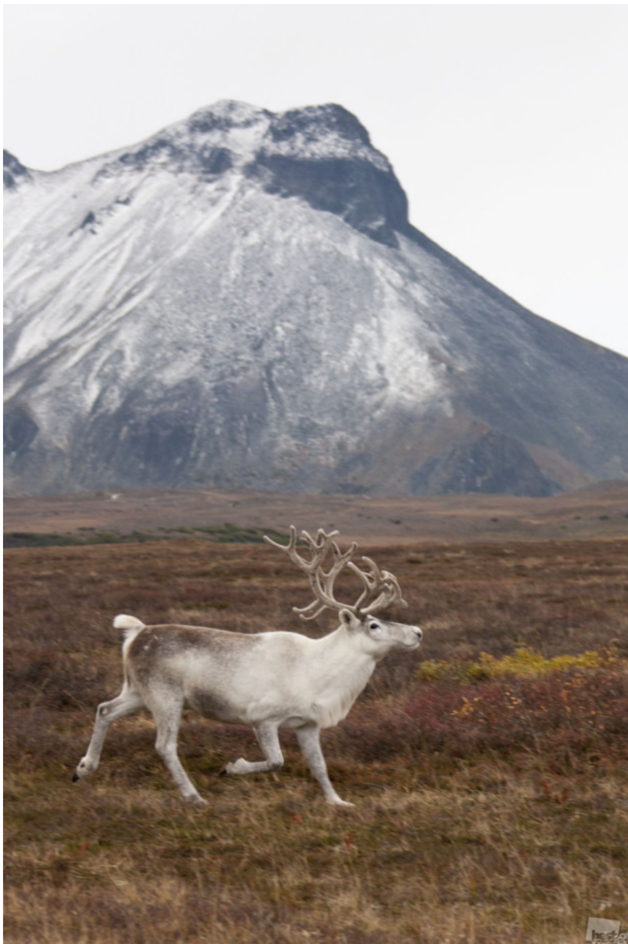
Μπορείς να σε αφήσει να ζήσεις μόνος // Βόρεια ελάφια στην παρυφές του οικισμού Έσο, Καμτσάτκα.