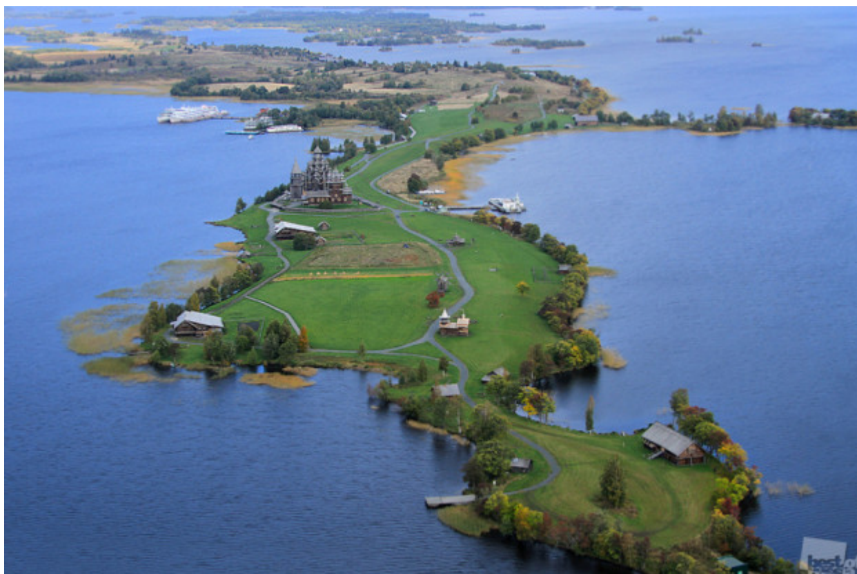
Μπορεί να είναι μια χαμένη γη στο κέντρο του άπειρου υγρού χώρου // Κίζι, Πετροζαβόντσκ