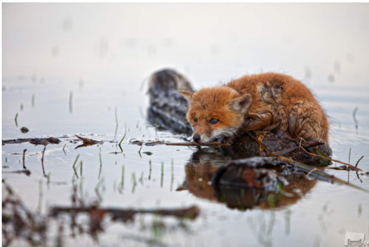
Και έτσι χαλαρώνεις και ξεχνιέσαι... // «Ατελείωτα νερά», Λίπτσεκ