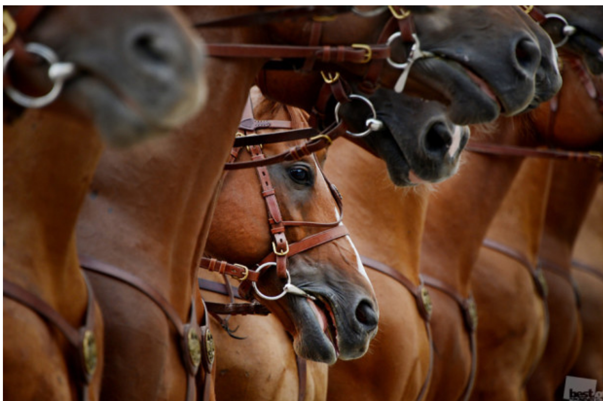
Πάντα θα υπάρχει κάποιος δίπλα σου // “Τα άλογα “, Μόσχα.