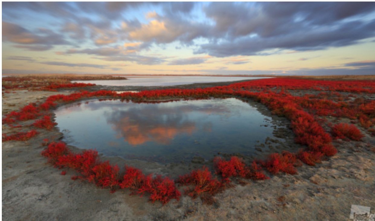
Ή το αντίθετο – μια μικρή άσση στην καρδιά μιας θαμνώδους ερήμου // «Πιάνοντας τα σύννεφα», οικισμός Μιάσκοε, Τσελιάμπινσκ