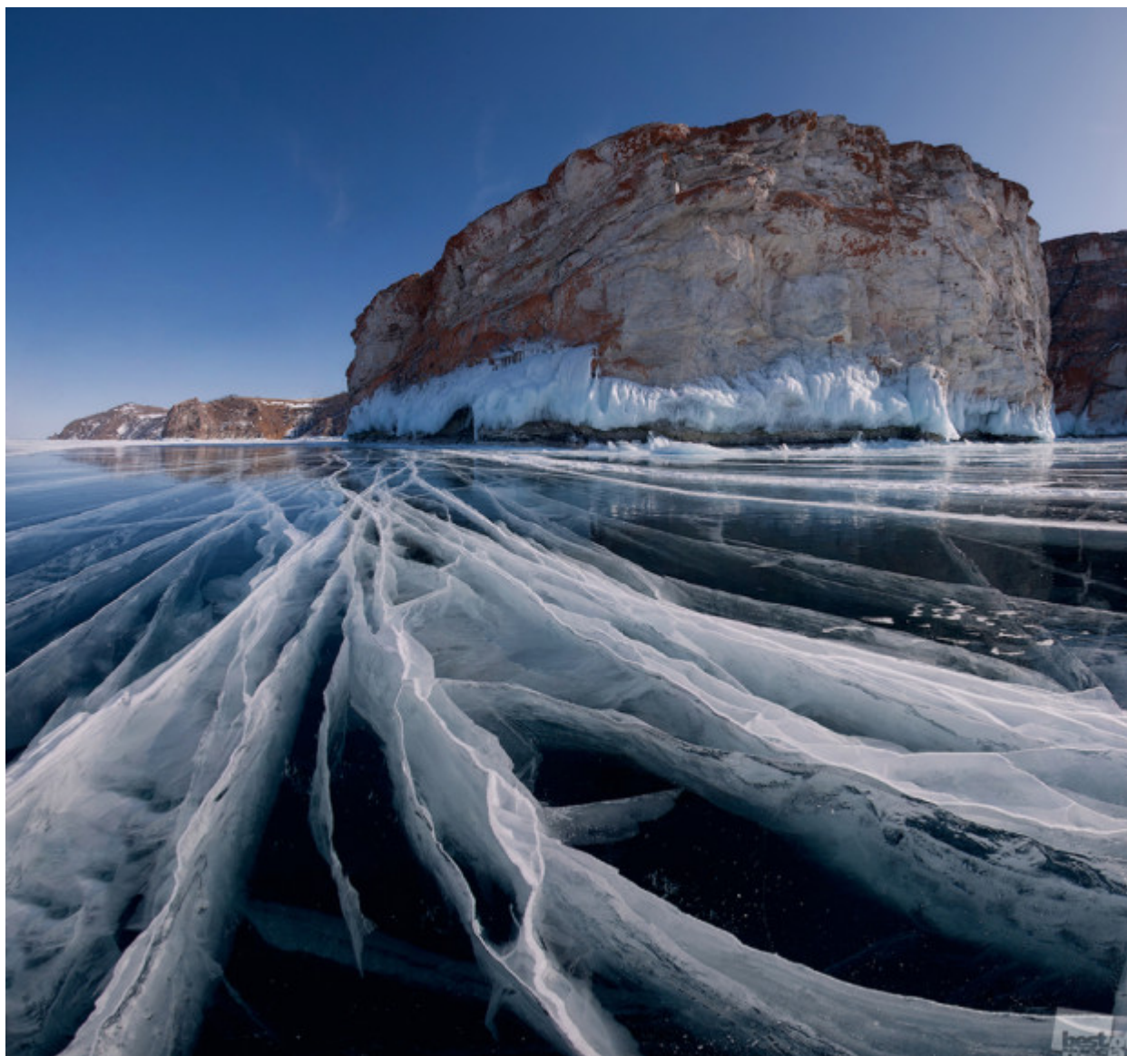
Αν κάνει κρύο έξω ... // "Το Μαμούθ", Κουζίρ.