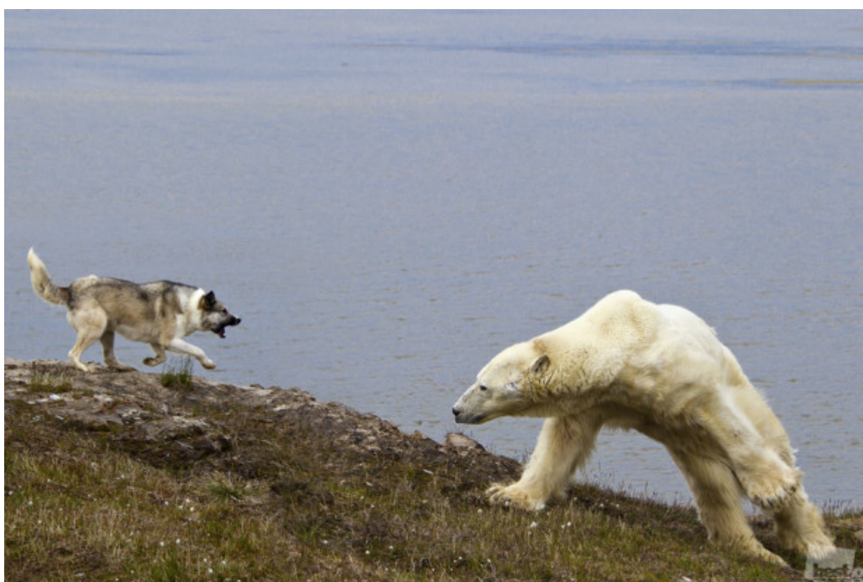
Ρωσική φύση διαθέτει απίστευτα μεγάλη ποικιλία: μπορεί να είναι άγρια και λυσσαλέα // "Η μάχη", Σάλεκχαρντ, στην περιοχή Γιάμαλο-Nenetsky.