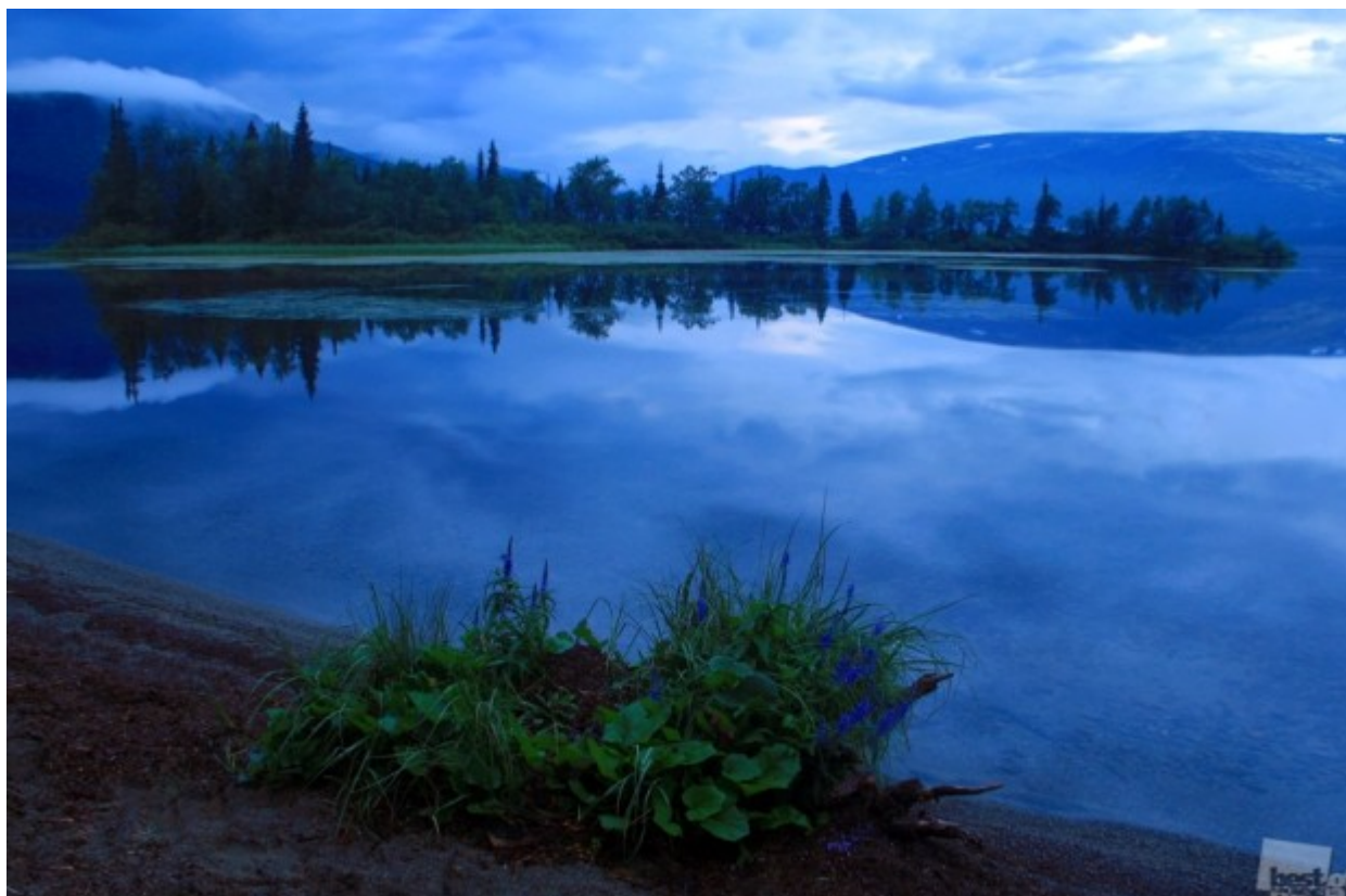
Έτσι, ακόμη και αν είναι σκοτεινή το μισό χρόνο... // «Η νύχτα της πολικής ημέρας », Ρέβντα