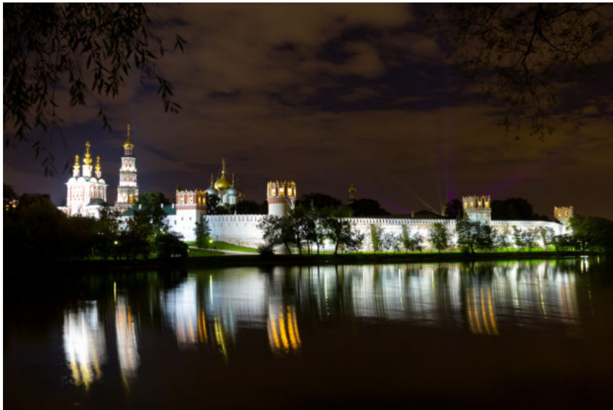
Η ΜΟΝΗ ΝΟΒΟΔΕΒΙΧΙΥ. Το Νέο Μοναστήρι Γυναικών βρίσκεται δίπλα στον ποταμό Μόσχοβα και είναι ένα ήσυχο καταφύγιο στην πολύβουη πόλη της Μόσχας. Το συγκρότημα περιλαμβάνει ένα όμορφο κτήριο του 17ου αιώνα, το μοναστήρι που λειτουργεί και πάλι, και ένα νεκροταφείο με ιδιαίτερη ατμόσφαιρα όπου εκεί είναι θαμμένοι οι πιο διάσημοι συγγραφείς, ποιητές, πολιτικοί και δημόσια πρόσωπα της Ρωσίας.