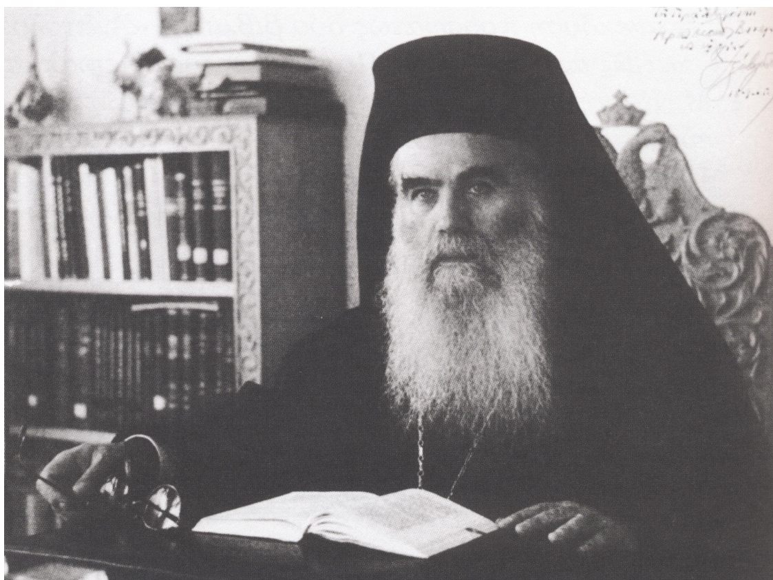
Στο Μητροπολιτικό του γραφείο λίγο καιρό πριν από την κοίμησή του.

Ο μακαριστός Διονύσιος Χαραλάμπους γεννήθηκε το 1907 στο Αβτζιλάρ (Κυνηγοί) Αδραμυττίου της Μικράς Ασίας(1). Οι γονείς και δύο αδελφές του κατακρεουργήθηκαν κατά την μικρασιατική καταστροφή. Στην συγκλονισμένη καρδιά του εφήβου, πού κατέφυγε στην Μυτιλήνη, η φιλανθρωπία του Θεού άναψε φλόγα μεγάλη. «Η πατρική του Κυρίου χειρ έφερε το χειμαζόμενον πλοιάριόν μου εις εύδιον λιμένα. Γηραιός, πεπειραμένος και διά πολλών αρετών κεκοσμημένος άγιος Γέρων, χειραγωγήσας με, μοί ήνοιξε την «Πύλην του Ουρανού»(2). Δέκα χρόνια εμόνασε στην Ιερά Μονή Μεγίστης Λάυρας Αγίου Όρους. Στην συνέχεια σπούδασε στην Αθωνιάδα Σχολή και κατόπιν στην Θεολογική Σχολή της Χάλκης. Το 1934 χειροτονήθηκε εκεί διάκονος και το 1935 πρεσβύτερος.