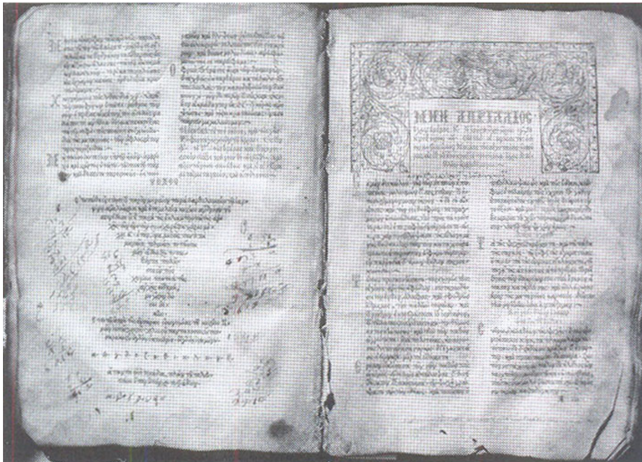
Εκκλησιαστικό βιβλίο με βυζαντινή γραφή