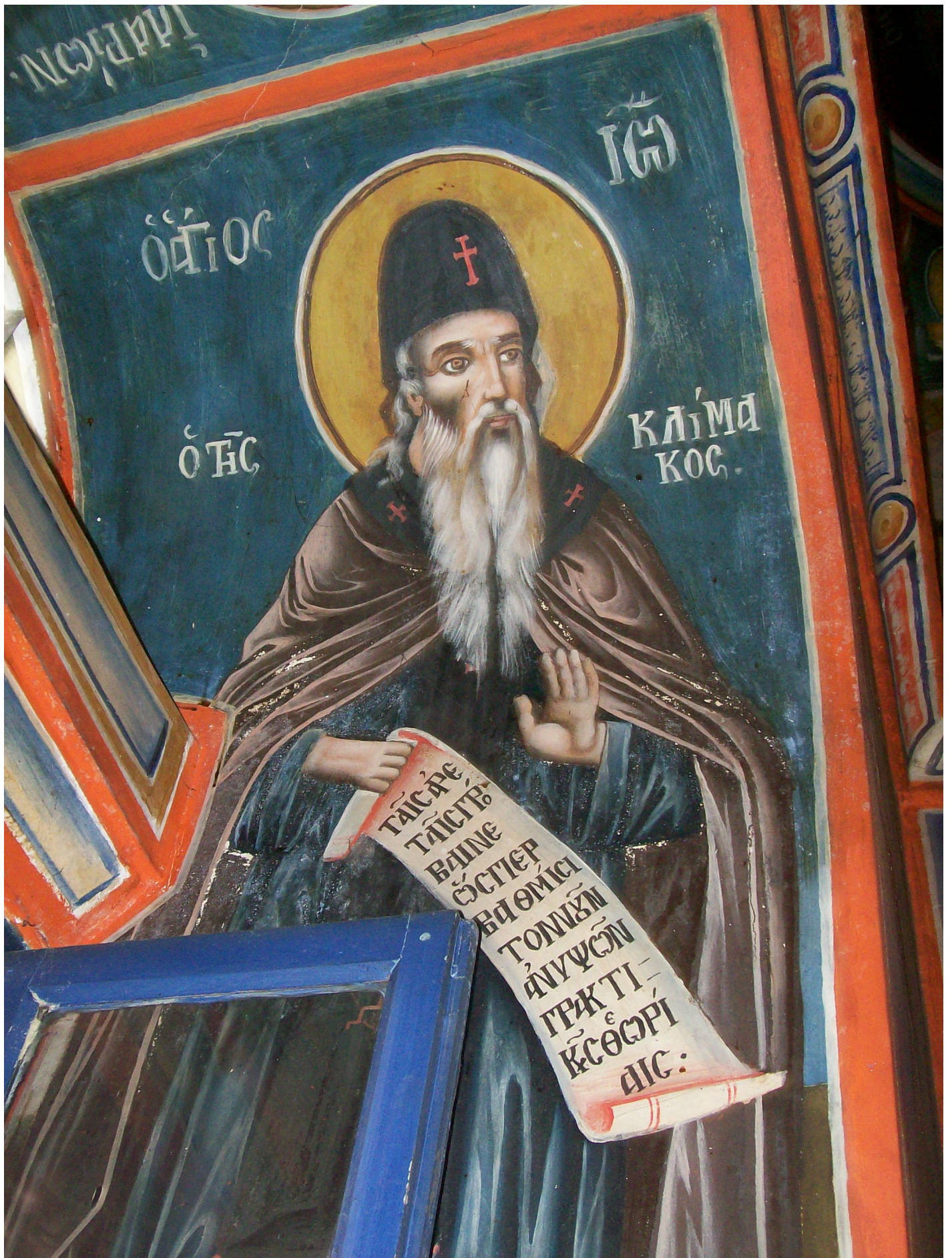
Ο Άγιος Ιωάννης της κλίμακος. Τοιχογραφία από το παρεκκλήσι της Αγίας Ζώνης στην Ιερά Μεγίστη Μονή