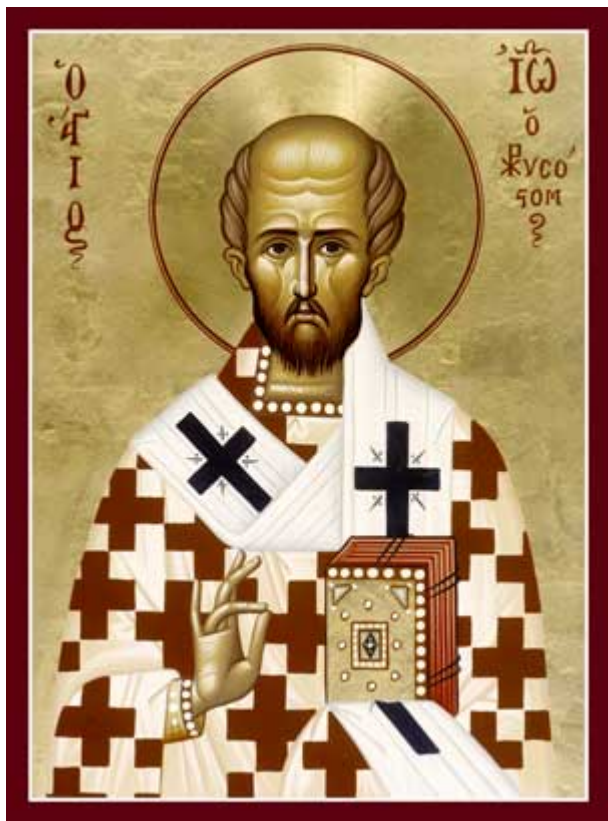
Ο άγιος Ιωάννης ο Χρυσόστομος. Φορητή εικόνα της Ιεράς Μονής Μεταμορφώσεως στην Βοστώνη.

Ο ιερός Χρυσόστομος είναι σχεδόν ο μόνος Πατέρας της Εκκλησίας για τον οποίο γράφτηκε από τους συγχρόνους και τους μεταγενεστέρους του ένας σημαντικός αριθμός βιογραφιών. Μέχρι στιγμής οι (βυζαντινές) βιογραφίες που έχουμε ξεπερνούν τις οκτώ. Μερικές από αυτές αποτελούν ένα είδος διασκευής από κάποια προηγούμενη, χωρίς βέβαια δουλική μίμηση του προτύπου. Κάποτε μέσα στα σχετικά κείμενα συναντάμε στοιχεία εντελώς καινούργια και ίσως εντυπωσιακά. Το πόσο όμως τα στοιχεία αυτά είναι έγκυρα επαφίεται στην επιστημονική ιστορική έρευνα να το εξακριβώσει. Πιθανότατα μερικά δεν πρόκειται να επαληθευτούν. Έξαλλου, μερικά άλλα δημιουργούν την υπόνοια ότι καταχωρήθηκαν από το βιογράφο πρωτογενώς για να εξυπηρετήσουν μια κάποια καλής προθέσεως σκοπιμότητα. Προσγράφοντας ο βιογράφος μια άλφα ή βήτα συμπεριφορά στον βιογραφούμενο, διδάσκει έμμεσα όλους εκείνους που τιμούν τον άγιο ότι και αυτοί πρέπει να τον μιμούνται στη ζωή τους και να συμπεριφέρονται ανάλογα.