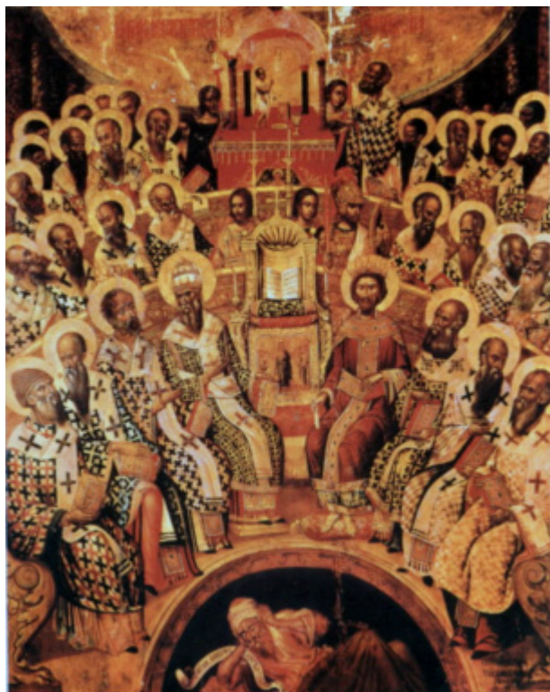
Μεταβυζαντινή εικόνα με θεολογική αναπαράσταση της Α΄ Οικουμενικής Συνόδου (Μιχαήλ Δαμασκηνός, 1591, Μουσείο Αγίας Αικατερίνης Σιναΐτών, Ηράκλειο Κρήτης)