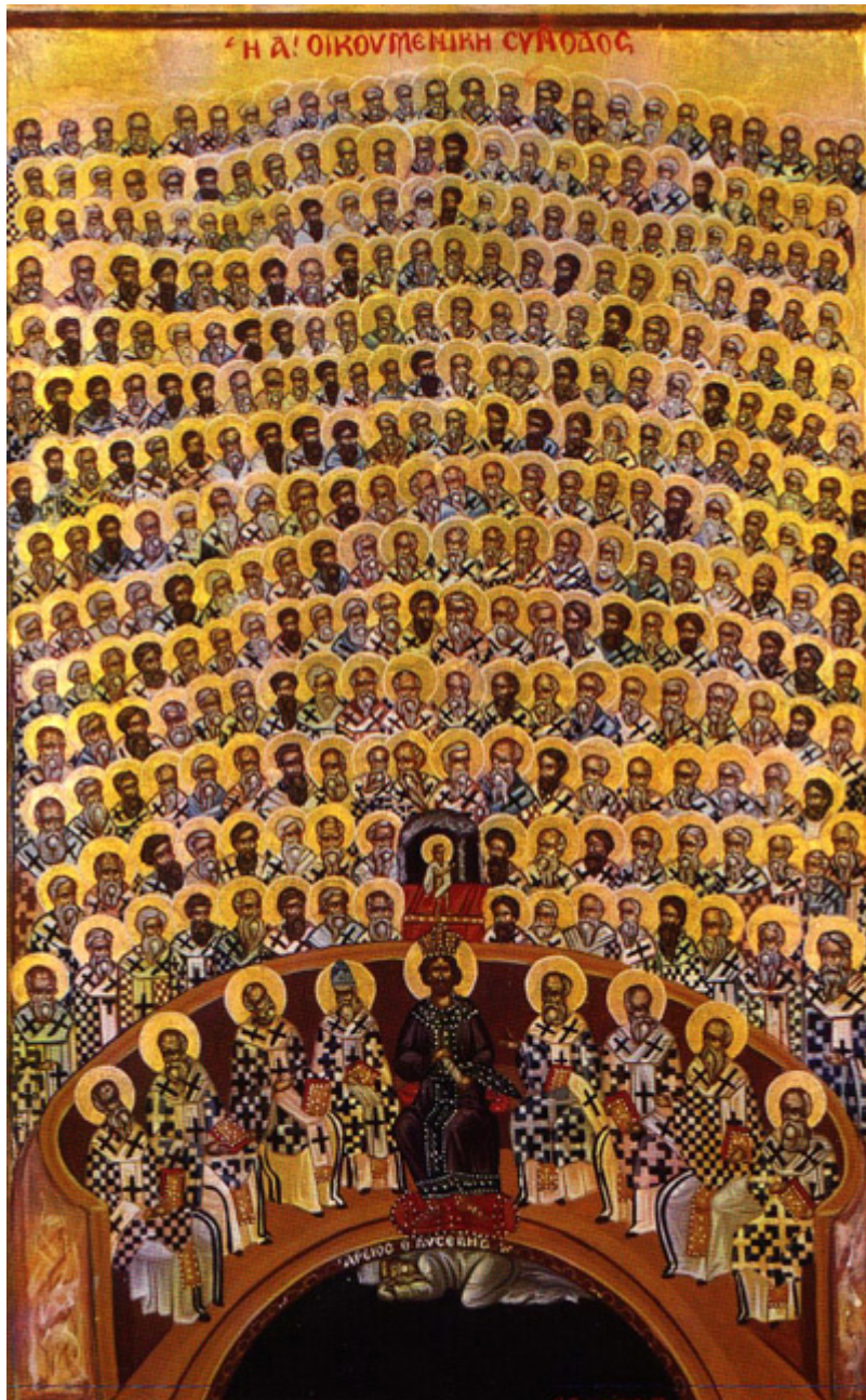
Απεικόνιση της Α' Οικουμενικής Συνόδου