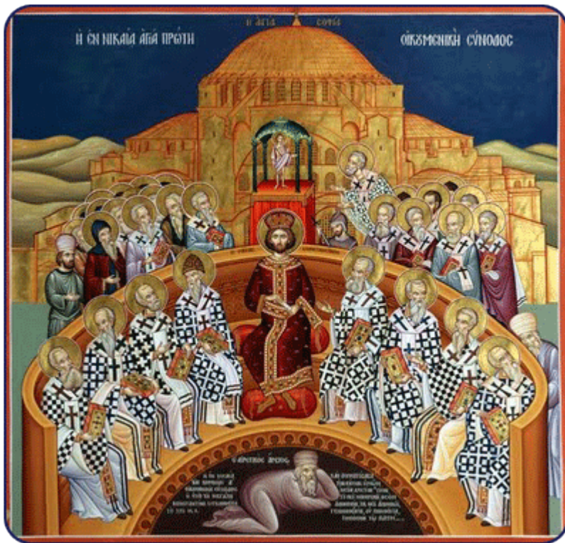
Απεικόνιση της Α' Οικουμενικής Συνόδου