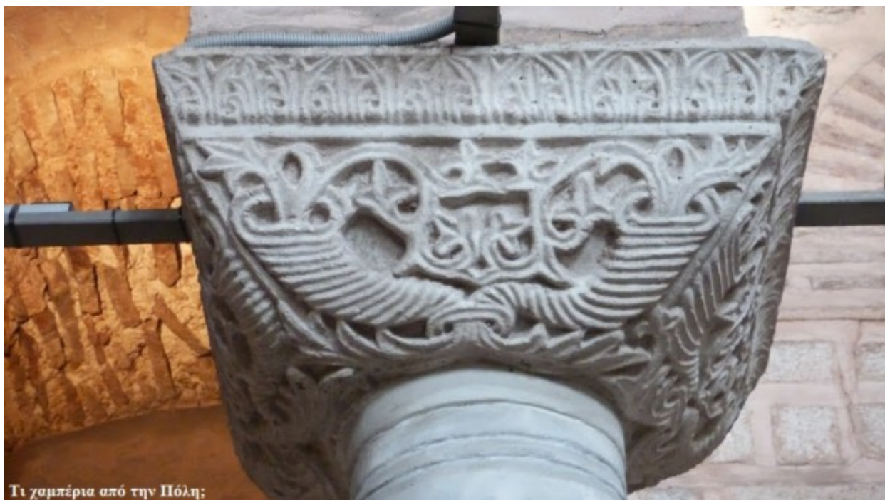
Τι γαμπέρια από την Πόλη;

Λεβητοειδές κιονόκρανο. Η επίπεδη γλυπτή διακόσμηση αποτελεί τον κατεξοχήν βυζαντινό τύπο κίονα