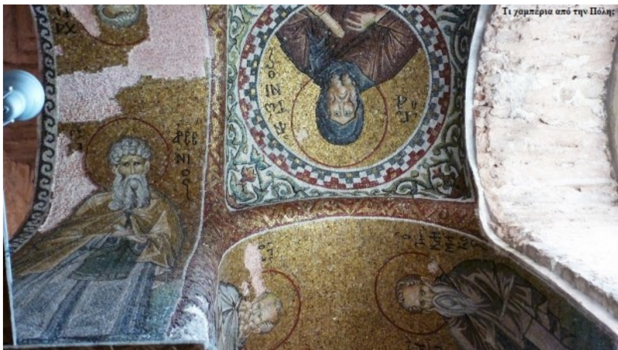
Ο τρούλος με τον Χριστό Παντοκράτορα και τους προφήτες της Παλαιάς Διαθήκης