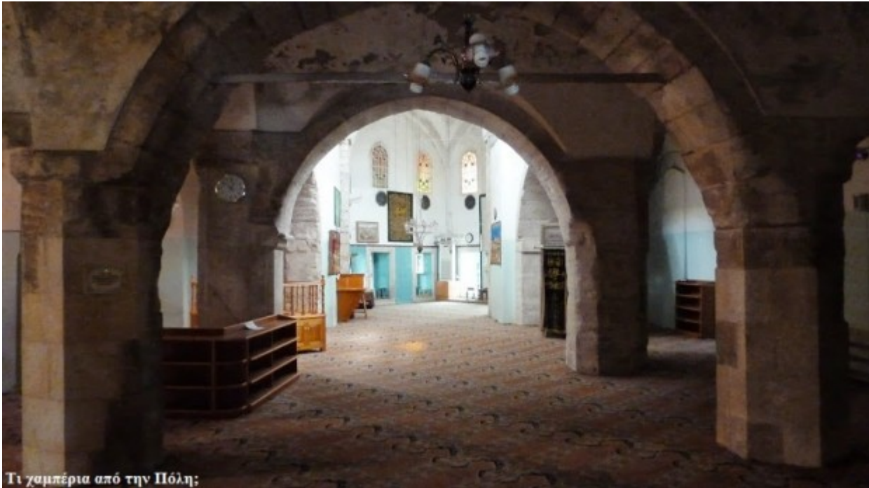
Τι χαμπέρια από την Πόλη;

Ο επιμένων νικά ως φαίνεται και επιτέλους κατάφερα να εισέλθω κι εκεί, εκπληρώνοντας και αυτόν τον σκοπό μου. Ο χώρος βέβαια έχει υποστεί πάμπολες αλλοιώσεις και εκτός από ελάχιστες μικρές λεπτομέριες τίποτα δεν μαρτυρά την εκκλησιαστική καταγωγή του ναού. Μόνον το σημείο που βρίσκεται το μιχράπ, η περίεργη τοποθέτηση του μιμπέρ και μικρές οικοδομικές πινελιές ήταν αυτά που κατάφερα εγώ να παρατηρήσω. Εντύπωση μου προκάλεσαν τα πολλά και ογκώδη στηρίγματα αλλά και το γεγονός ότι αναγκάστηκαν να κατασκευάσουν επιπλέον κτίσμα για την τοποθέτηση του σημείου που δείχνει προς την Μέκκα.