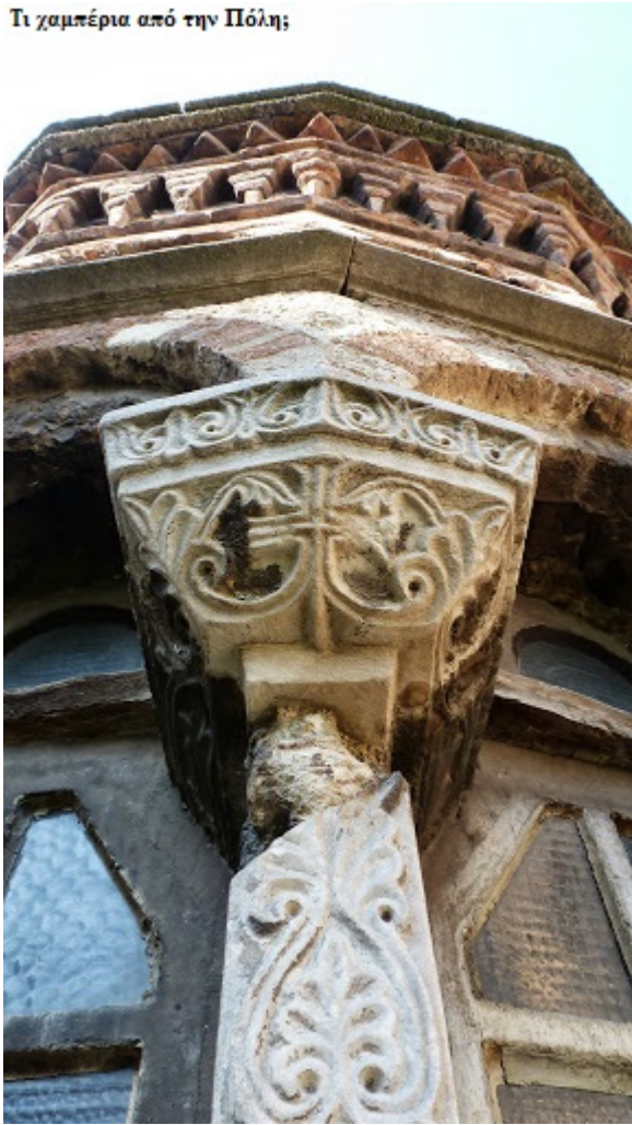
Η Μονή διαθέτει αξιοζήλευτη κεραμόπλαστη διακόσμηση

Στον χώρο της Μονής υπάρχουν τάφοι αυτοκρατόρων και μελών της οικογενείας των Κομνηνών και των Παλαιολόγων, όπως επίσης και ο τάφος του Μιχαήλ Γλαβά στο παρεκκλήσι καθώς και πλήθος αριστοκρατών της εποχής μετά την Άλωση. Πόσοι τάφοι και πόσα λείψανα αυτοκρατόρων και σπουδαίων ανθρώπων βρίσκονται ξεχασμένα στα αγιασμένα χώματα της Πόλης είναι ασύλληπτο να το χωρέσει ο απλός νους.