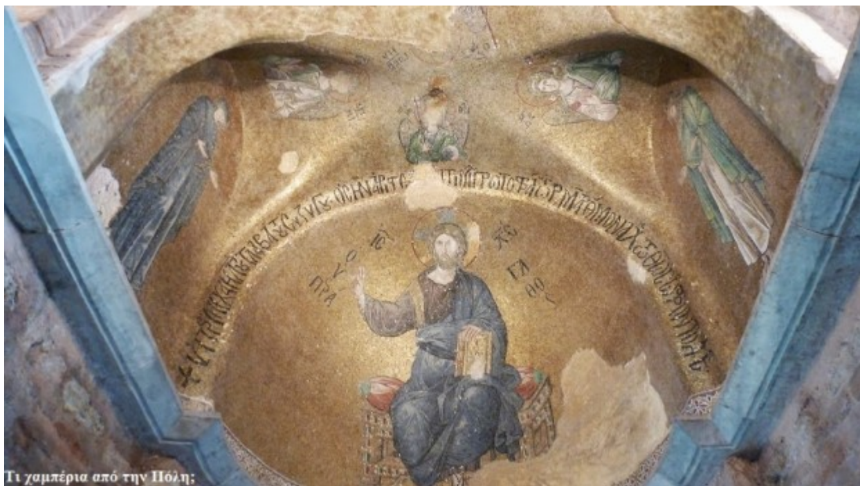
Ο Χριστός Υπεράγαθος, ο σχηματισμός της Δέησης, οι Αρχάγγελοι και η επιγραφή της μοναχής Μάρθας

Στο ημιθούλιο του ιερού βήματος υπάρχει ο Χριστός Υπεράγαθος και δίπλα του βρίσκεται η Θεοτόκος και ο Ιωάννης ο Πρόδρομος σχηματίζοντας την Δέηση. Το ψηφιδωτό διακοσμείται από επιγραφή και αφιέρωμα της Μαρίας Δούκαινας και μετέπειτα μοναχής Μάρθας στον σύζυγο Μιχαήλ Γλαβά. Τριγύρω υπάρχουν οι 4 Αρχάγγελοι.