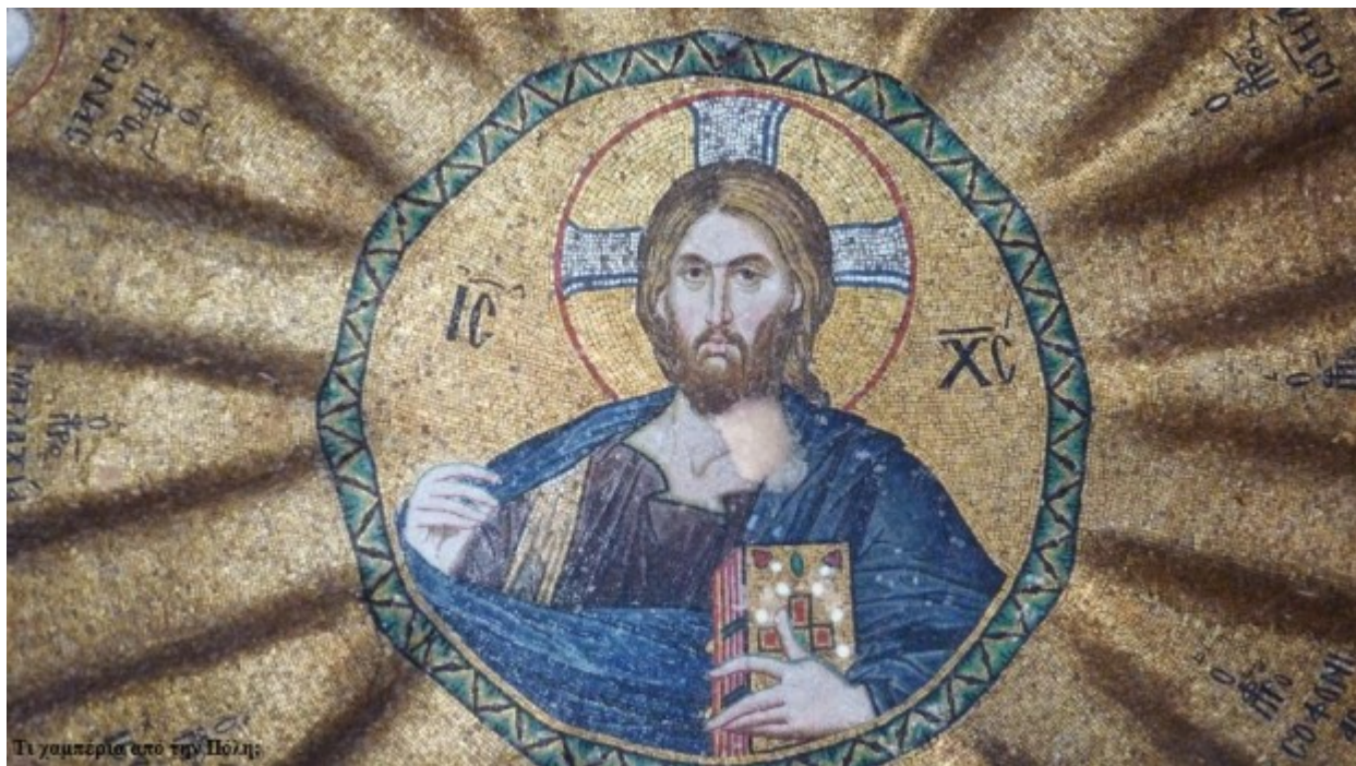
Ο τρούλος είναι ένα πραγματικό ψηφιδωτό αριστούργημα

Στο ημιθούλιο του ιερού βήματος υπάρχει ο Χριστός Υπεράγαθος και δίπλα του βρίσκεται η Θεοτόκος και ο Ιωάννης ο Πρόδρομος σχηματίζοντας την Δέηση. Το ψηφιδωτό διακοσμείται από επιγραφή και αφιέρωμα της Μαρίας Δούκαινας και μετέπειτα μοναχής Μάρθας στον σύζυγο Μιχαήλ Γλαβά. Τριγύρω υπάρχουν οι 4 Αρχάγγελοι.