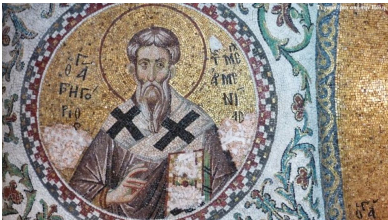
Τι γαμπέριο από την Πόλη;

Από το 1951, αμερικάνοι συντηρητές έφεραν ξανά στην επιφάνεια τα υπέροχα ψηφιδωτά του παρεκκλησίου που με την στιλπνότητα και την ποικιλία των χρωμάτων τους με εντυπωσίασαν, μαγνητίζοντας την ματιά μου προς τα πάνω. Το εσωτερικό συμπληρώνεται με πανέμορφα λεβητοειδή κιονόκρανα, μάρμαρα και λεπτομερέστατη κεραμικόπλαστη διακόσμηση.