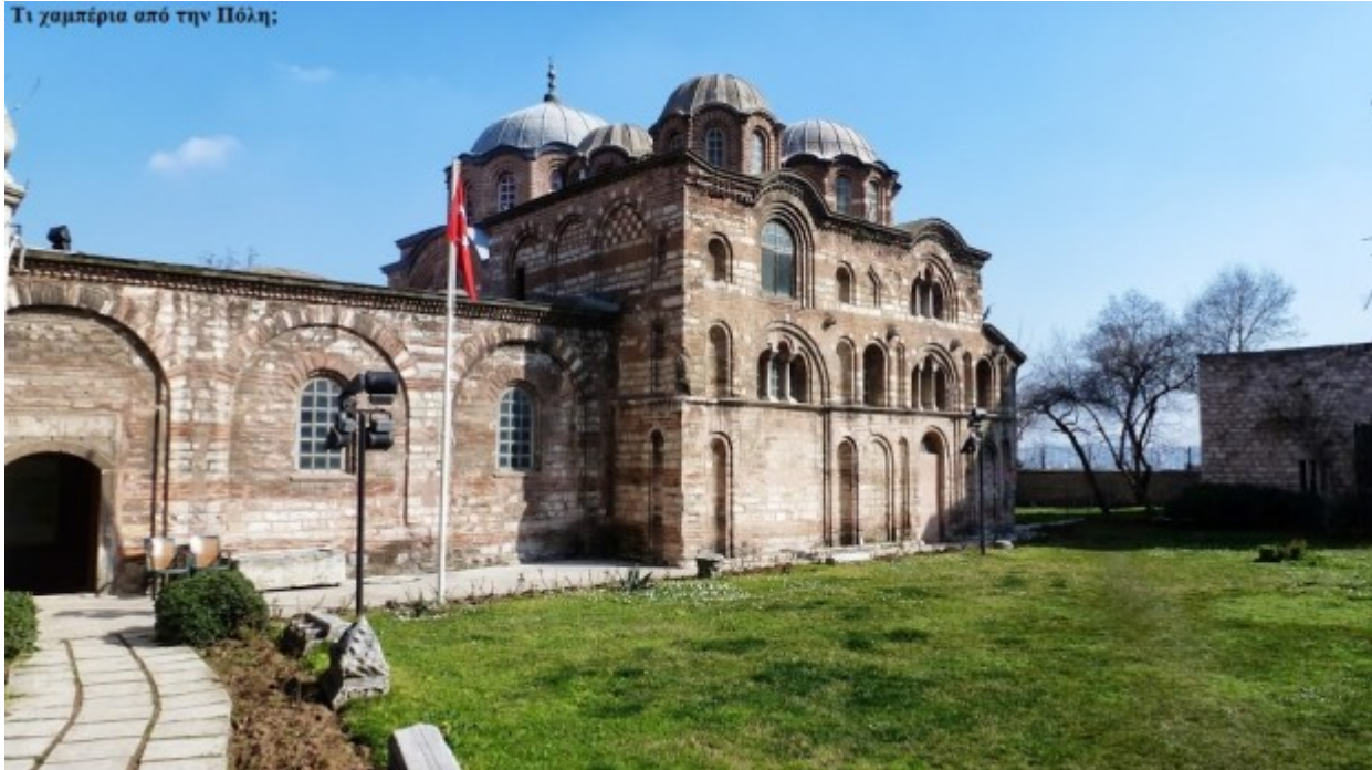
Η Μονή Παμμακάριστου! Σπάνια ομορφιά που σαγηνεύει

Επιστήμες, Τέχνες & Πολιτισμός / Προσκυνήματα-Οδοιπορικά-Τουρισμός