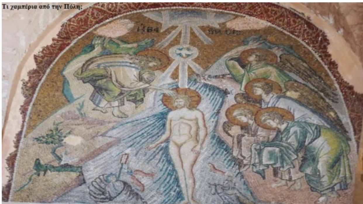
Τι χαμπέρια από την Πόλη;

Διακοσμητική κόγχη, χαρακτηριστικό αρχιτεκτονικό μέσο εκείνης της περιόδου με συνοδεία μαρμάρινης διακόσμησης