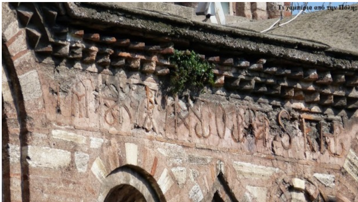
Ποιητικές επιγραφές περιτριγυρίζουν τον ναό

Βγαίνοντας έξω δεν μπορούσα να μην ξαναθαυμάσω τον ναό και τα αρχιτεκτονικά χαρακτηριστικά του. Οι πολλές καμπύλες, οι κόγχες, τα αετώματα και ο ανηλωμένος τρούλος εξαιτίας του τυμπάνου είναι ιδιαιτερότητες που διεγείρουν την φαντασία και δίνουν ζωντάνια στο οικοδόμημα. Σε αυτό προσθέτεται και η επιγραφή του ποιητή Μανουήλ Φιλή που διακοσμεί περιμετρικά τον ναό και δίνει την τελευταία πινελιά σε αυτό το αρχιτεκτονικό, καλλιτεχνικό και ιστορικό μεγαλείο.