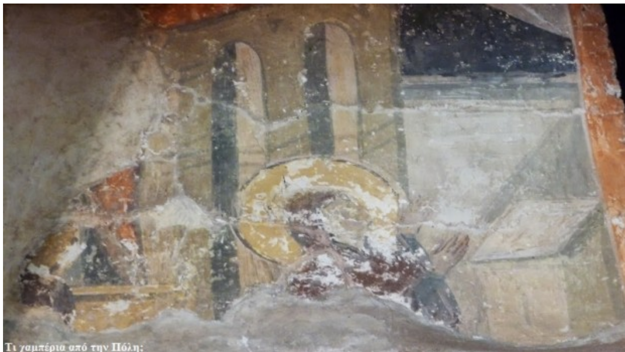
Τι γαμπέριο από την Πόλη;