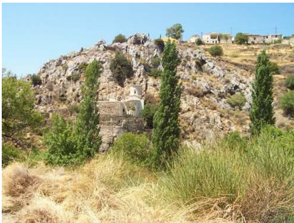
Παναγία Αγιογαλούσaina - Χίος