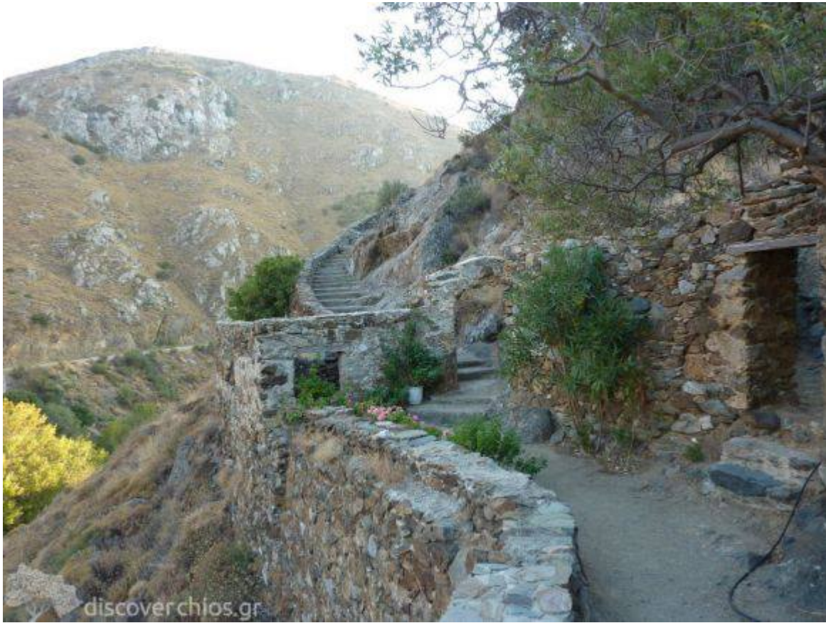
Παναγία Αγιογαλούσaina - Χίος

Επιστήμες, Τέχνες & Πολιτισμός / Προσκυνήματα-Οδοιπορικά-Τουρισμός