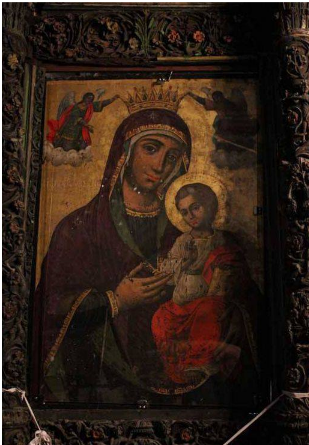
Παναγία Αγιογαλούσσινα - Χίος