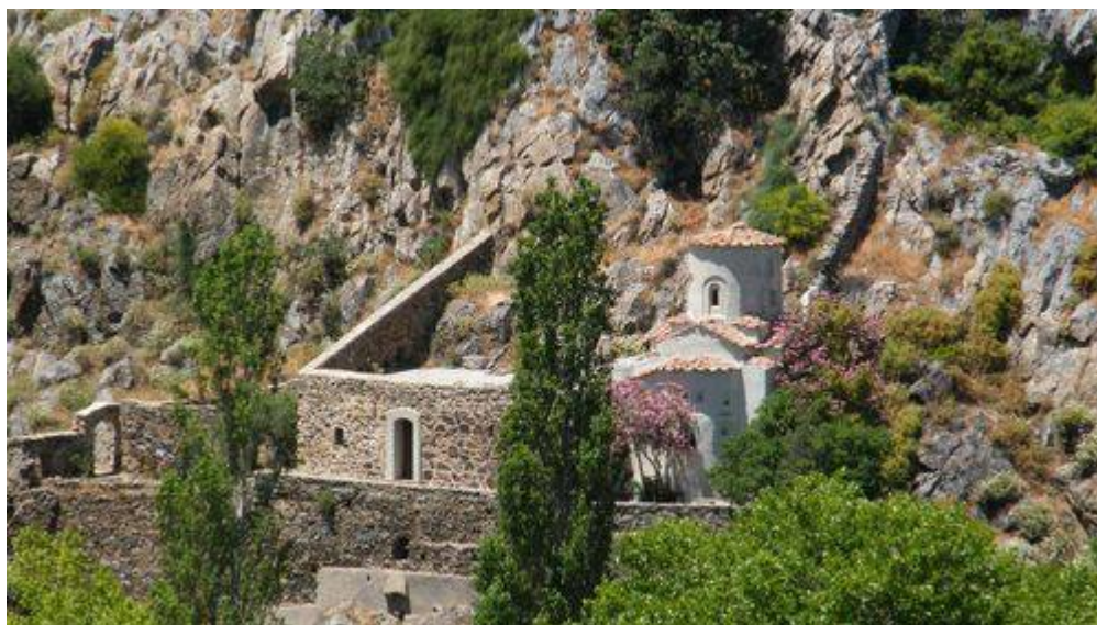
Παναγία Αγιογαλούσaina - Χίος