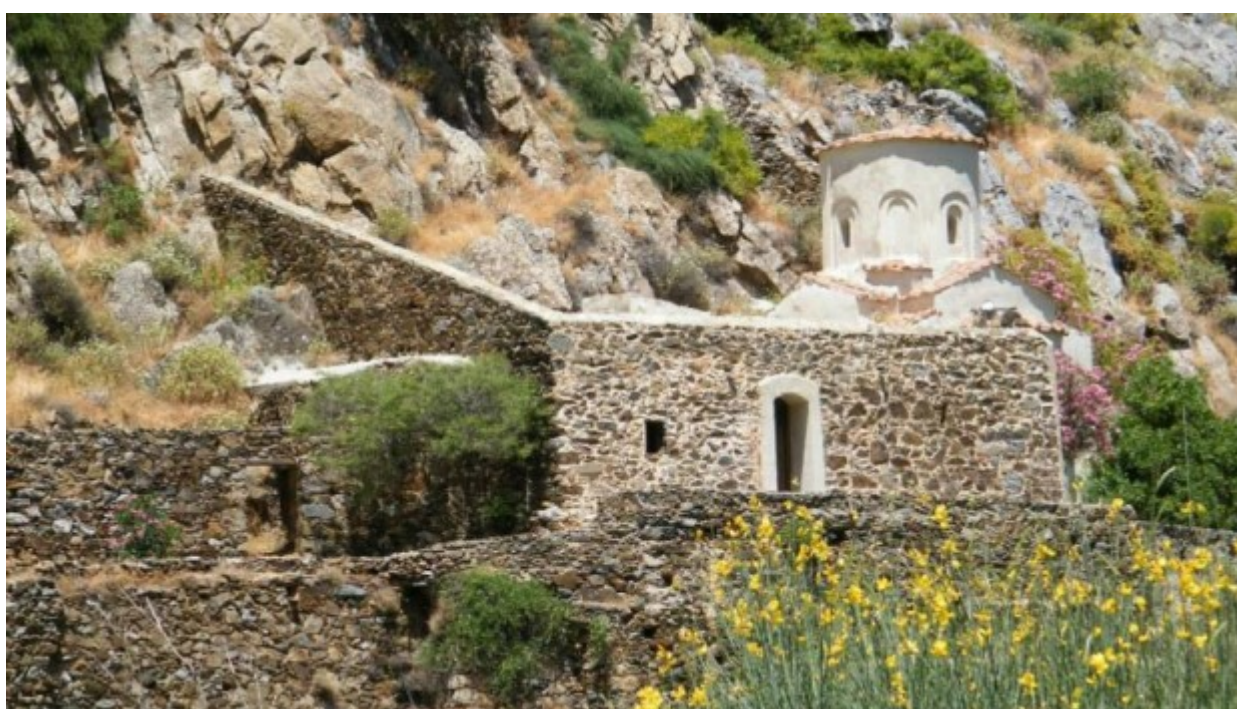
Παναγία Αγιογαλούσaina - Χίος