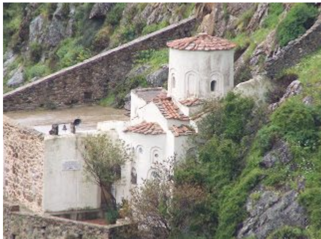
Παναγία Αγιογαλούσaina - Χίος

Ο ναός της Παναγίας Αγιογαλούσaiνας βρίσκεται μετά το χωριό Άγιο Γάλας το οποίο παλαιότερα ονομαζόταν Άγιος Θαλελαίος.