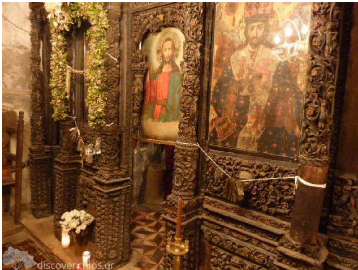
Παναγία Αγιογαλούσaina - Χίος