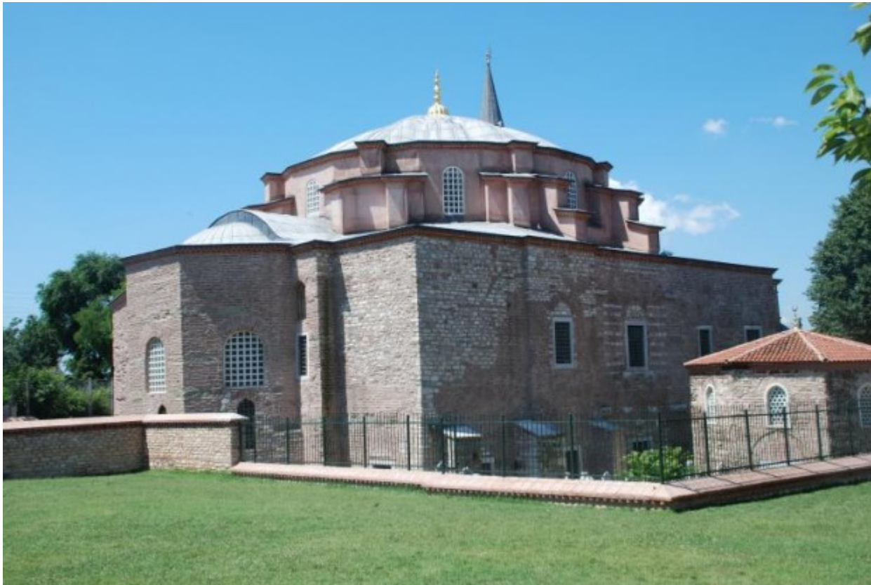
Εξωτερική άποψη. Κωνσταντινούπλη, Άγιος Σέργιος Βάκχος.

παραχωρήθηκαν από το δημόσιο. Κατά τον 5ο και 6ο αιώνα οι χριστιανικοί ναοί ιδρύονταν σε κεντρικά σημεία του πολεοδομικού ιστού και καταλάμβαναν χώρους δίπλα ή και μέσα στα παλαιά και οικονομικά κέντρα, αποβαίνοντας έτσι τοπόσημα της περιοχής.