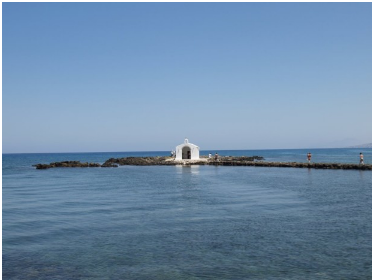
Ο Άγιος Νικόλαος στη Γεωργιούπολη Χανίων