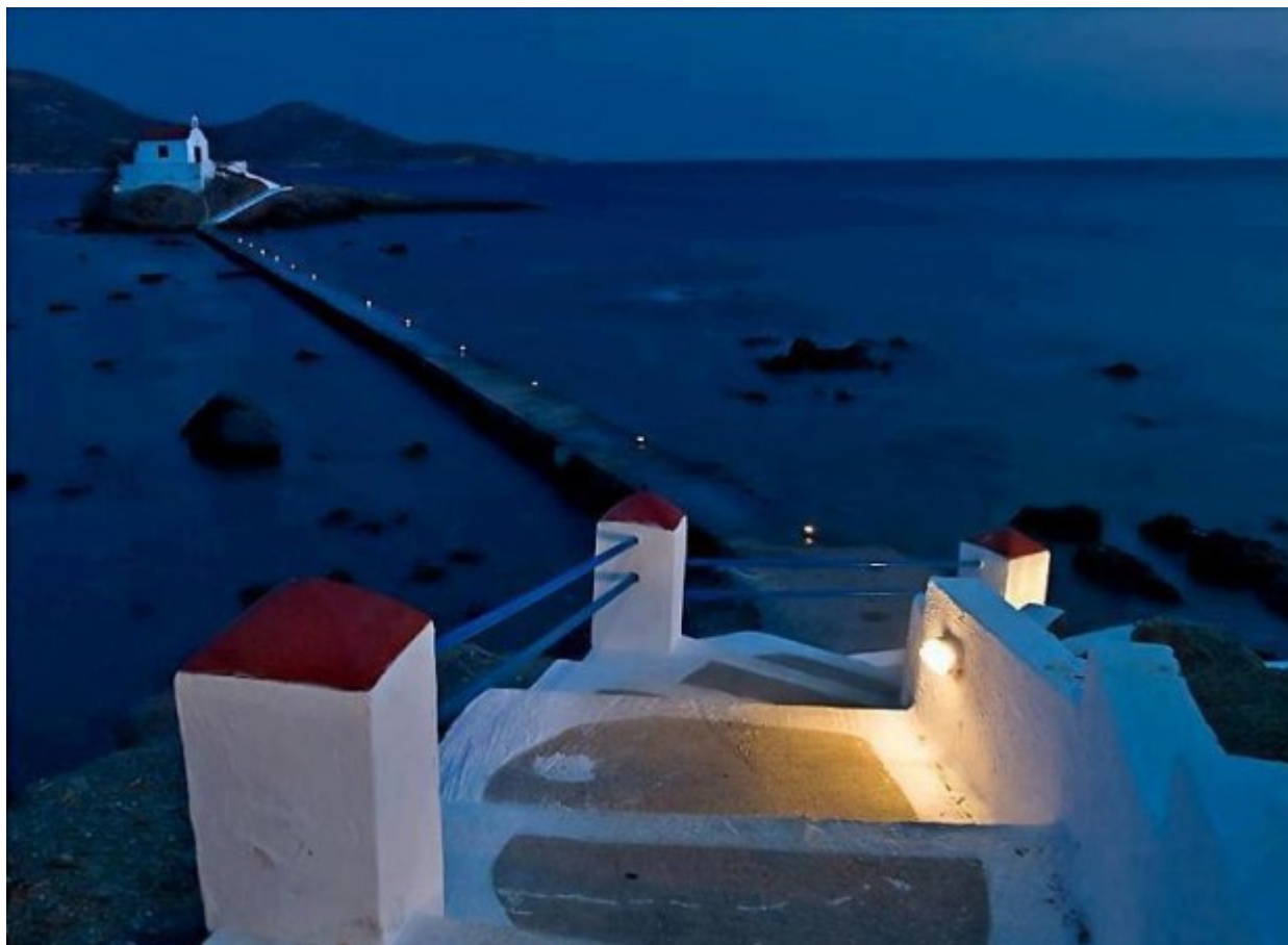
Ο Άγιος Ισίδωρος στη Λέρο