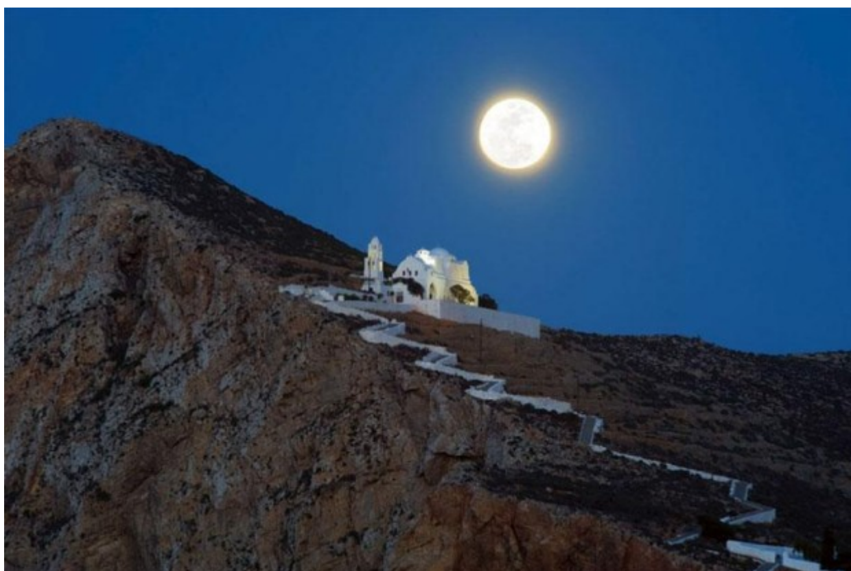
Η εκκλησία της Παναγιάς στη Φολέγανδρο