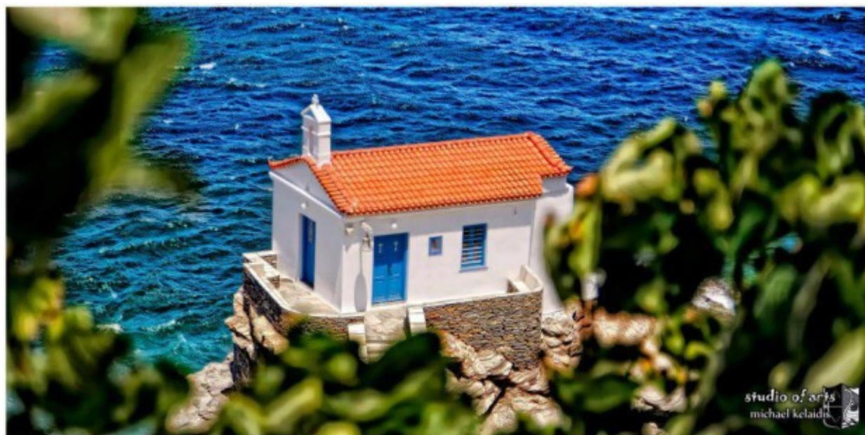
Η Παναγιά η θαλασσινή στην Άνδρο