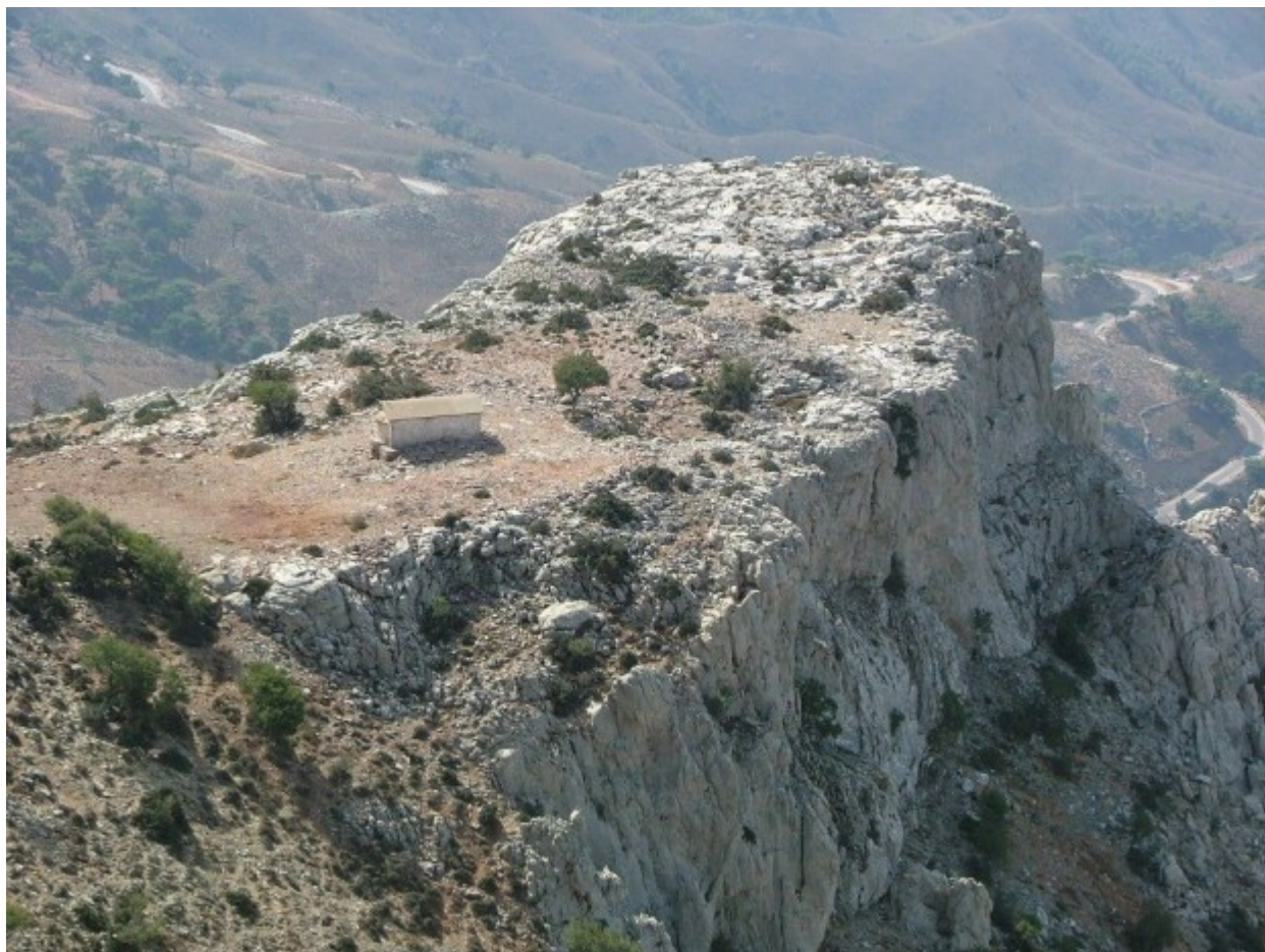
Η Ζωοδόχος Πηγή στη Σπαρτούντα της Χίου