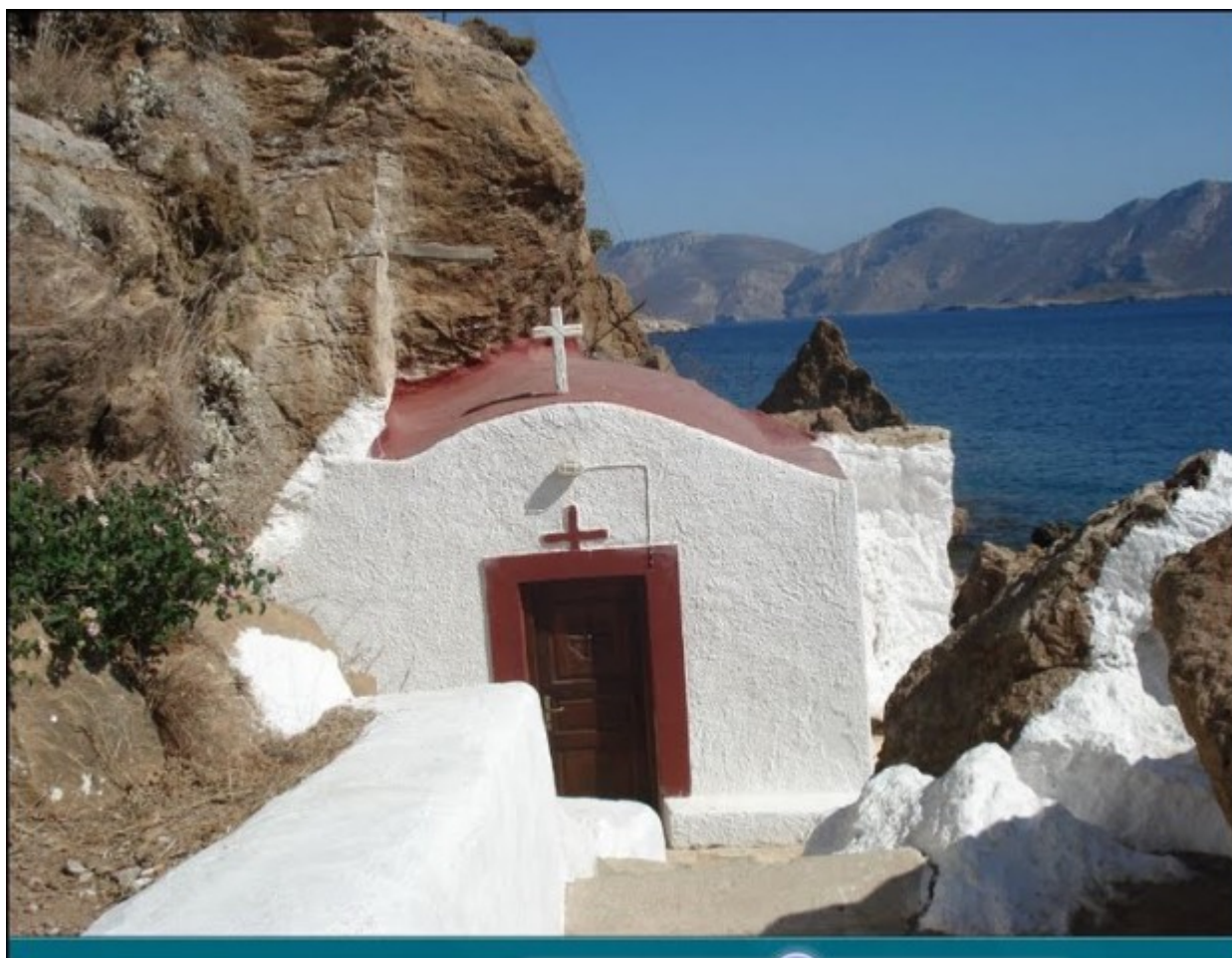
Παναγιά η Καβουράδαινα στη Λέρο