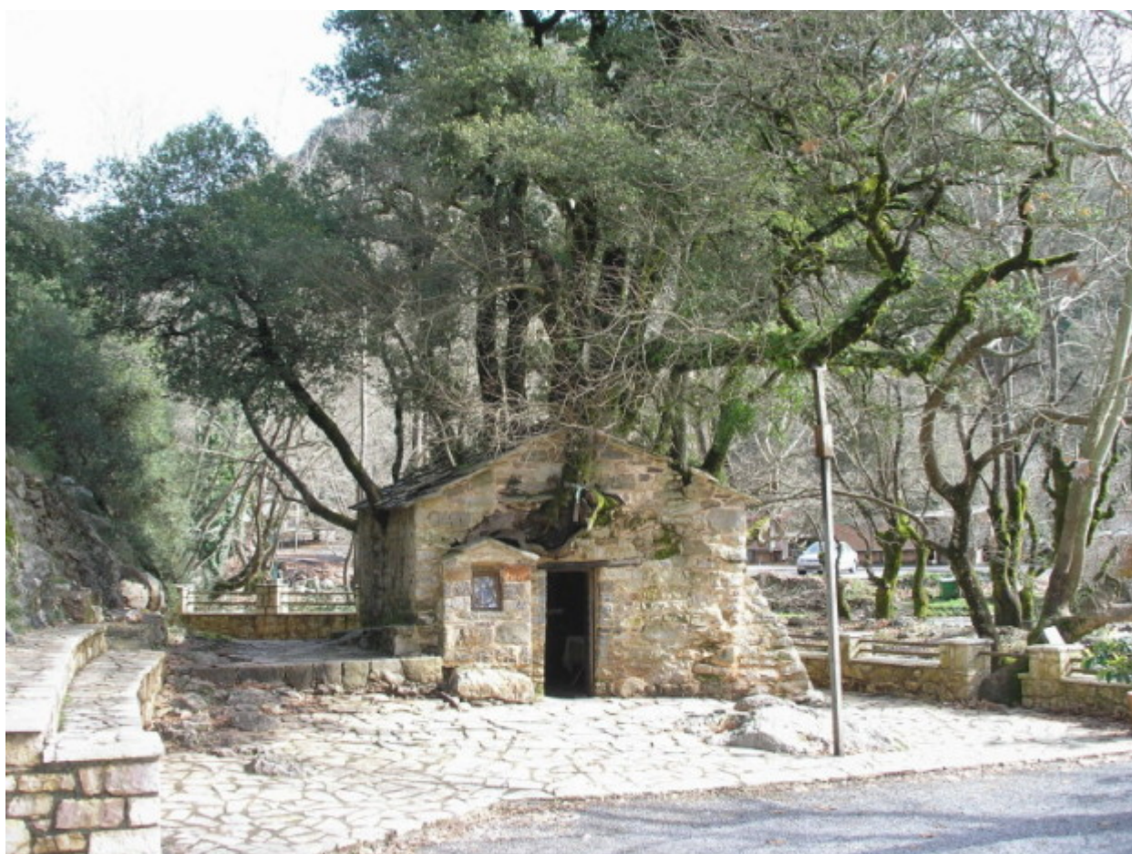
Η Αγία Θεοδώρα στη Βάστα Αρκαδίας