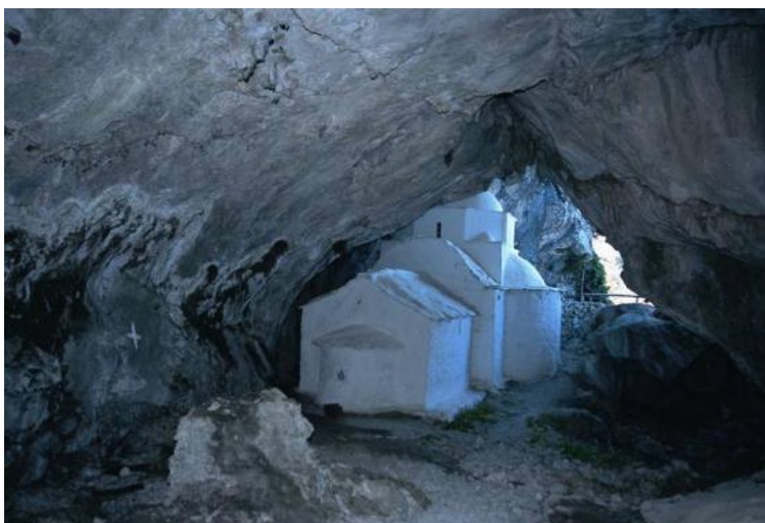
Παναγια η Μακρινή στη Σάμο