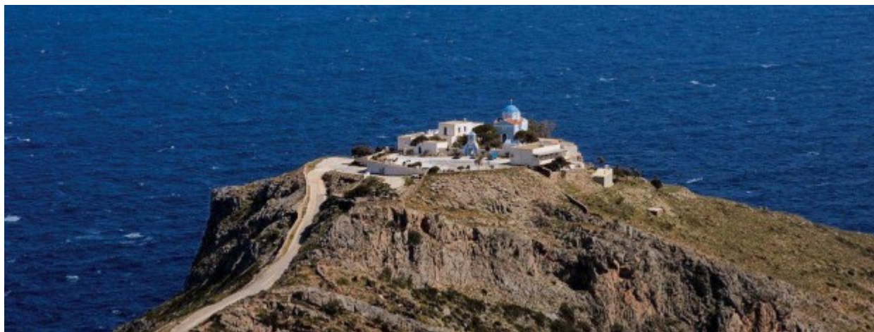
Η Παναγιά Καστριανή στη Τζια