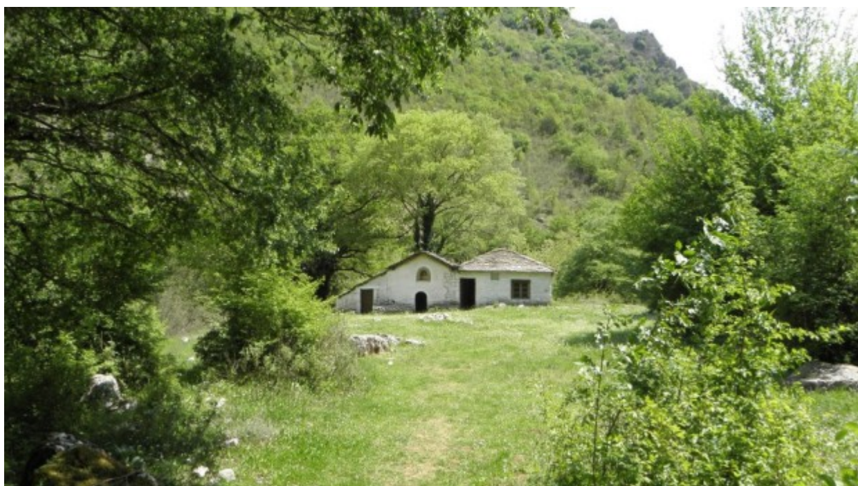
Ένα μικρό εκκλησάκι στη χαράδρα του Βίκου