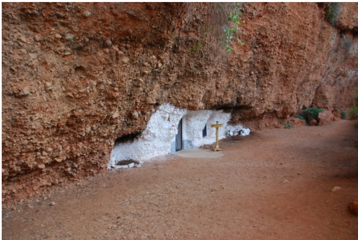
Άγιος Γεώργιος (δύο εκκλησάκια) στα Δίδυμα Αργολίδας