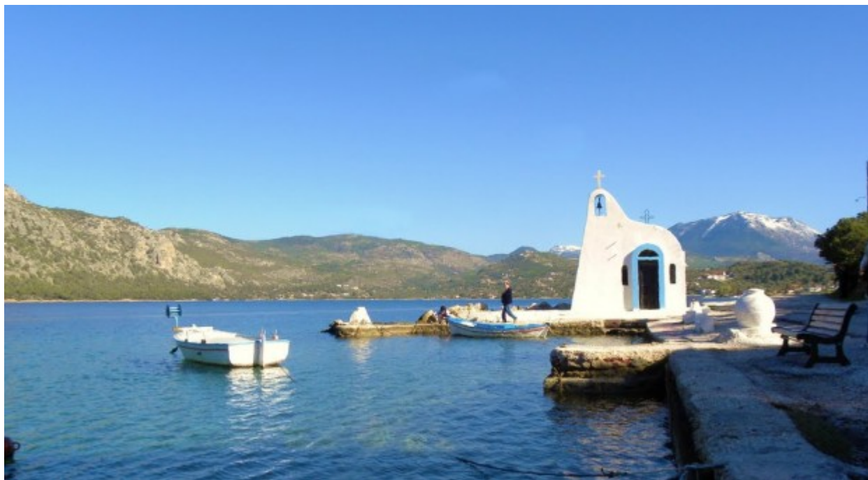
Ο Άγιος Νικόλαος στη λίμνη Ηραίου