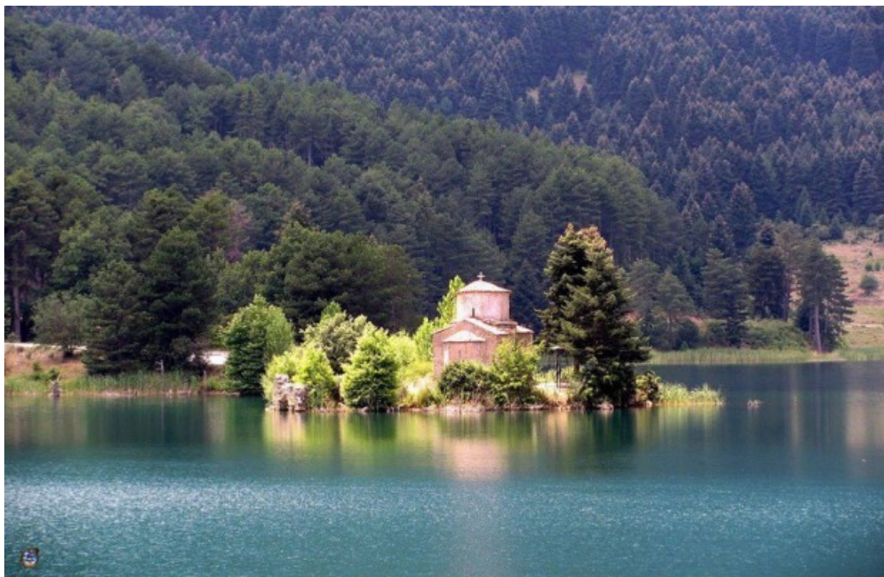
Ο Άγιος Φανούριος στη λίμνη Δόξα