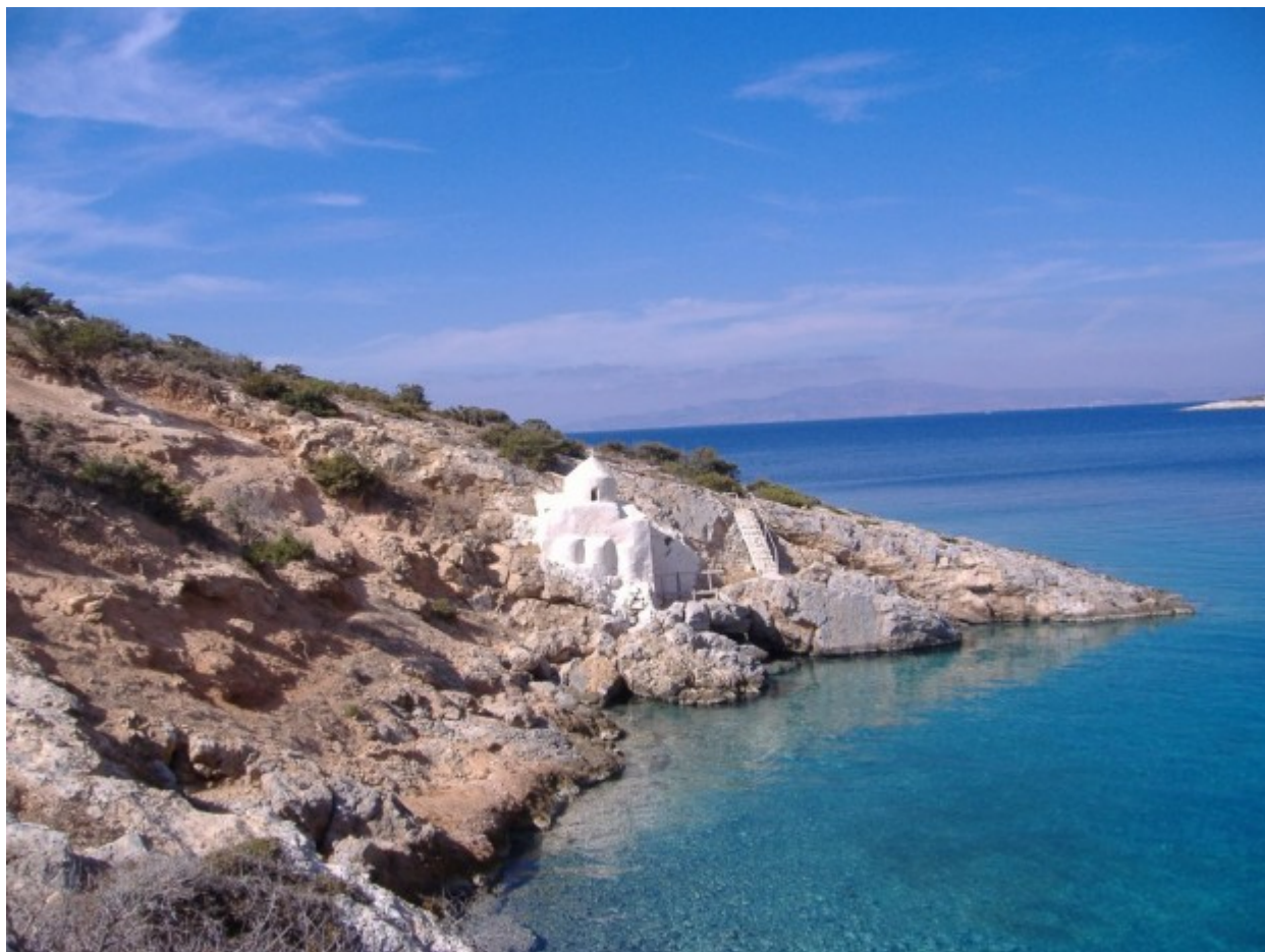
Ο Άγιος Σώζων στη Νάξο