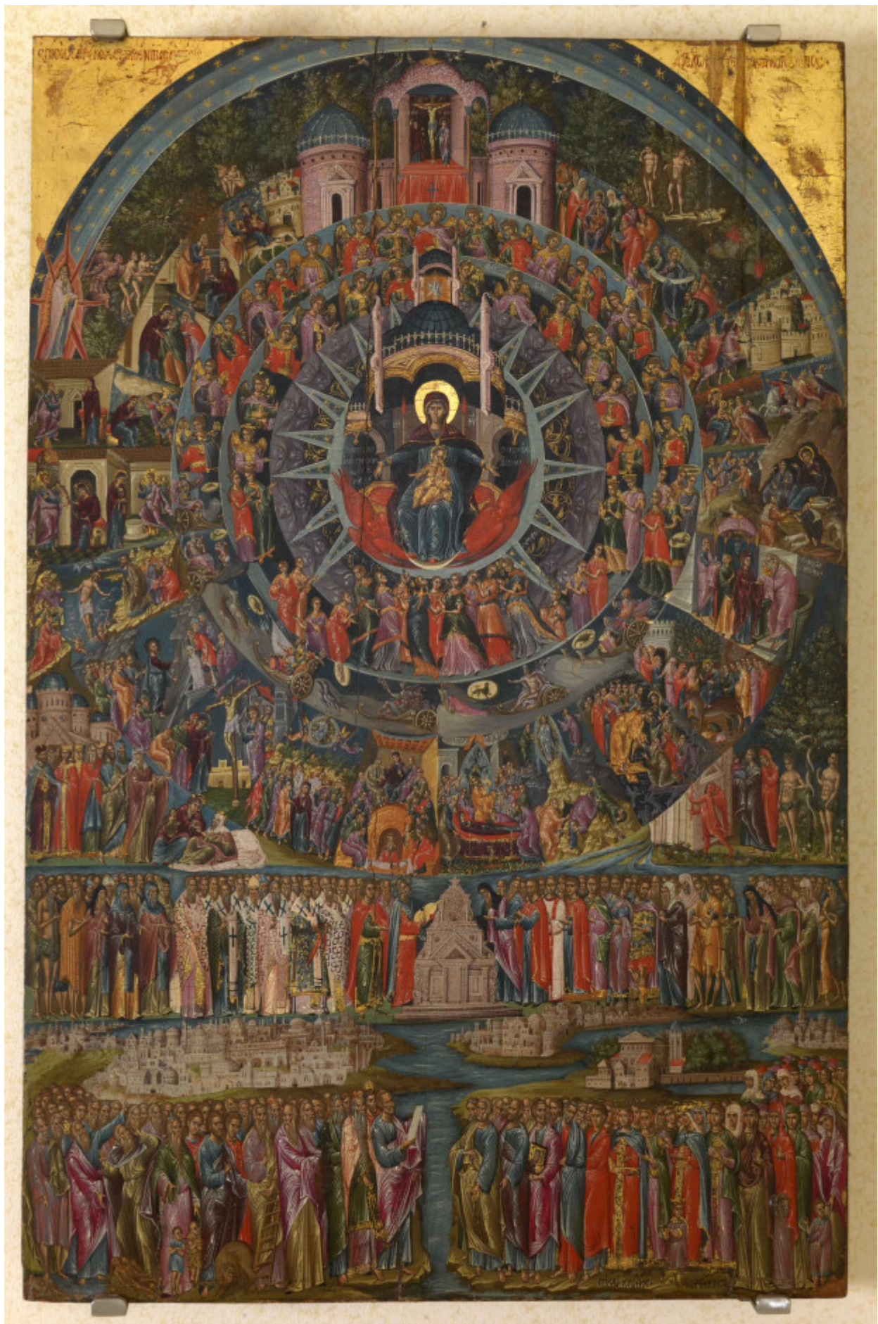
Εικονογράφηση του ύμνου «Επί Σοι Χαίρει», τέλη 16ου αιώνα μ.Χ., Γεώργιος Κλόντζας