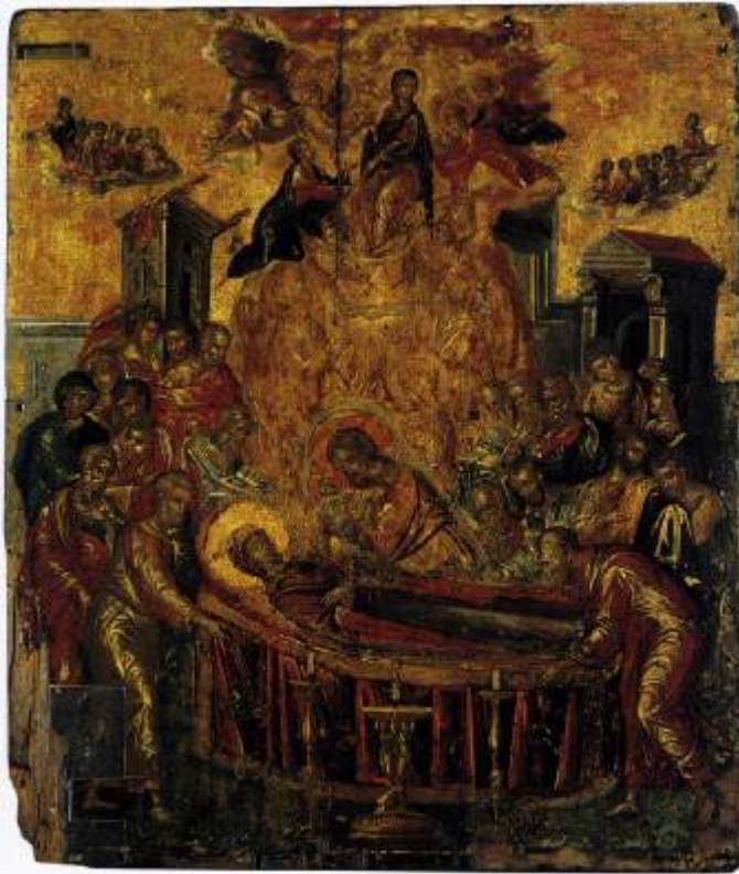
Κοίμηση της Θεοτόκου - Δομήνικος Θεοτοκόπουλος (El Greco) 16ος αι. μ.Χ. - Καθεδρικός Ναός Κοίμησης της Θεοτόκου Ερμούπολη - Σύρος