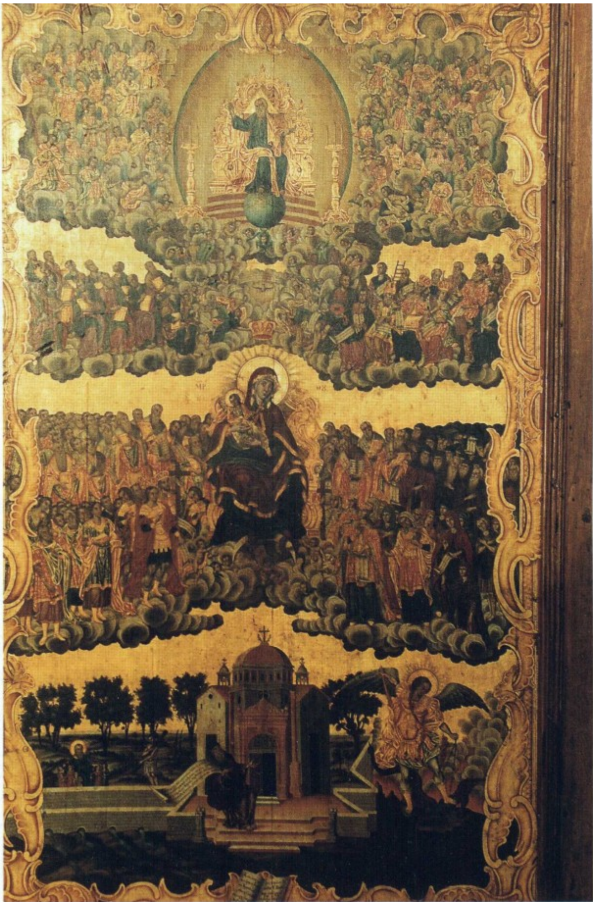
Εικονογράφηση του ύμνου «Επί Σοι Χαίρει»