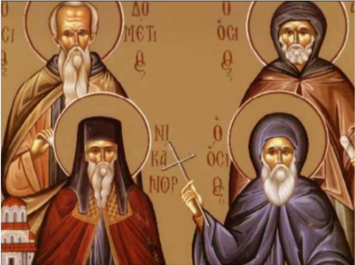
Άγιος Δομέτιος ο Πέρσης και οι δύο μαθητές του

Ορθοδοξία και Ορθοπραξία / Συναξαριακές Μορφές