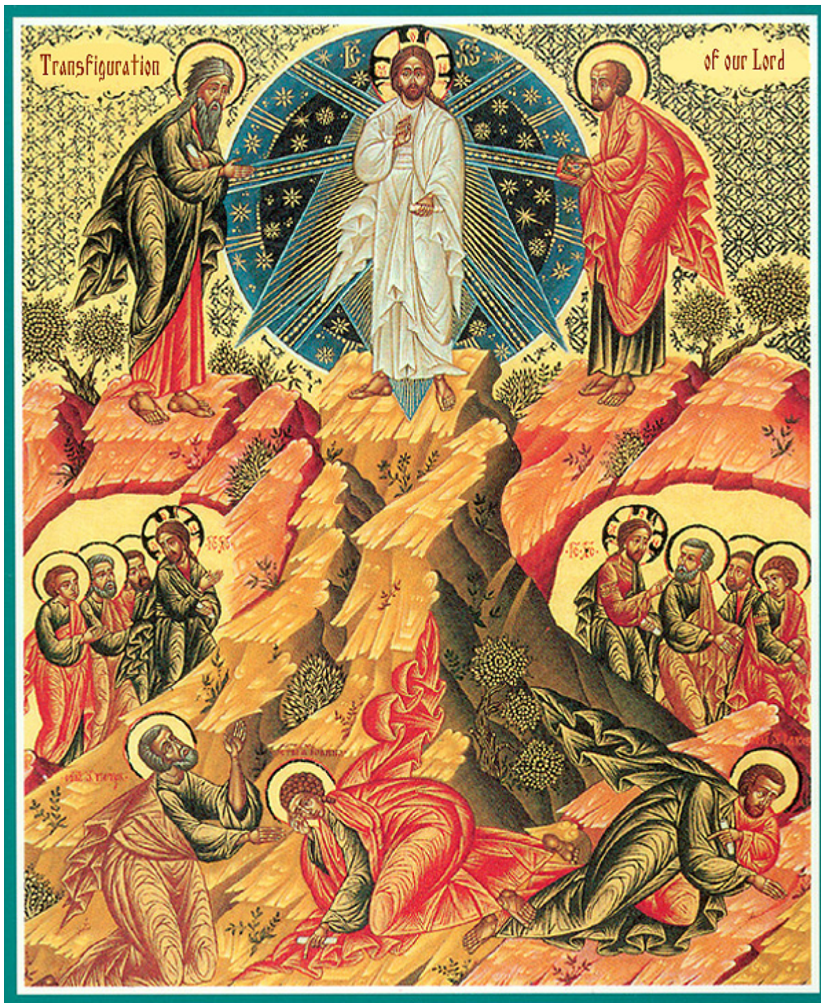
Μεταμόρφωση του Σωτήρος Χριστού