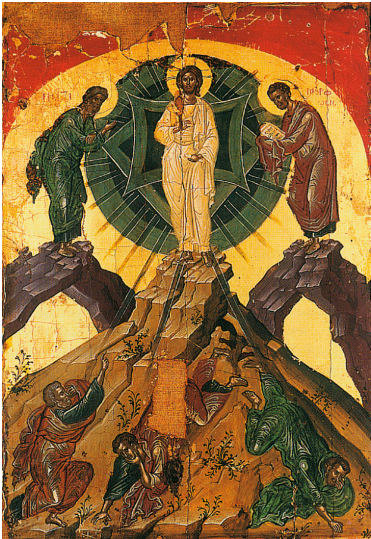
Μεταμόρφωση του Σωτήρος Χριστού - Θεοφάνη του Κρητός, Ι.Μ. Σταυρονικήτα, 1546 μ.Χ.