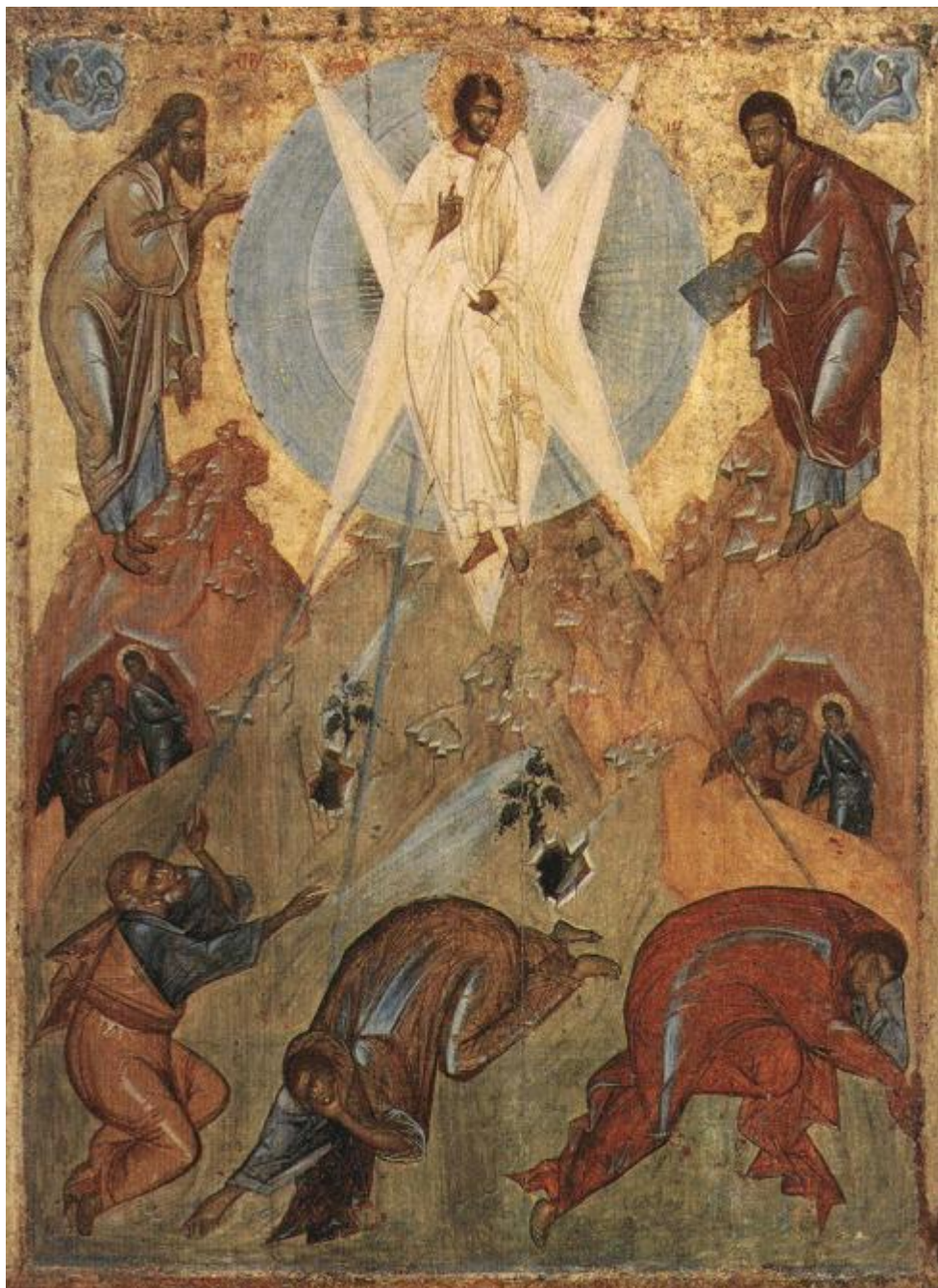
Μεταμόρφωση του Σωτήρος Χριστού