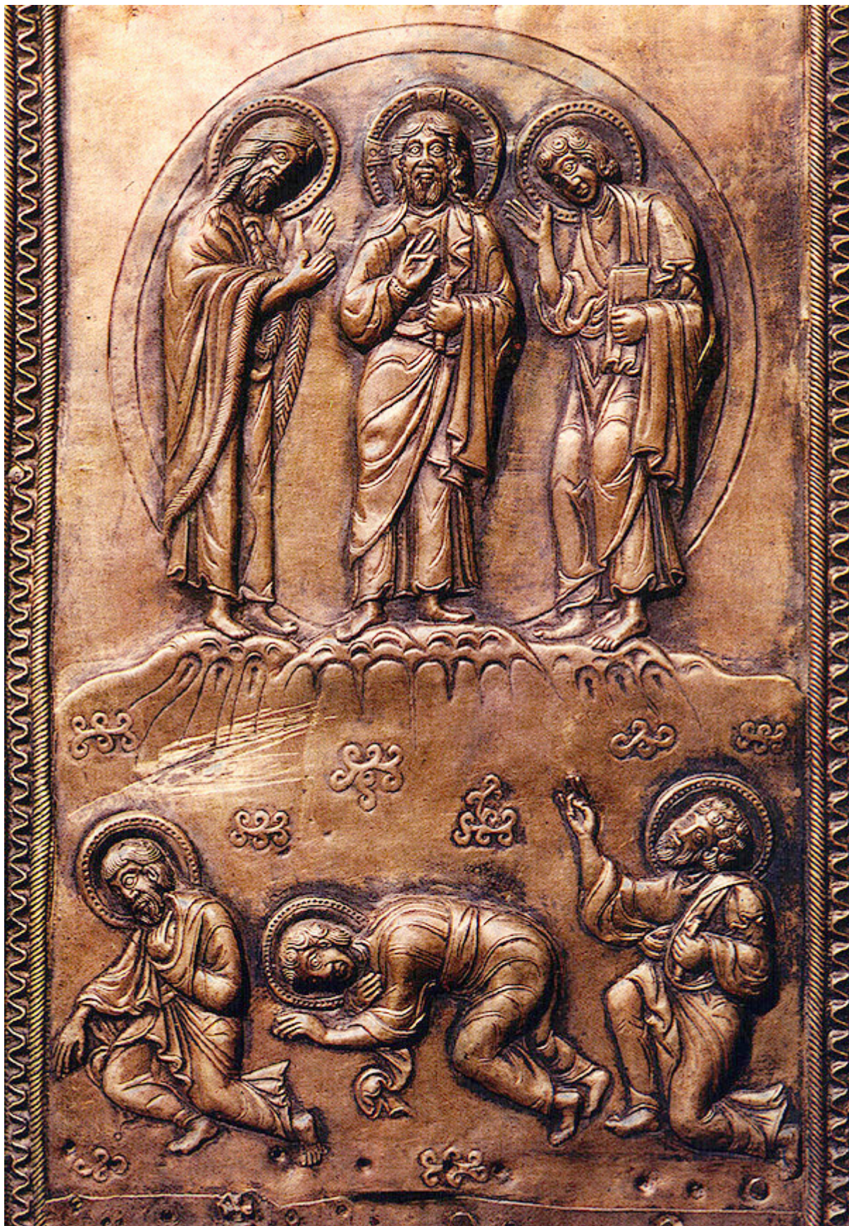
Μεταμόρφωση του Σωτήρος Χριστού