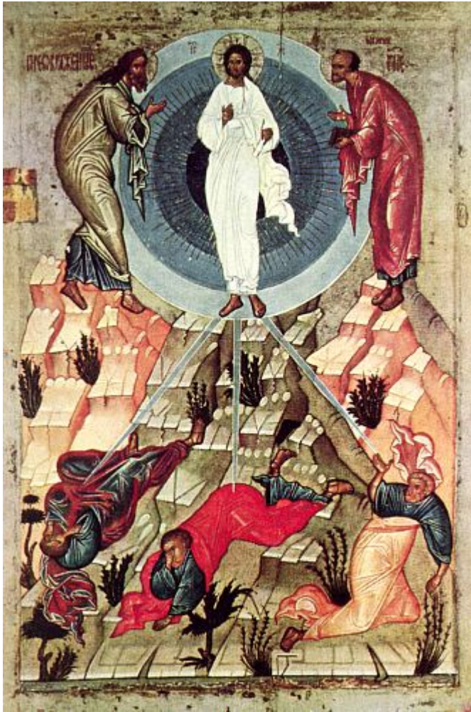
Μεταμόρφωση του Σωτήρος Χριστού

Ορθοδοξία και Ορθοπραξία / Συναξαριακές Μορφές