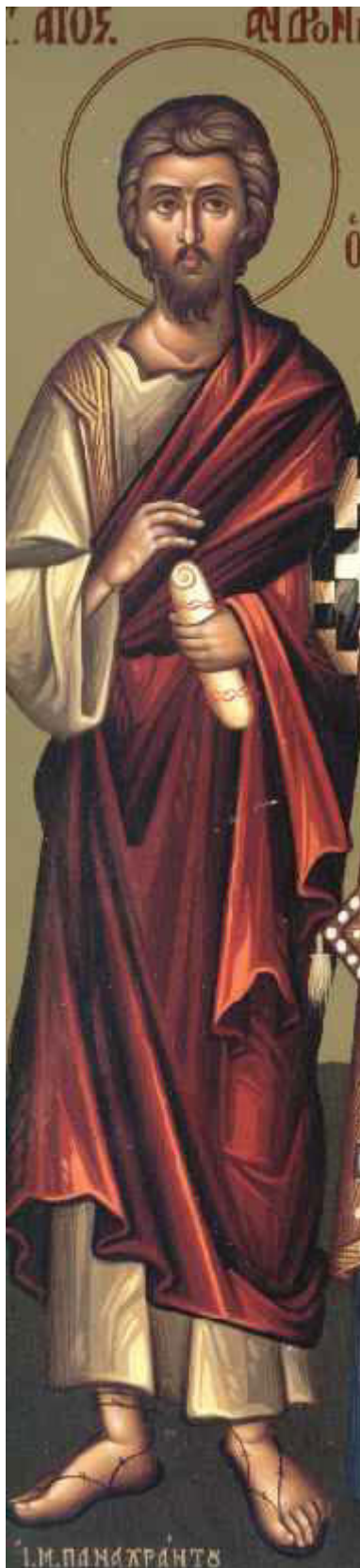
Άγιος Ανδρόνικος ο Απόστολος