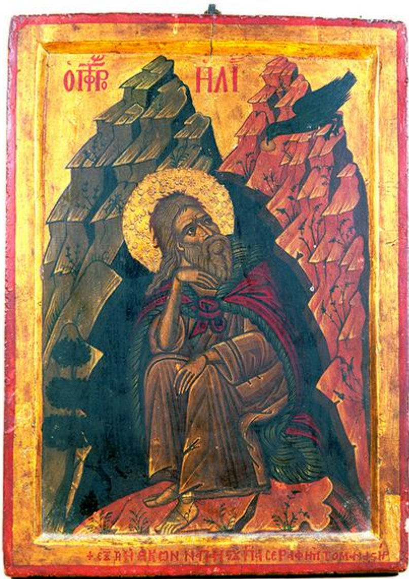
Προφήτης Ηλίας ο Θεσβίτης