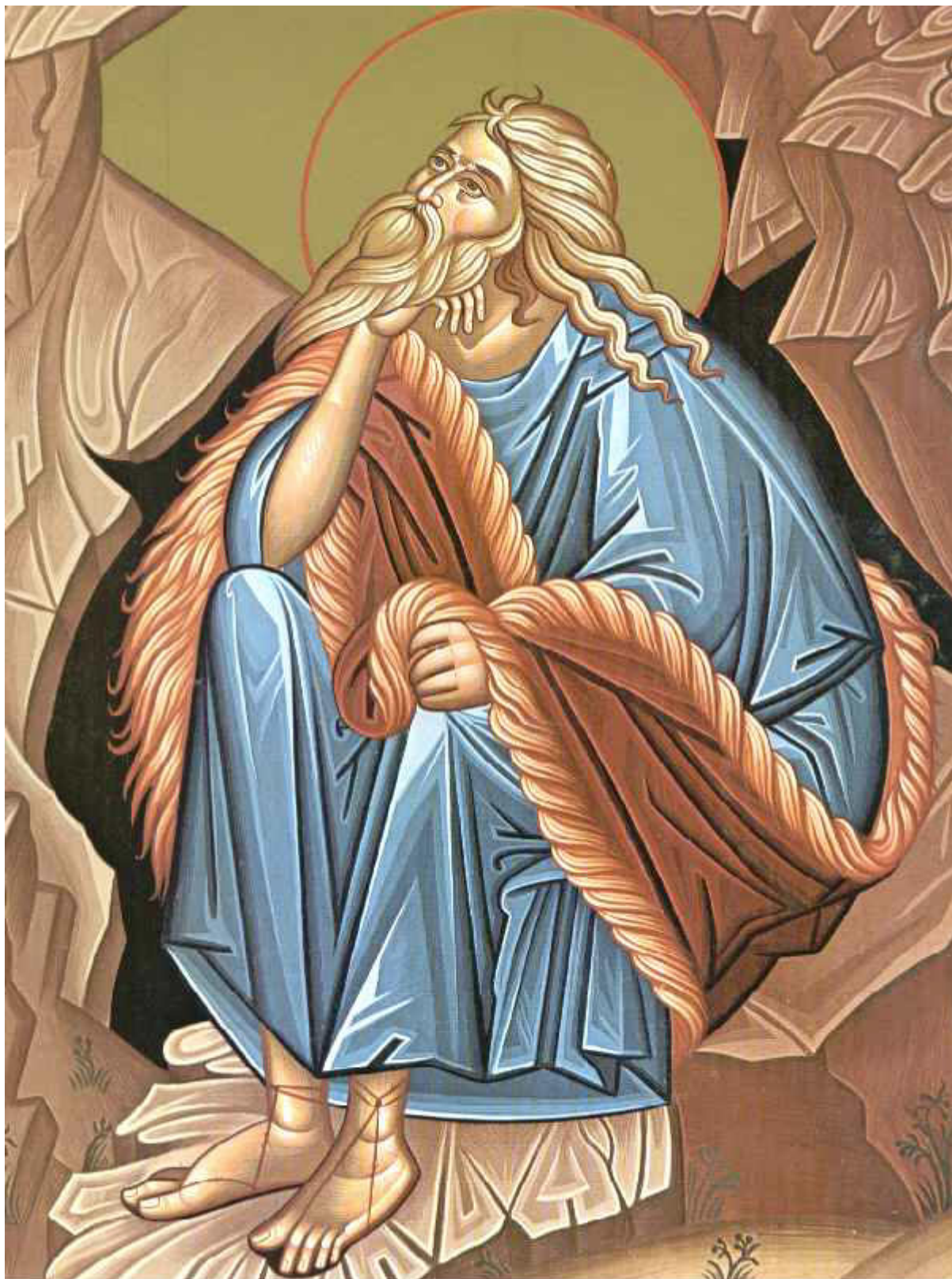
Προφήτης Ηλίας ο Θεσβίτης