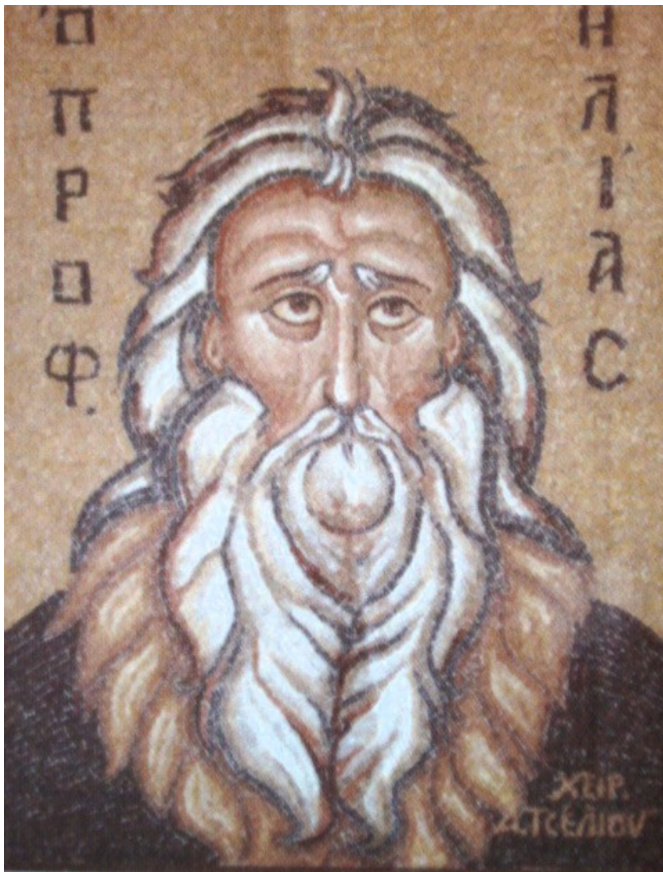
Προφήτης Ηλίας ο Θεσβίτης - Αγγελική Τσέλιου© (diaxeirosaggelikistseliou.blogspot.com)