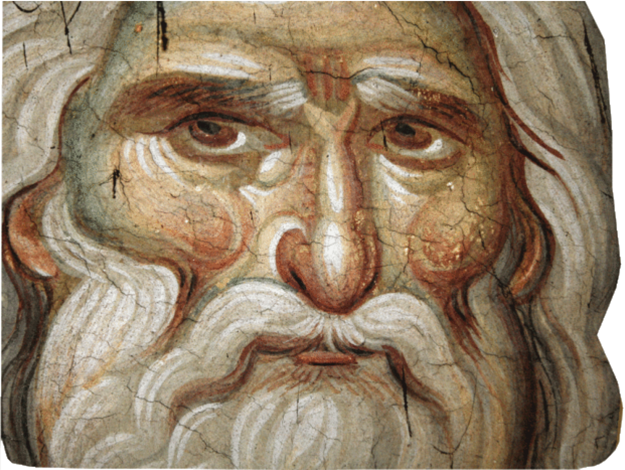
Προφήτης Ηλίας ο Θεσβίτης