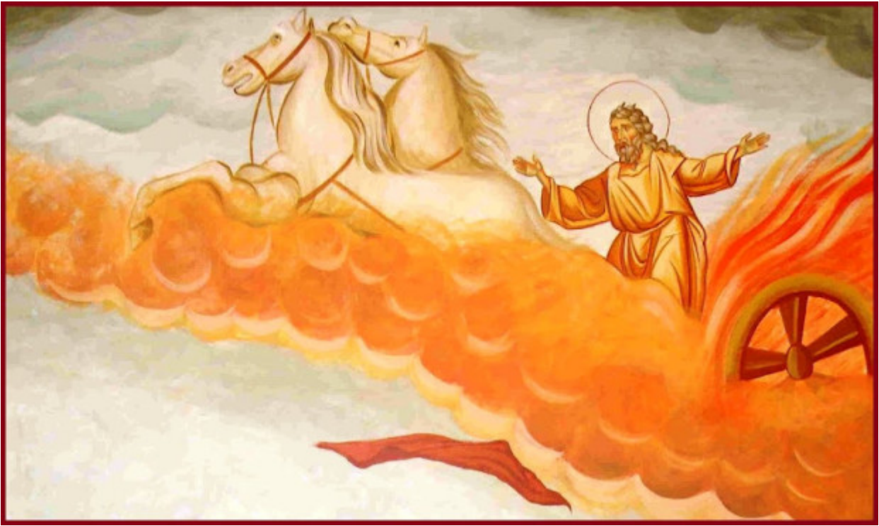
Προφήτης Ηλίας ο Θεσβίτης