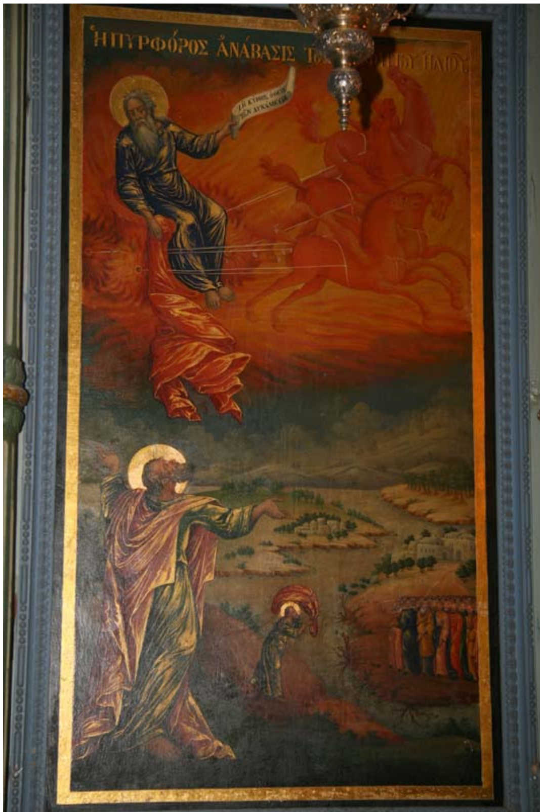
Η εικόνα του Προφήτου Ηλιού στο τέμπλο της Ι.Μ. Ηλιού στα Ιεροσόλυμα