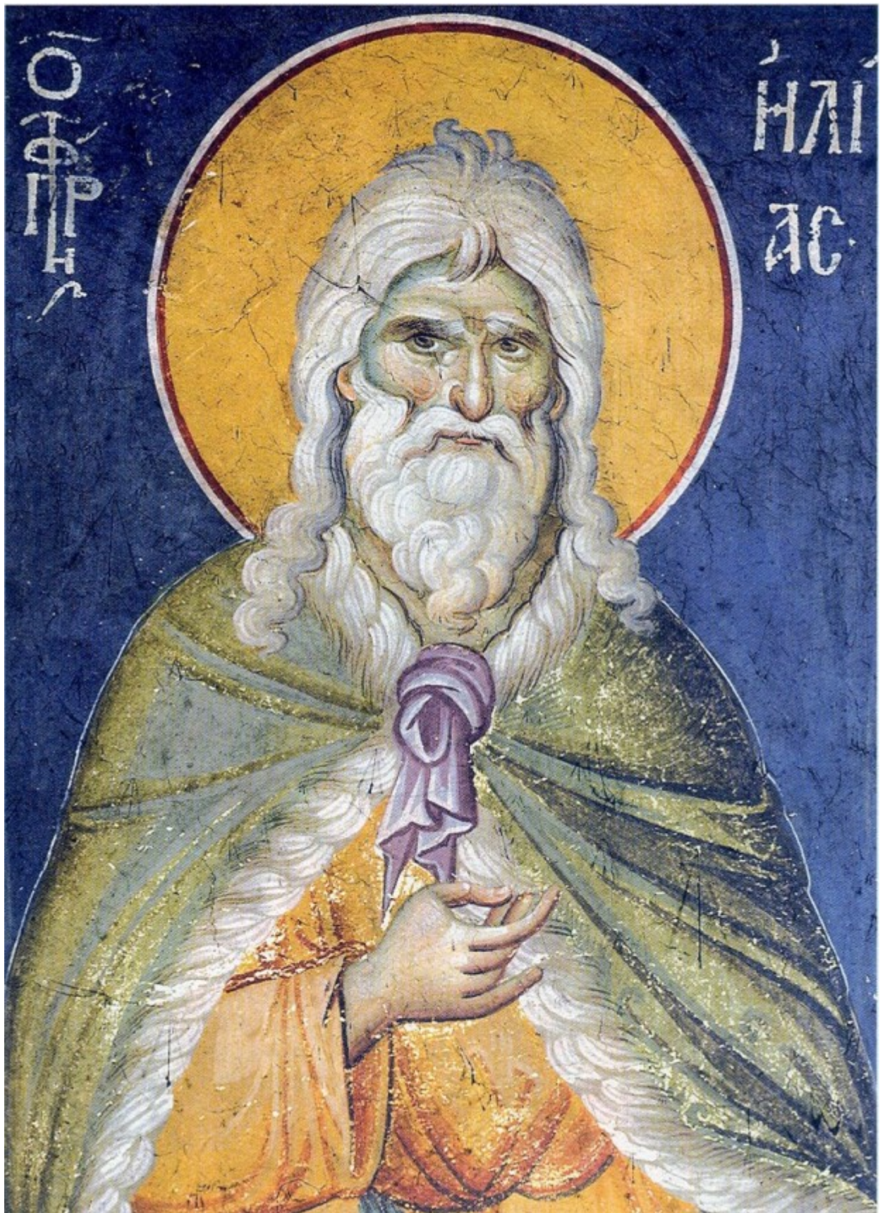
Προφήτης Ηλίας ο Θεσβίτης - Βυζαντινή τοιχογραφία στο Πρωτάτο των Καρυών στο Άγιο Όρος, φιλοτεχνημένη από τον Μανουήλ Πανσέληνος (περ. 1290)