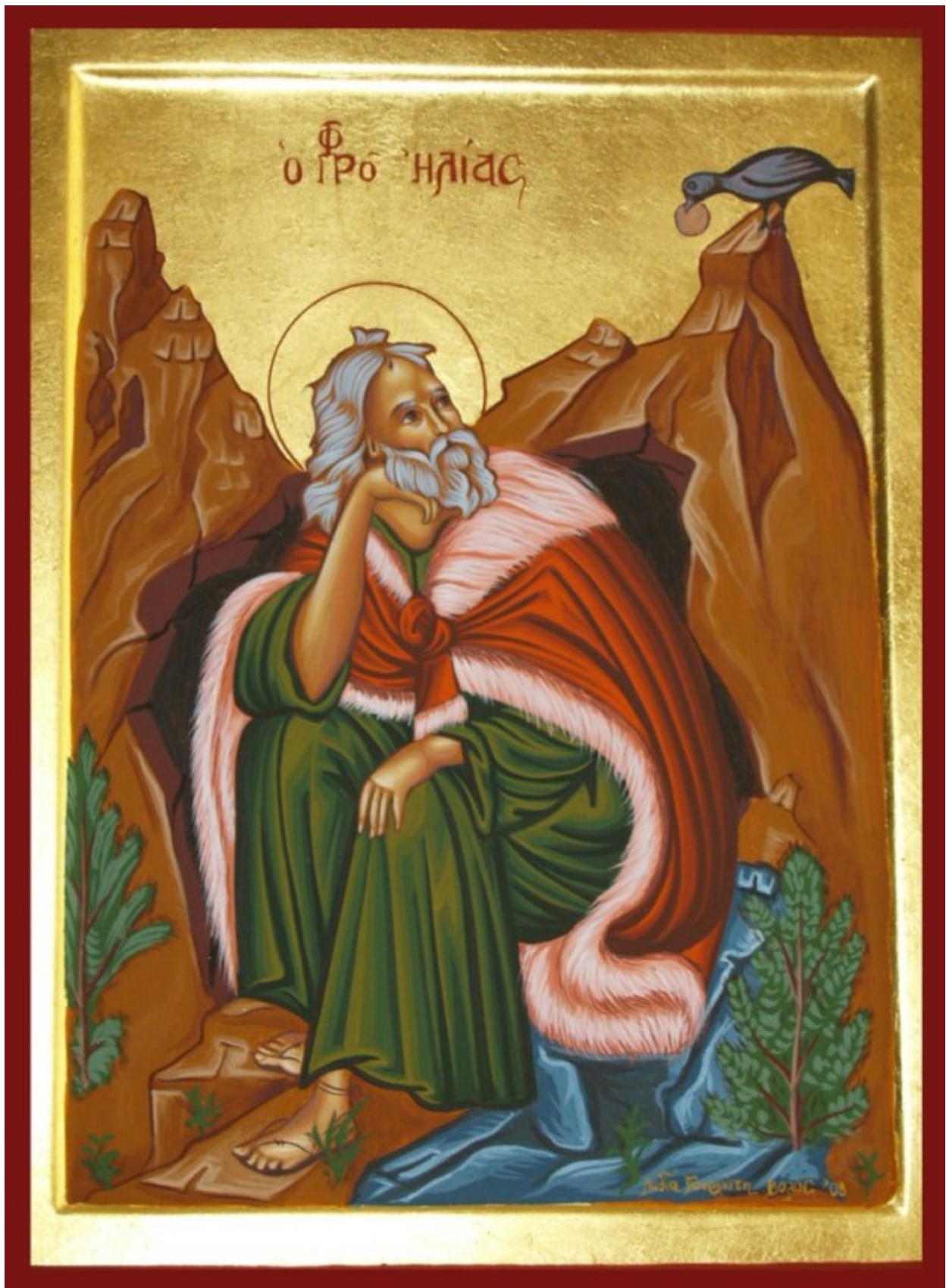
Προφήτης Ηλίας ο Θεσβίτης - Λυδία Γουριώτη© ( http://lydiagourioti-iconography.blogspot.com )