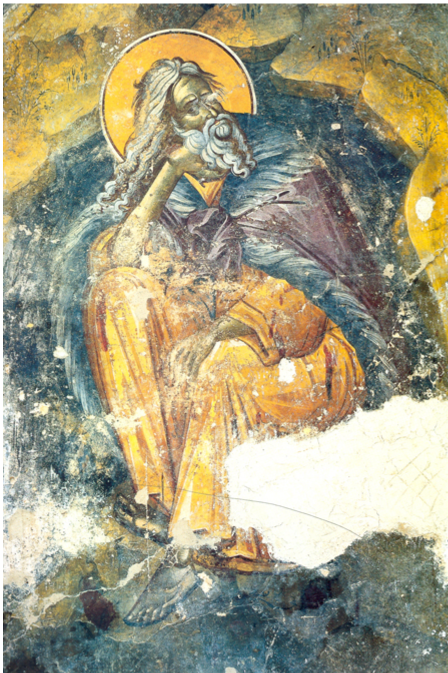
Προφήτης Ηλίας ο Θεσβίτης - Τοιχογραφία του 17ου αιώνα (Ι. Ν. Αγ. Γεωργίου Ακραιφνίου)