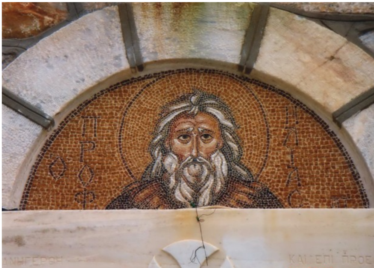
Προφήτης Ηλίας ο Θεσβίτης - Αγγελική Τσέλιου© ( diaxeirosaggelikistseliou.blogspot.com )