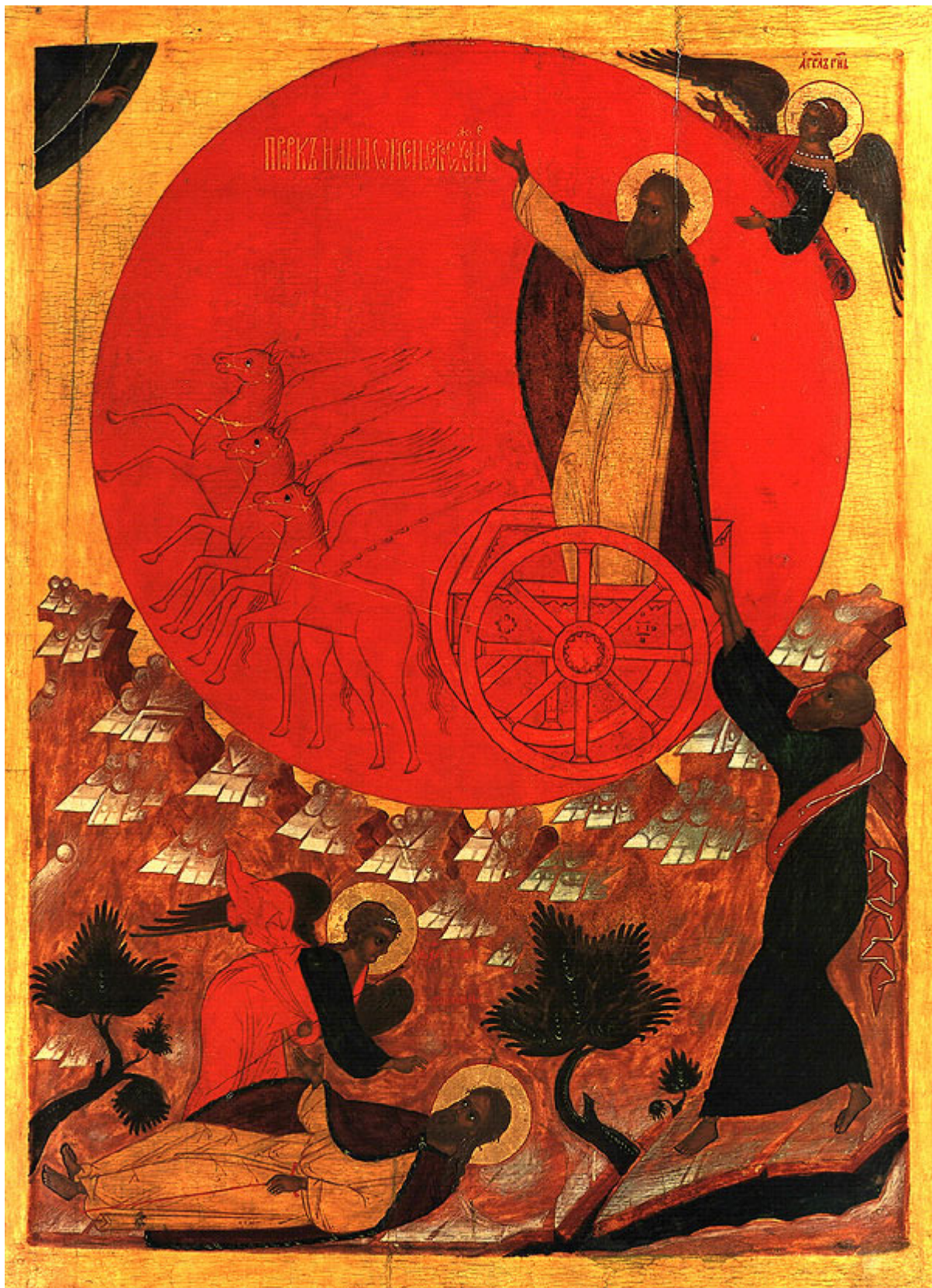
Προφήτης Ηλίας ο Θεοβίτης