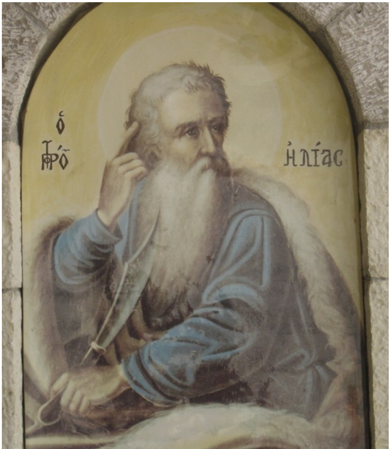
Προφήτης Ηλίας ο Θεσβίτης