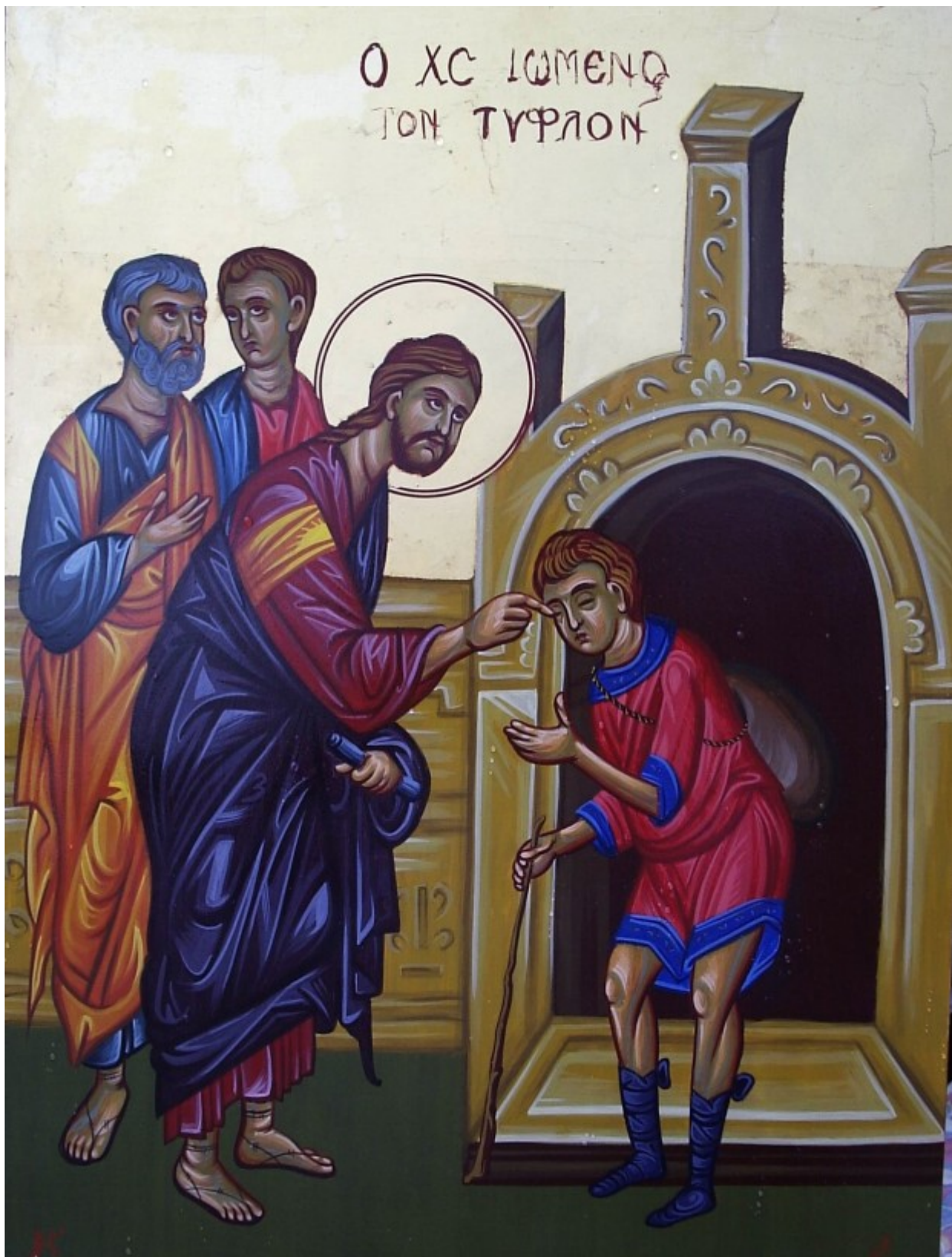
Ο Χριστός ιώμενος τον τυφλόν