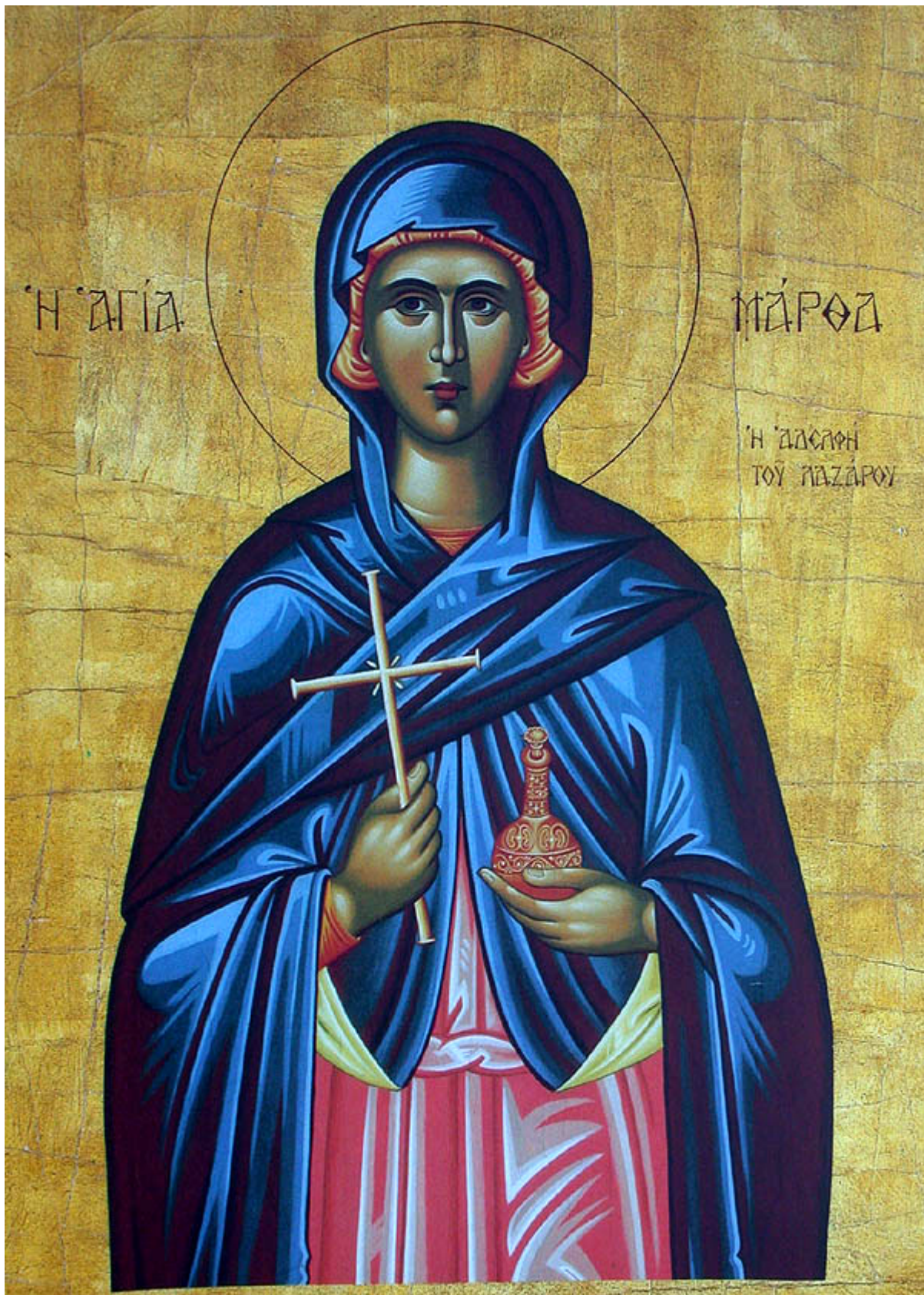
Αγία Μάρθα αδελφή του Λαζάρου