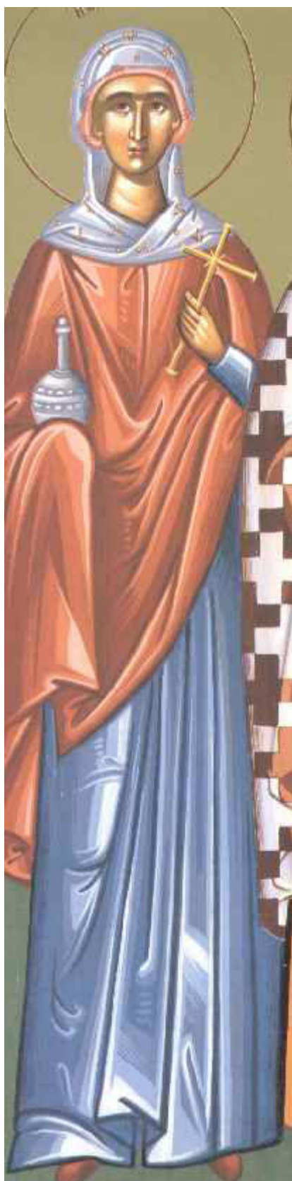
Αγία Μαρία αδελφή του Λαζάρου