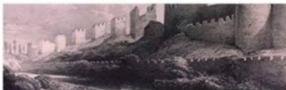
Τα τείχη έπεσαν "Την πόλη επήρε ο Τούρκος"