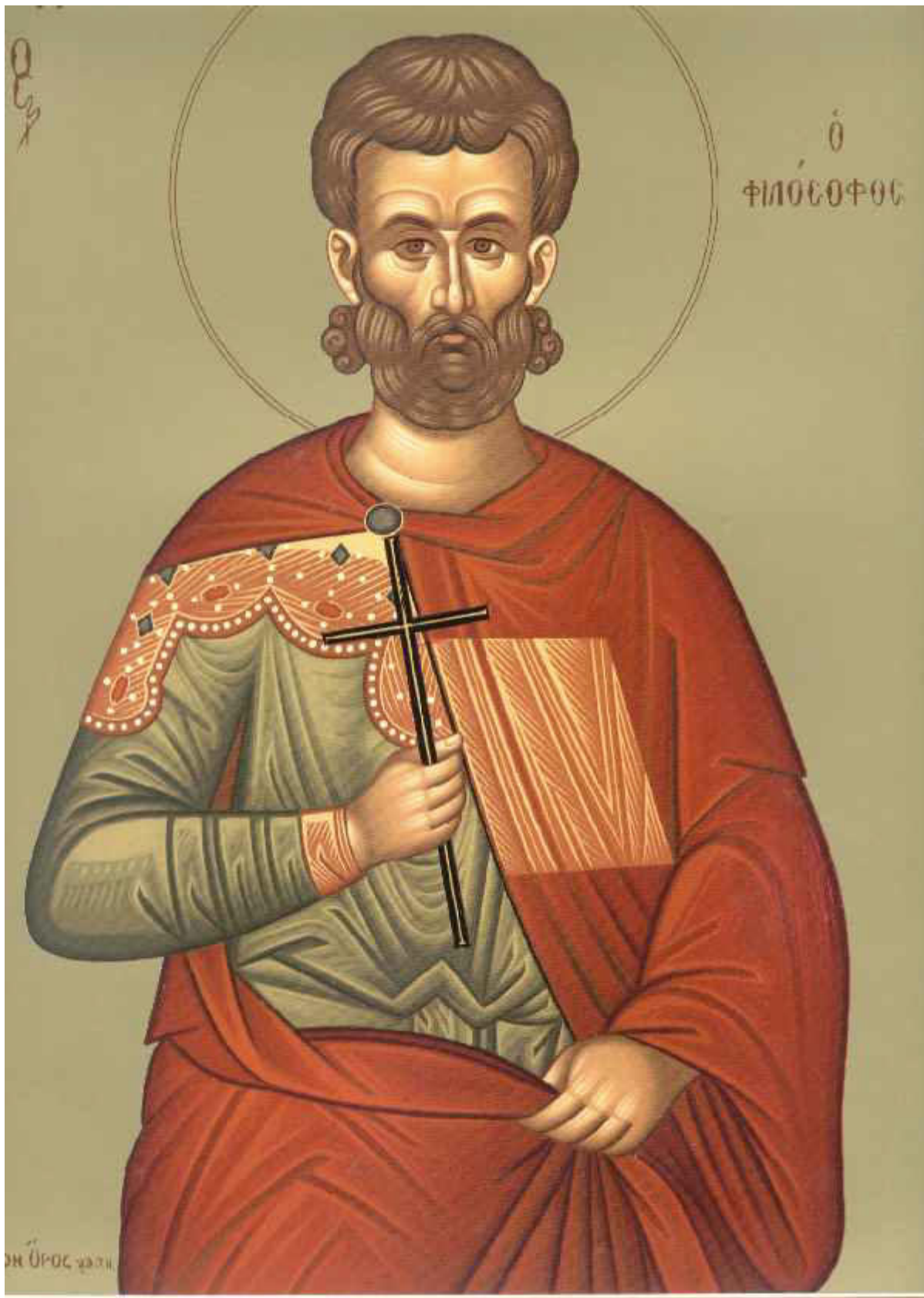
Άγιος Ιουστίνος ο Απολογητής και φιλόσοφος