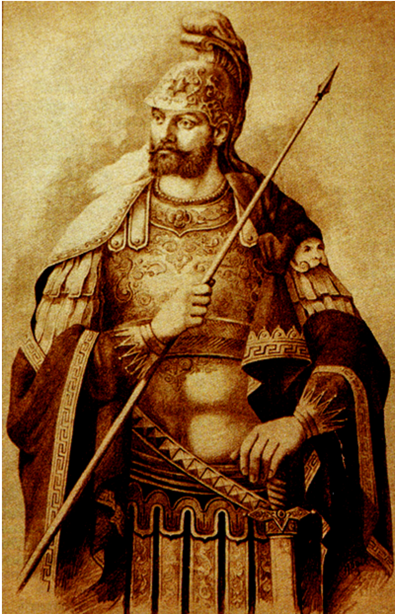
Πάρθεν η Ρωμανία

Έναν πουλίν, καλόν πουλίν εβγαίν' από την Πόλην· ουδέ στ' αμπέλια κόνεψεν ουδέ στα περιβόλια, επήγεν και-ν εκόνεψεν α σου Ηλί' τον κάστρον. Εσείξεν τ' έναν το φτερόν σο αίμα βουτεμένον, εσείξεν τ' άλλο το φτερόν, χαρτίν έχει γραμμένον, Ατό κανείς κι ανέγνωσεν, ουδ' ο μητροπολίτης·