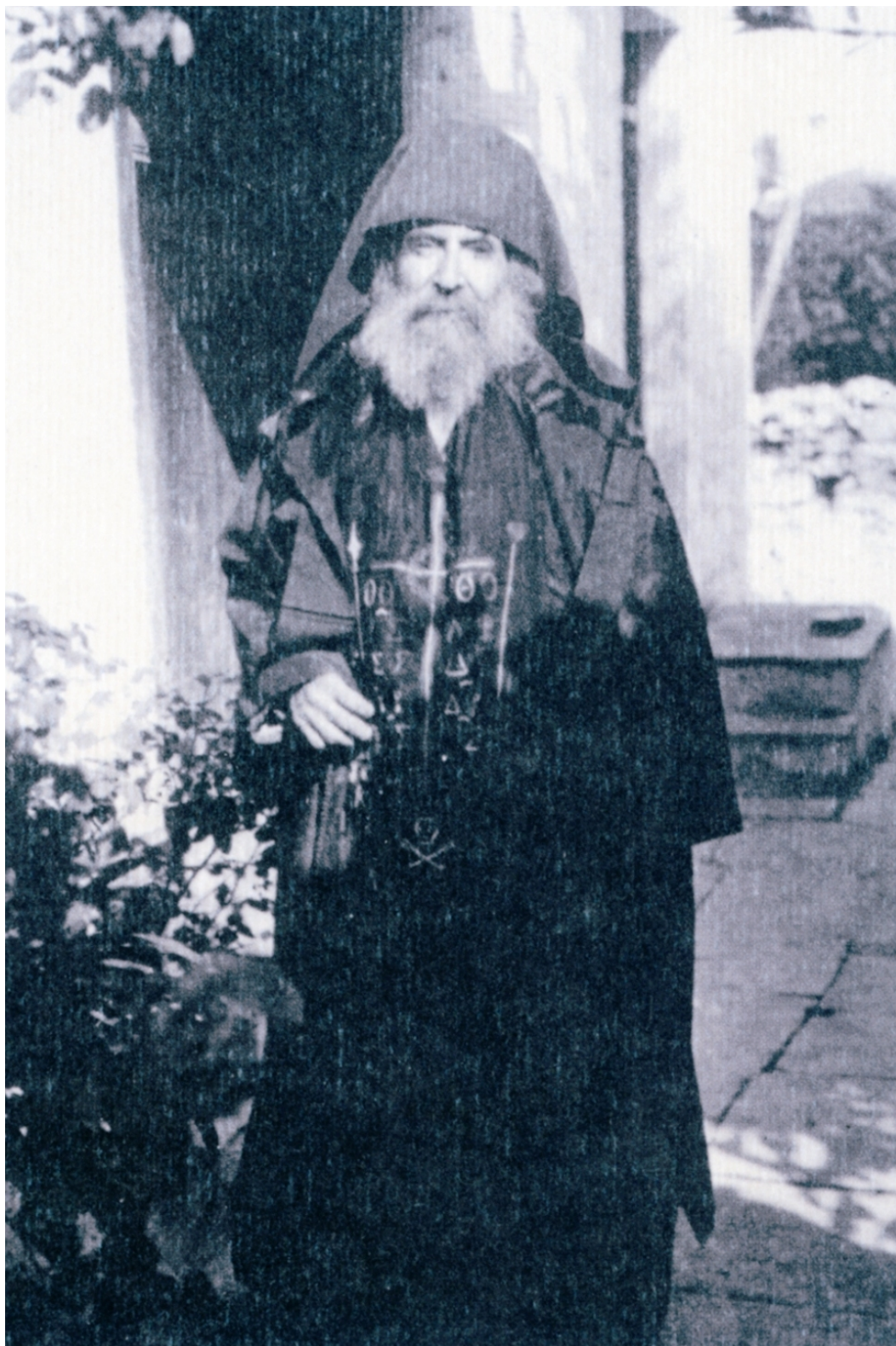
Ο Σκιαθίτης πεζογράφος Αλέξανδρος Μωραϊτίδης υπήρξε πνευματικό τέκνο του Γ. Δανιήλ. Στο έργο του «Με του βοριά τα κύματα» μας δίνει εντυπωσιακές μαρτυρίες για αυτόν. (Στην φωτογραφία ο Μωραϊτίδης έχοντας λάβει το μοναχικό σχήμα με το όνομα Ανδρόνικος).

Σε ένα άλλο σημείο γράφει για την έλξη και επίδραση πού ασκούσε εντός και εκτός του Αγίου Όρους: «Πρωτοστατεί δε έν τη ιστορία πλέον των Κατουνακίων ο Γέρων Δανιήλ ο Σμυρναίος, κατά το έτος 1881 εγκατασταθείς ενταύθα. Ούτος