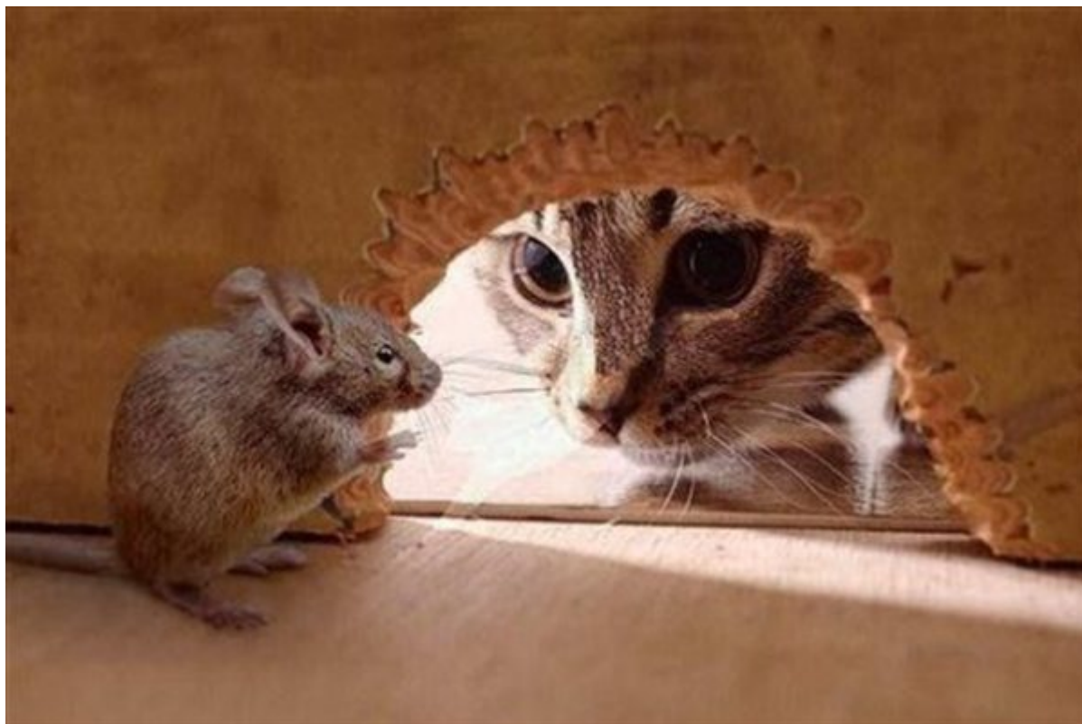
Η μύτη του ποντικού σημαίνει συναγερμό στη μυρωδιά της γάτας