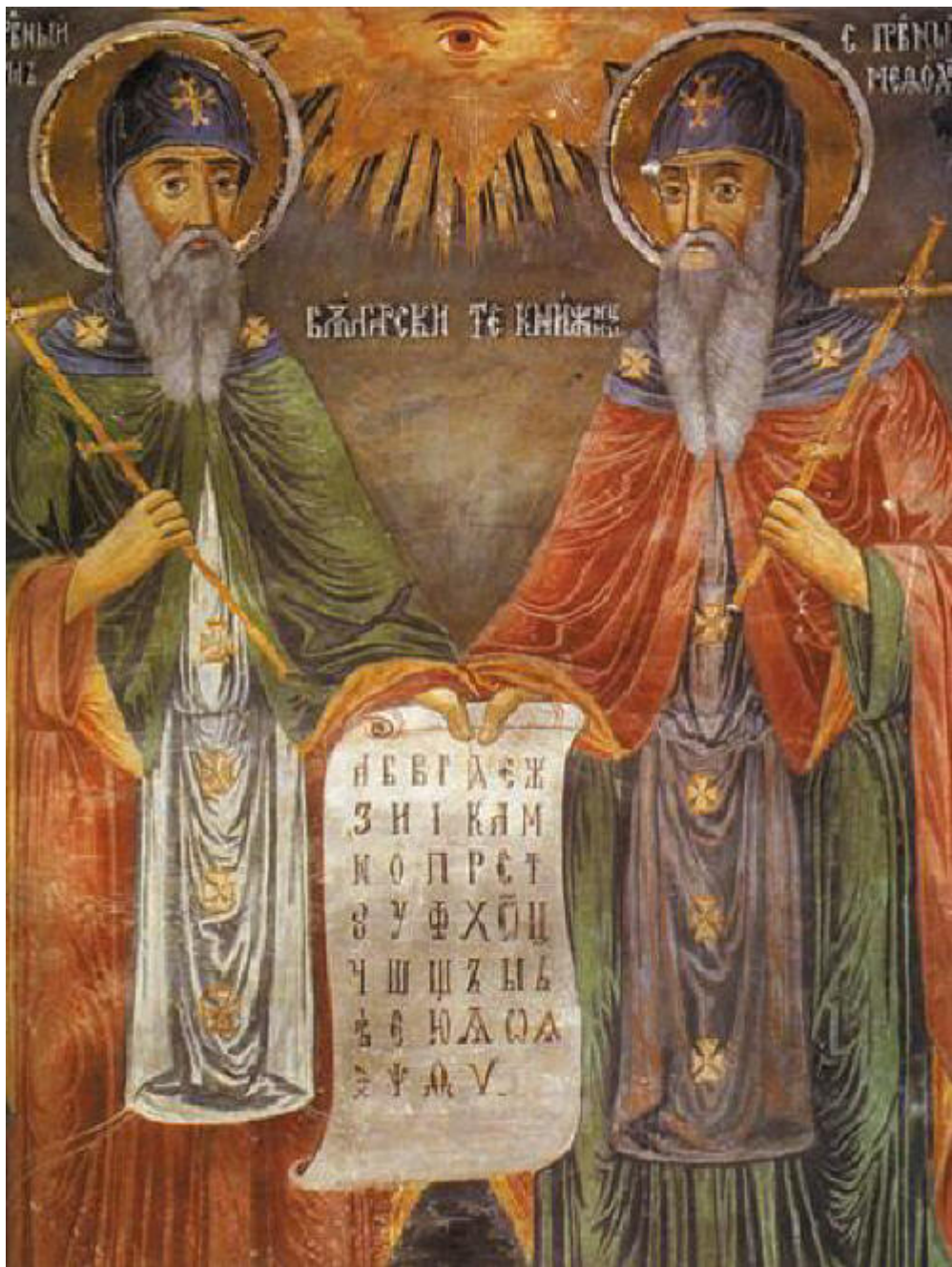
Εικόνα του βούλγαρου αγιογράφου Zahari Zograf (1810 - 1853 μ.Χ.) που βρίσκεται στο μοναστήρι Troyan (1848 μ.Χ.)