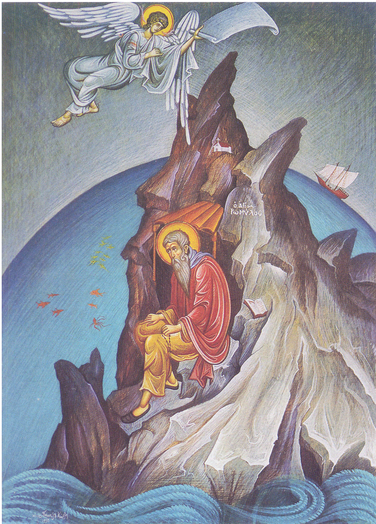
Όσιος Ρωμύλος της Ραβάνιτσας. Σύγχρονη εικόνα Ι.Μ.Δοχειαρίου. Από το βιβλίο του Μωυσέως Μοναχού